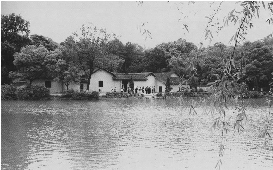
■ 刘少奇故乡——湖南省宁乡县花明楼乡炭子冲。