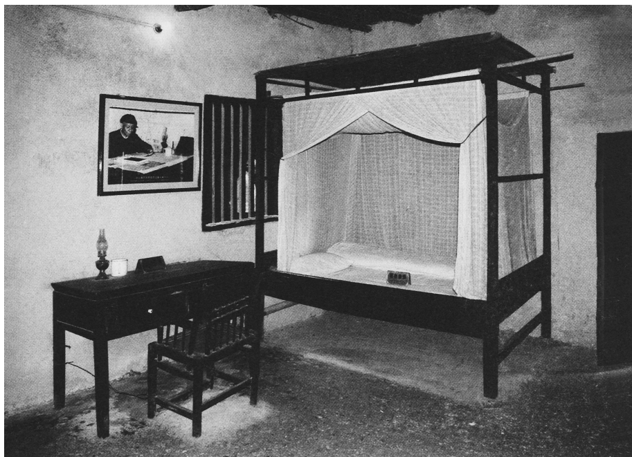
■ 刘少奇青少年时期的卧室。