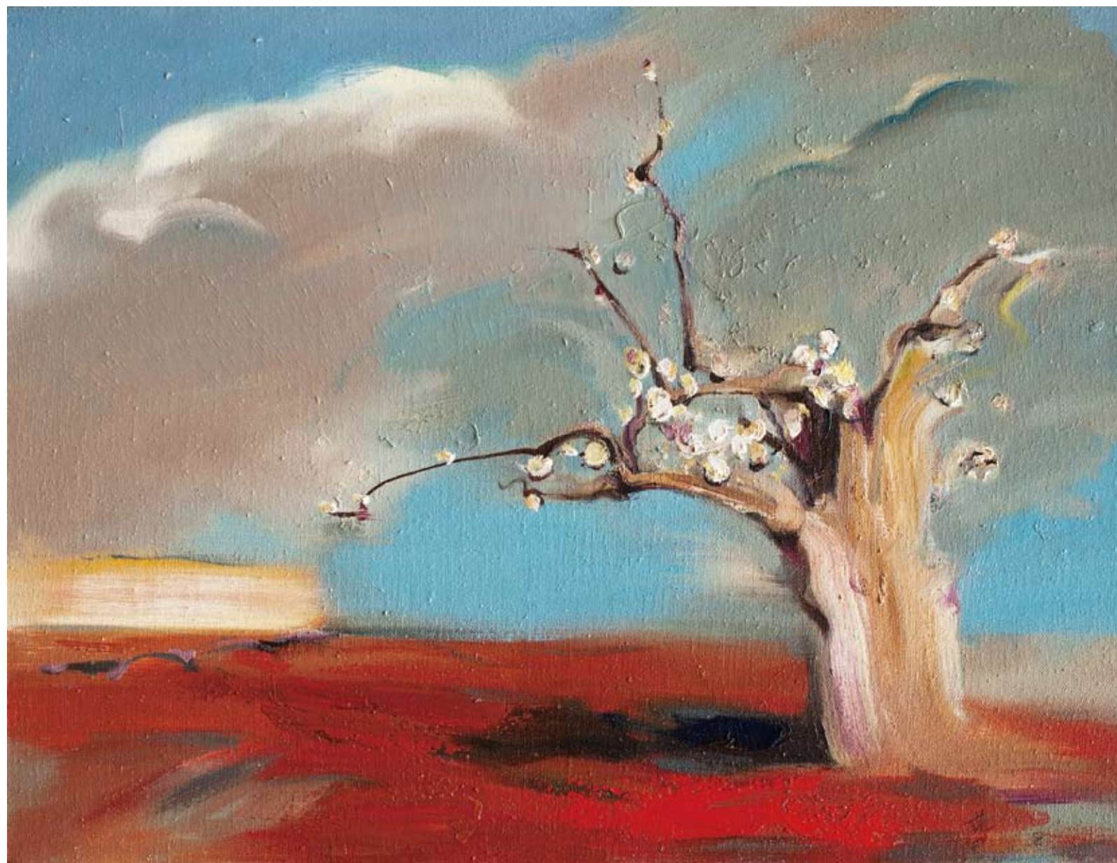
冬日花开 45 × 60cm 2005