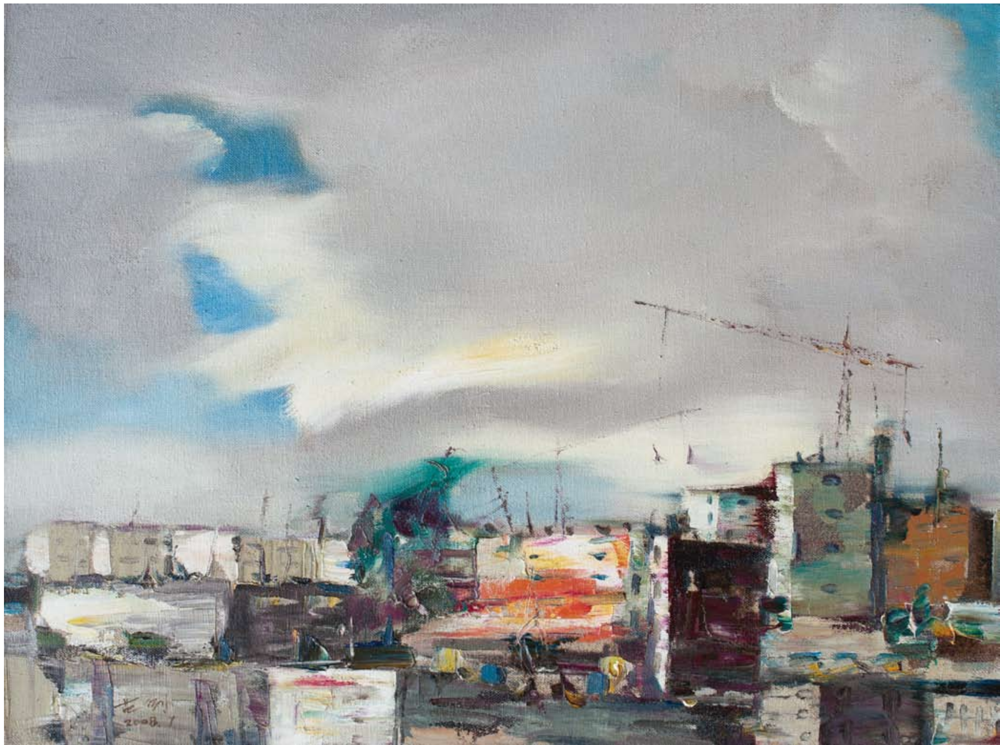
城市5 45 × 60cm 2008