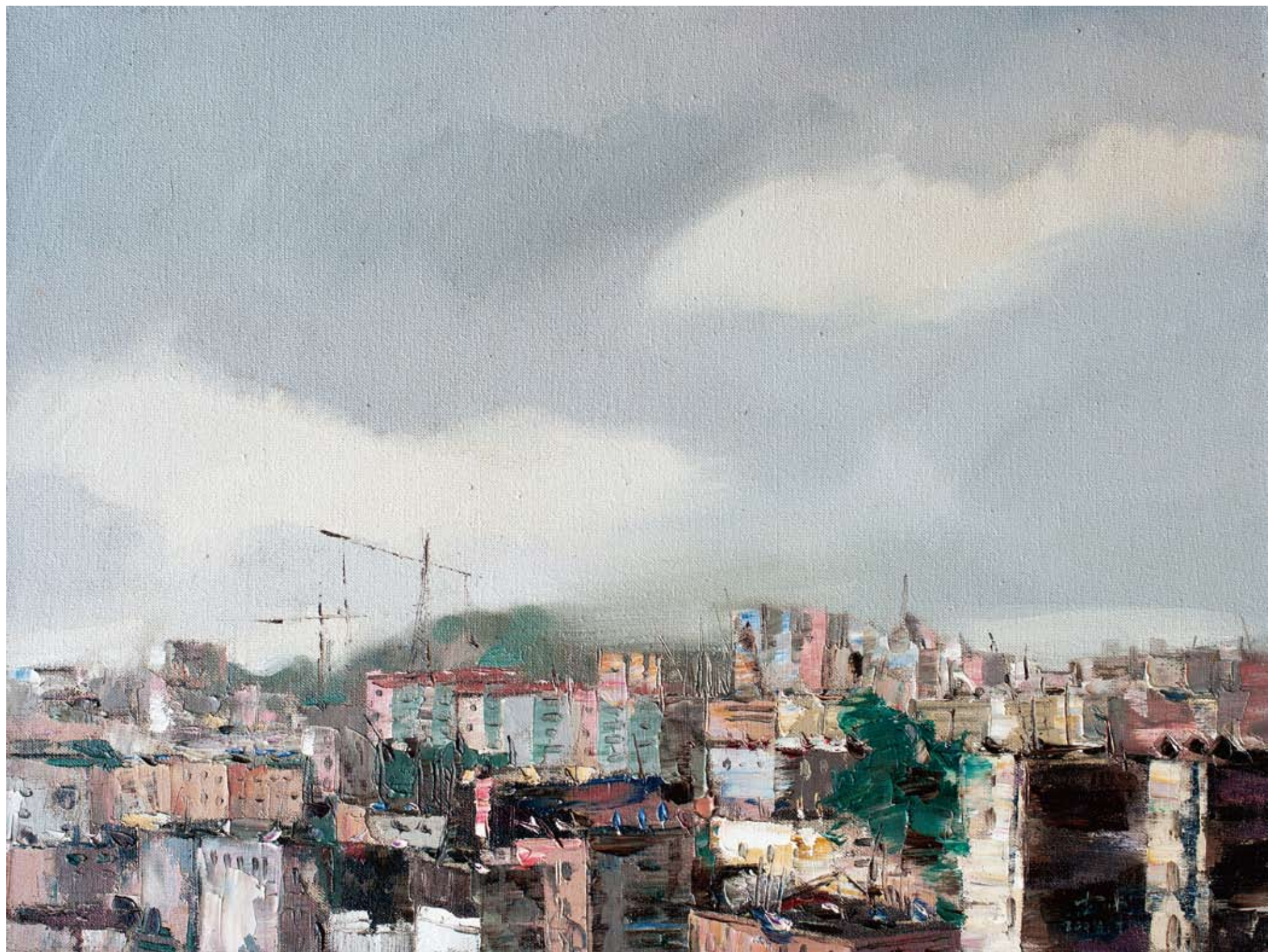
城市1 45 × 60cm 2008