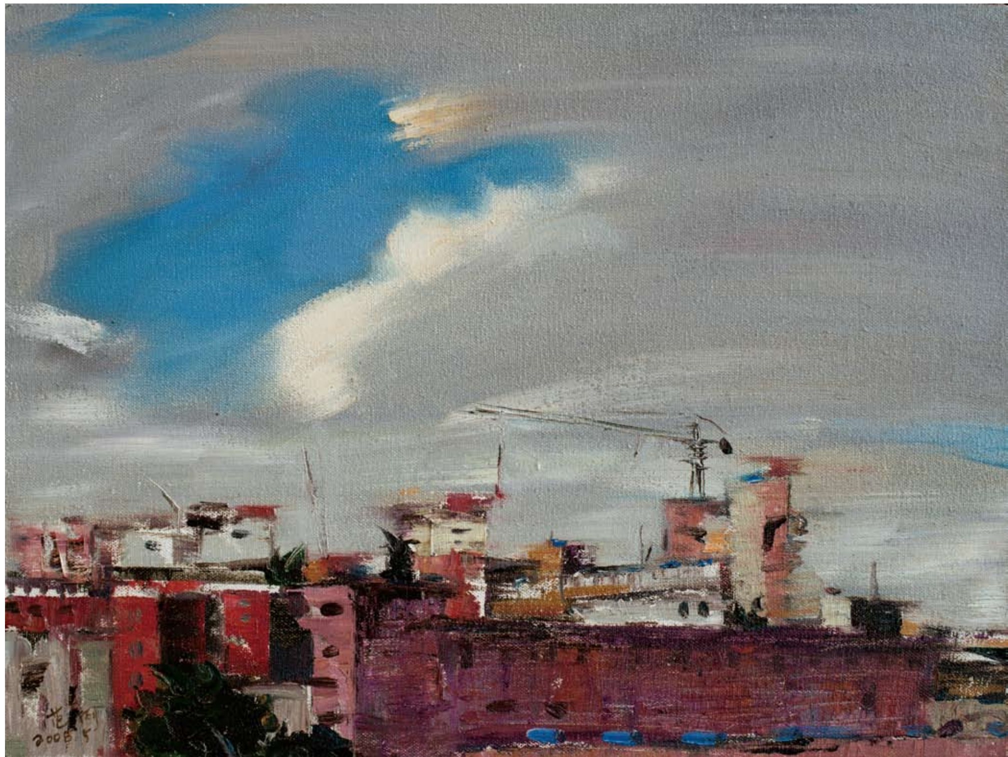
城市3 45 × 60cm 2008