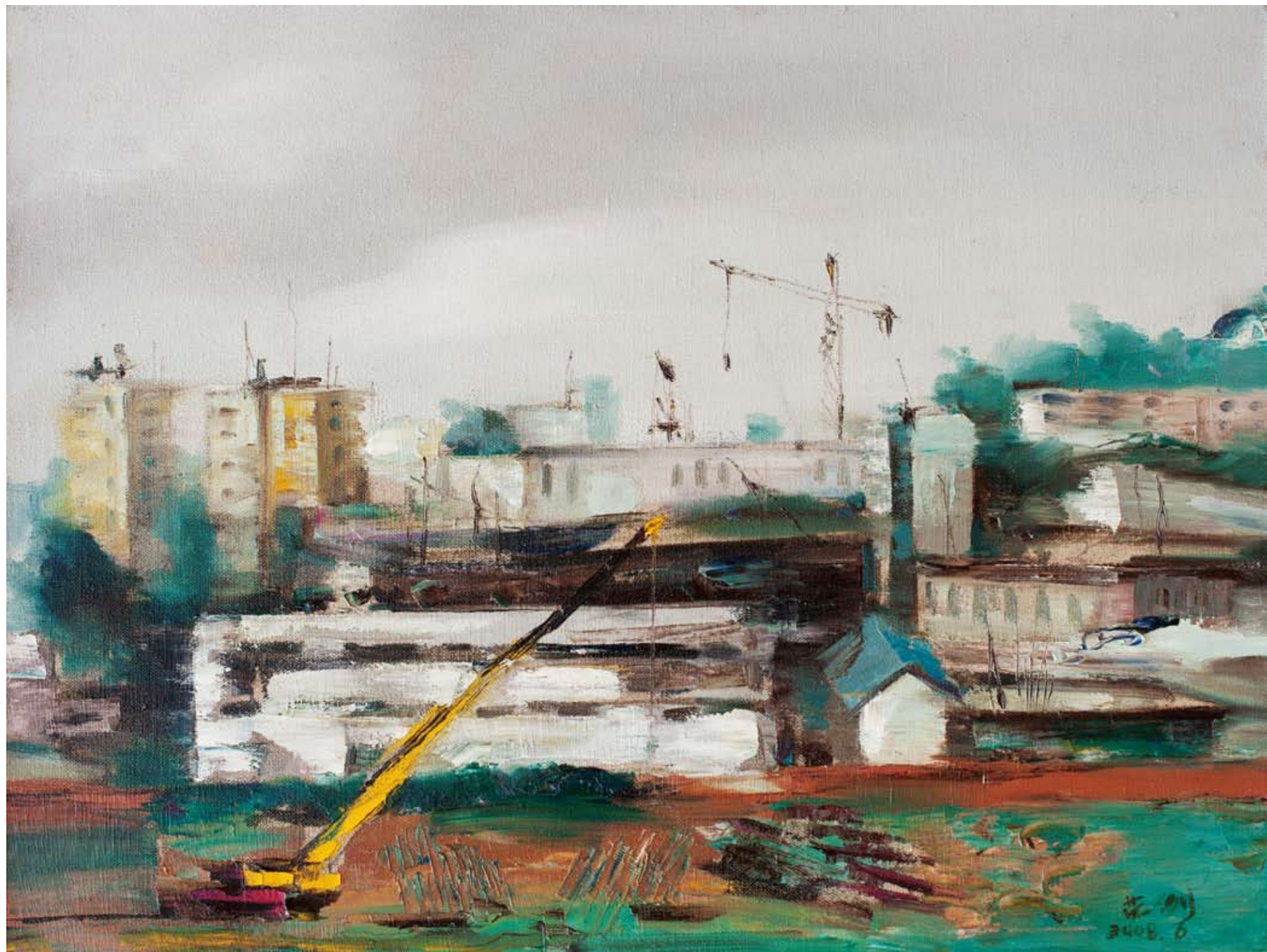
城市4 45 × 60cm 2008