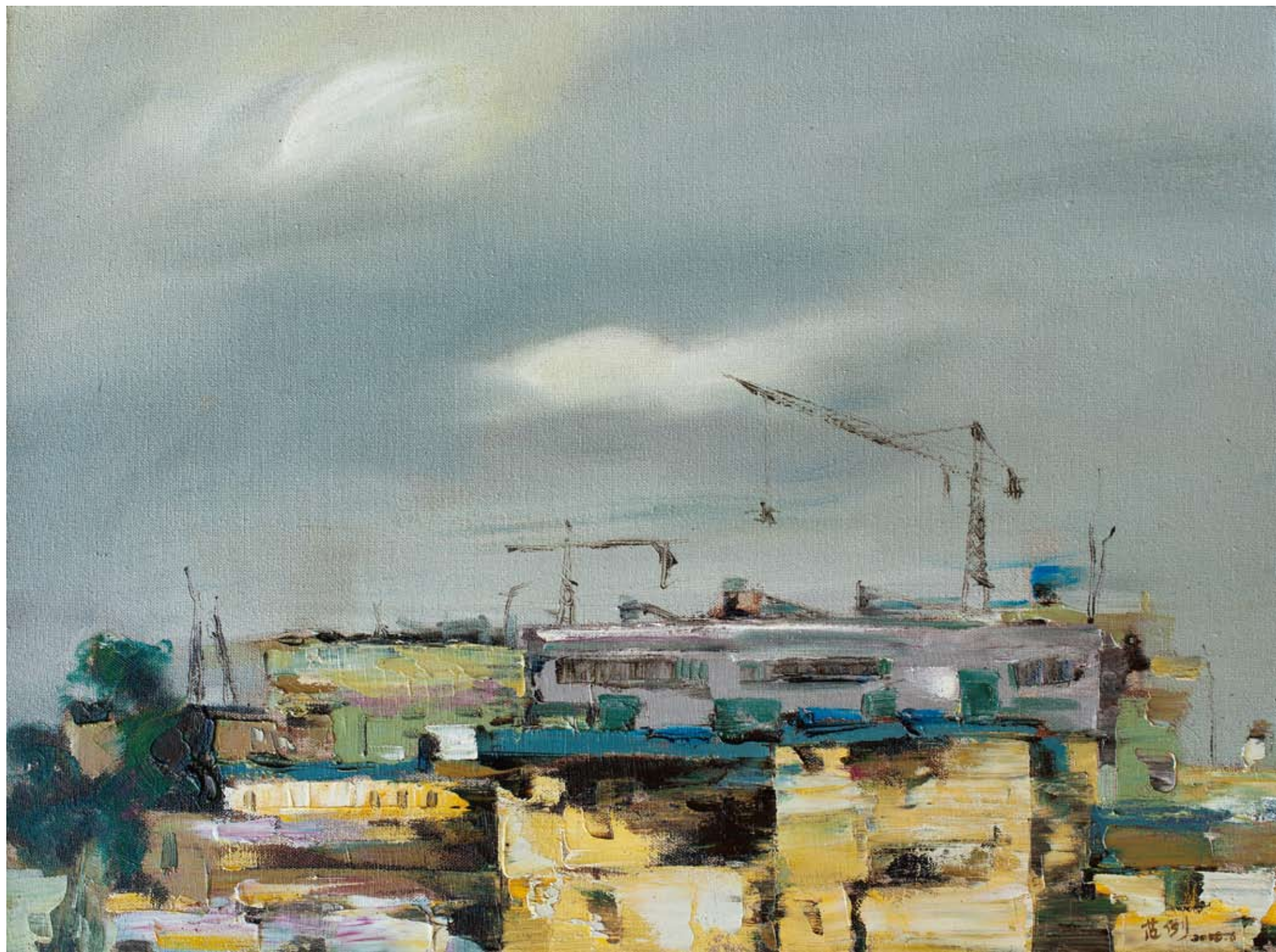
城市7 45 × 60cm 2008