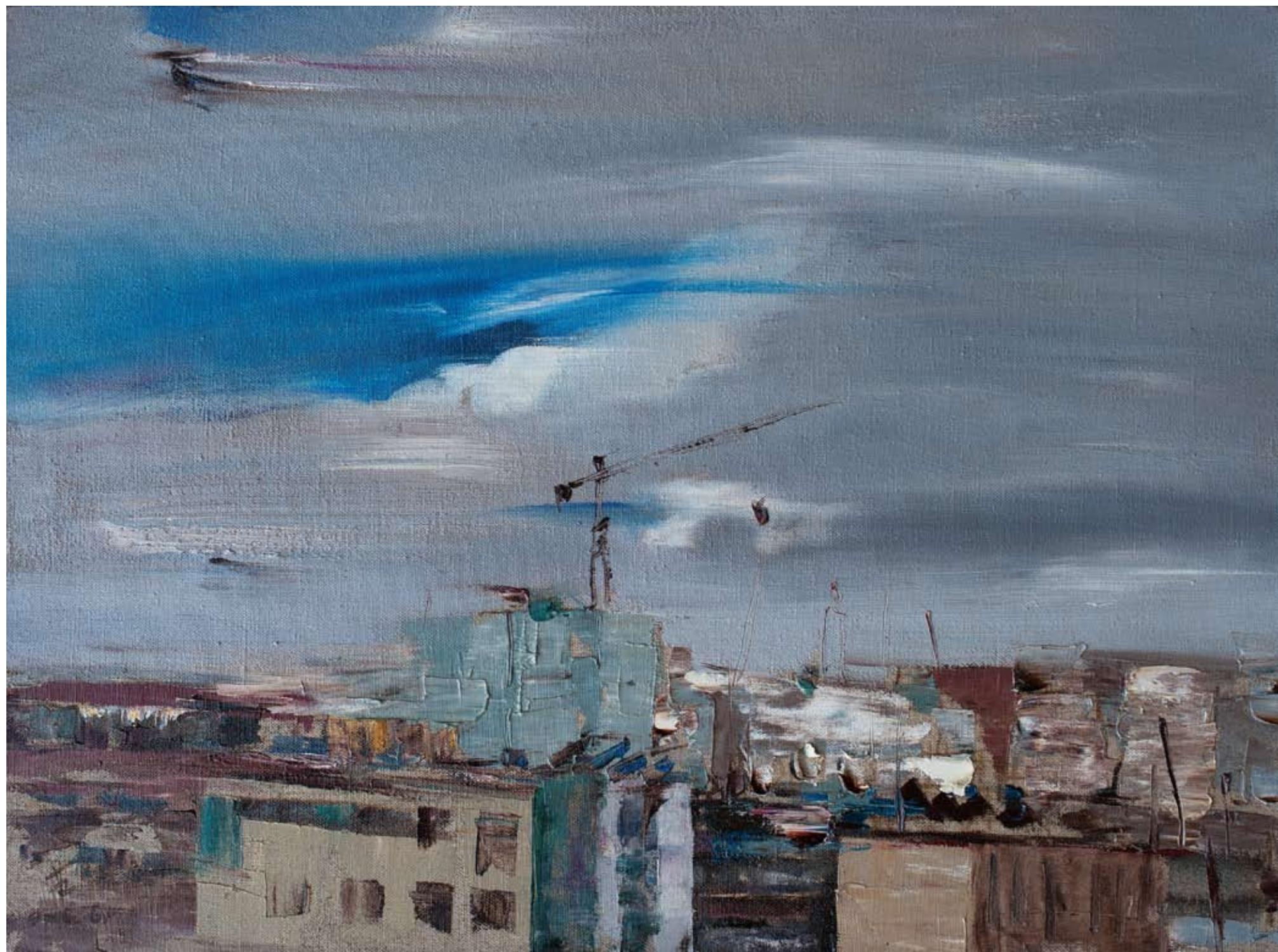
城市8 45×60cm 2008