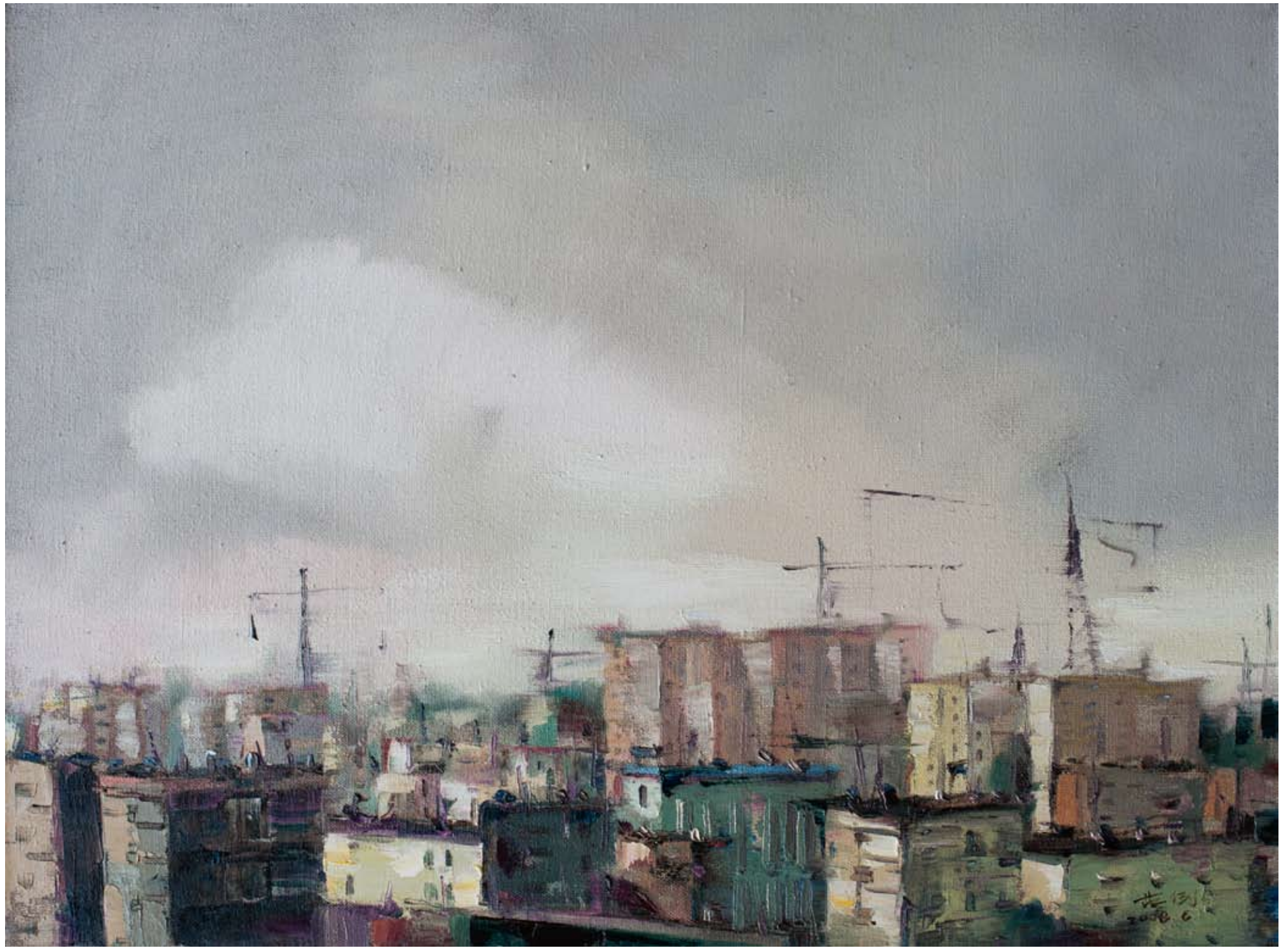
城市6 45 x 60cm 2008