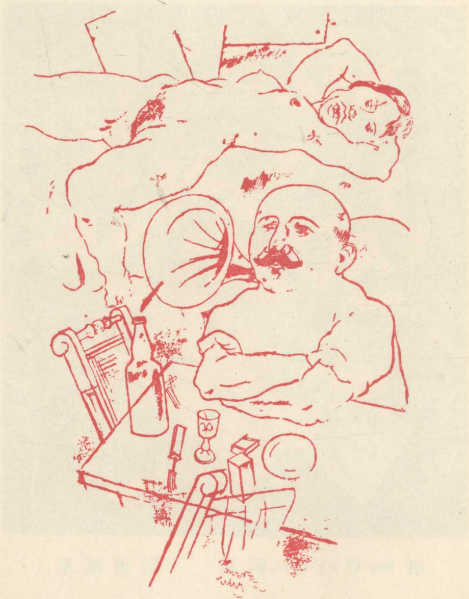
內秘的布爾喬亞的鏡 德國 George Grosz 作