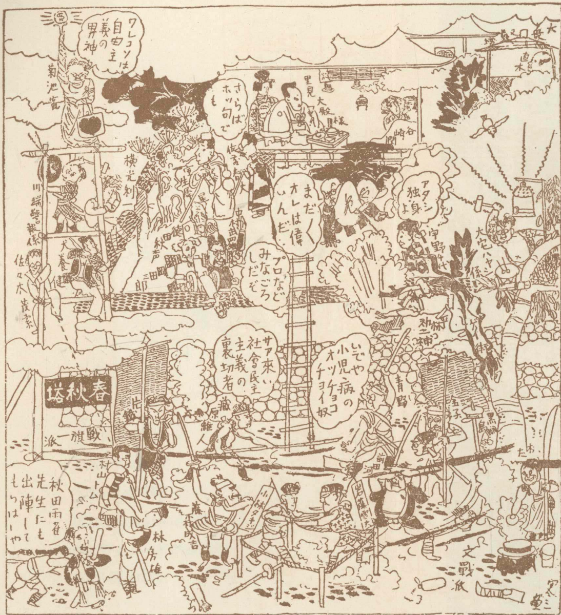
一九二九年日本文壇鳥瞰圖