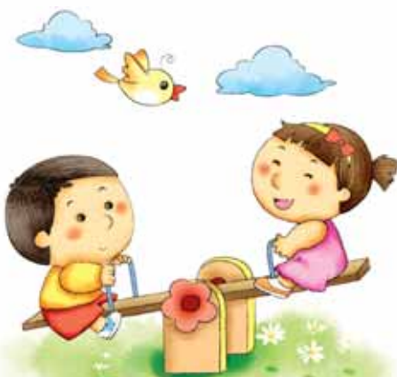
小朋友在玩跷跷板。