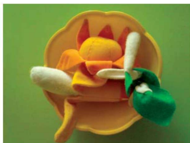
图 1-1-8 表征性玩教具 4