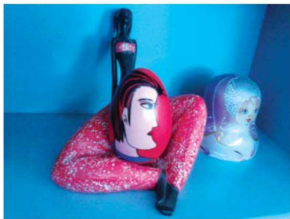
图 1-1-24 娱乐性玩具 4