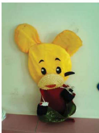
图 1-1-3 自制玩教具

(1) 按玩教具制作途径的不同进行分类，可分为自制玩教具(图 1-1-3)和工业成品玩教具(图 1-1-4)。自制玩教具又可分为成人制作的玩教具和学前儿童在教师指导下制作的玩教具。