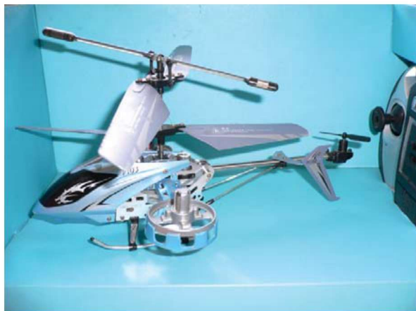
图 1-1-33 遥控飞机

现代商业玩具多选用塑料、木头、钢铁等材料制造，不仅坚固牢实，能长时间使用，而且声、光、电、色齐全，能极大吸引幼儿的兴趣。目前，现代商业玩具的发展趋势：一是现代商业玩具将孩子引向一个新的游戏世界，更多地模仿电视、电影里的活动而不是模仿现实成人的活动。如恐龙系列、勇士系列等。二是现代商业玩具从满足父母的需要和价值观，转向直接引导孩子的渴望与想象，抓住了孩子们对新奇玩具的巨大需求，融入了高科技电子技术。如遥控电动玩具、光控玩具、电子计算机、电动模型等越来越受欢迎，尤其是遥控类的汽车、飞机、舰艇模型等(图1-1-33)。三是现代商业玩具注重教育手段的开发，具有了某种教育功能。如智能娃娃、点读玩具等。