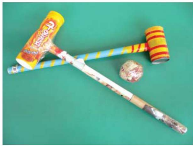
图 1-1-14 运动性玩教具 2