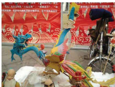
图 1-1-27 观赏型民间玩具

中国民间玩具按娱乐性质可分为：观赏型，如毛猴、面塑及泥塑戏文故事等（图 1-1-27）；食玩型，如面花、糖人等（图 1-1-28）；动作型，如不倒翁、皮叫虎、陀螺、风筝等；响声型，如小喇叭、泥咕咕、叫叫鸡等。按工艺手段可分为：编结玩具，如粽编、竹编、草编等（图 1-1-29）；彩扎玩具，如风筝、纸扎玩具等（图 1-1-30）；缝制玩具，如布玩具；雕刻玩具，如木雕、玉雕、石雕、核雕等；捏塑，如泥、面玩具等（图 1-1-31）；陶制玩具，如陶哨、瓷玩具等（图 1-1-32）。