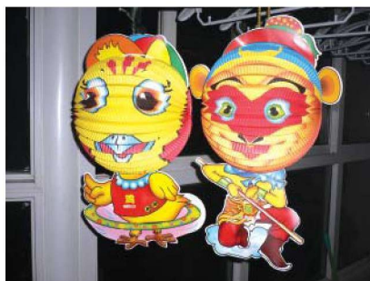
图 1-1-30 彩扎玩具