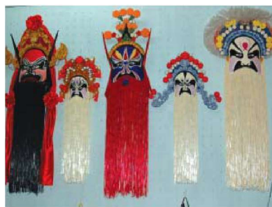
图 1-1-29 编结玩具