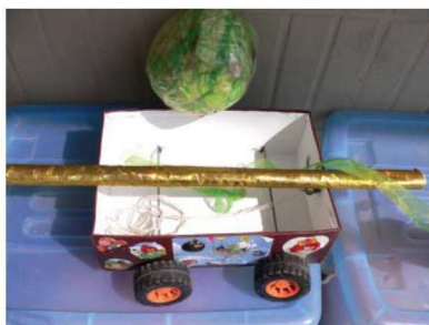
图 1-1-9 表征性玩教具 5