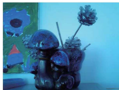
图 1-1-23 娱乐性玩教具 3