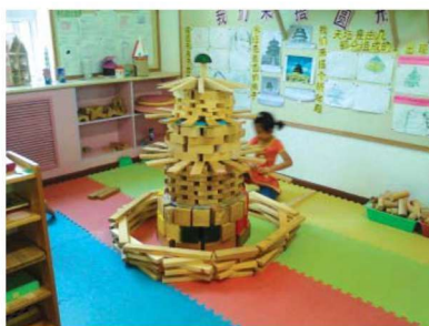
图 1-1-12 建构性玩教具