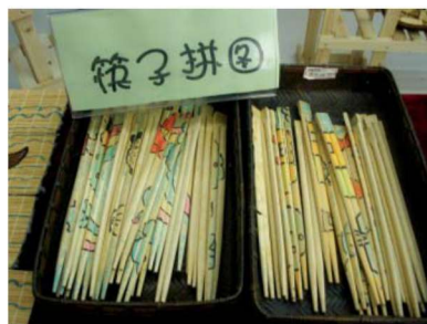
图 1-1-10 教育性玩教具 1