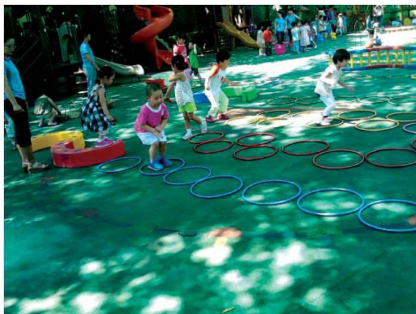
图 1-1-2 玩教具 2

学前儿童玩教具是形象化与思想性的结合。一方面，学前儿童玩教具的各因素都要求学前儿童玩教具是形象、具体、生动的；另一方面，幼儿时期形成的认识在大脑中会留下深刻的印象，对其进一步发展将产生深远的影响，因此学前儿童玩教具包含一定的思想性和教育期望，在学前教育中起重要的辅助作用(图 1-1-2)。