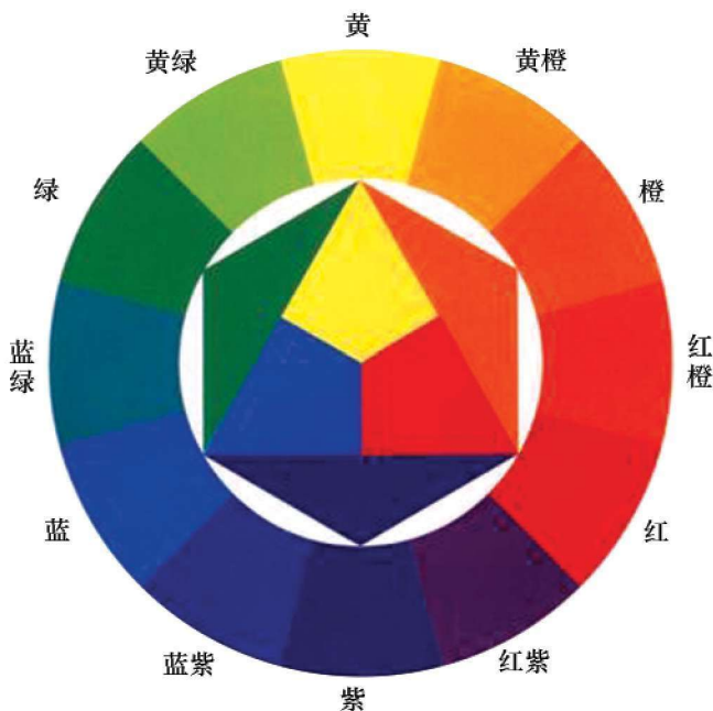
图 1-2-2 色相环

是处理好对比与调和的关系。对比与调和是造成所有色彩效果的全部手段。当两种以上的色彩放在一起，能显现出清晰可见的差别时，我们称之为色彩的对比。各种色彩的色相、纯度、明度、形状、位置、面积的差异构成了色彩之间的差异。这种差异越大，对比效果就越明显，缩小或减弱这种差异，对比效果趋向缓和，即色彩的调和。所以，色彩的对比和调和可以看成是一对矛盾的两个方面，它们之间很难划定绝对界限，只是相对而言。下面结合色相环来说明一些色彩的搭配技巧(图 1-2-2)。