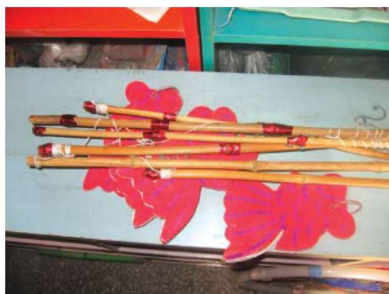
图 1-1-17 运动性玩教具 5