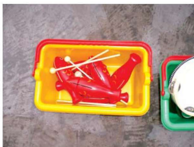
图 1-1-22 娱乐性玩教具 2