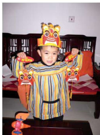
图 1-1-4 工业成品玩教具