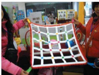
图 1-1-18 运动性玩教具 6