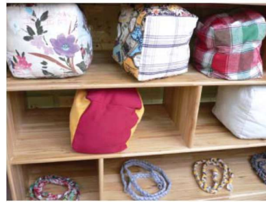
图 1-1-16 运动性玩教具 4