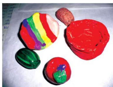
图 1-1-7 表征性玩教具 3