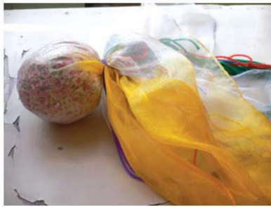
图 1-1-15 运动性玩教具 3