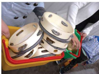
图 1-1-21 娱乐性玩教具 1

娱乐性玩教具指各种模拟乐器和滑稽造型的玩教具(图 1-1-21 至图 1-1-25)。综合性玩教具的功能较为全面,具有一物多用的特征(图 1-1-26)。