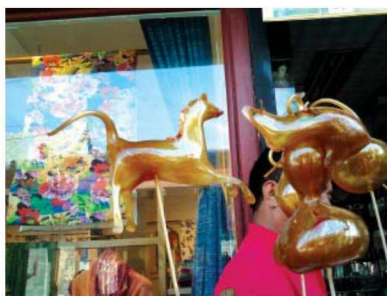
图 1-1-28 食玩型民间玩具