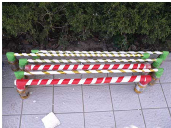
图 1-1-20 运动性玩教具 8

娱乐性玩教具指各种模拟乐器和滑稽造型的玩教具(图 1-1-21 至图 1-1-25)。综合性玩教具的功能较为全面,具有一物多用的特征(图 1-1-26)。