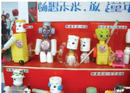
图 1-1-25 娱乐性玩具 5