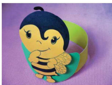
图 1-1-5 表征性玩教具 1

(4) 按玩教具的功能不同进行分类,可分为表征性玩教具、教育性玩教具、建构性玩教具、运动性玩教具、娱乐性玩教具、综合性玩教具等。表征性玩教具是以社会和自然环境中的真实事物为模拟对象,其形状类似于真实的物体,比如:角色表演中的头饰、布玩偶、过家家游戏中的瓜果盘、户外活动中使用的小车等(图 1-1-5 至图 1-1-9)。教育性玩教具可以帮助学前儿童学习某种特殊的概念或技能,并侧重于促进其智力的发展,如拼图、钟表等(图 1-1-10、图 1-1-11)。建构性玩教具是可以让学前儿童自己进行建构活动的材料,如积木和橡皮泥(图 1-1-12)。运动性玩教具主要指在体育活动中使用的各种设备、材料,如:飞帕、球类、沙包、跨栏等(图 1-1-13 至图 1-1-20)。