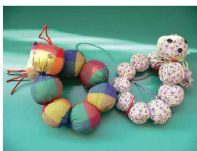
图 1-1-6 表征性玩教具 2