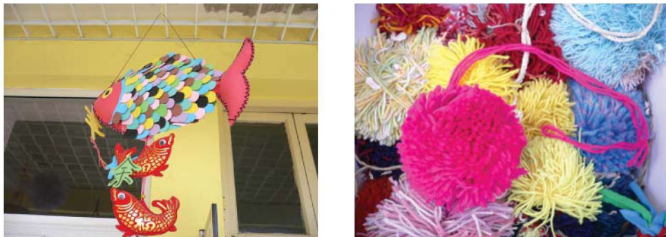
图 1-2-1 不同民族地区玩具

一般说来，不同民族、不同地区的玩具，往往蕴涵着不同的文化习俗、审美趣味、价值观。玩具本身所携带的社会文化的规则和特征，以及蕴涵其中的价值、信仰、行为方式也通过儿童的游戏在他们身上得以体现。因此，玩教具会潜移默化地影响儿童对于本土文化和异域文化的学习和理解，通过玩教具制作活动，可以将这种优秀的传统文化一代又一代地继承和发扬下去。儿童的成长过程就是不断观察体验的过程，在儿童对传统民间手工艺和传统文化的认知过程中，自制玩教具也发挥着不可替代的作用（图 1-2-1）。