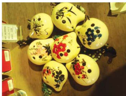
图 1-1-32 陶制玩具