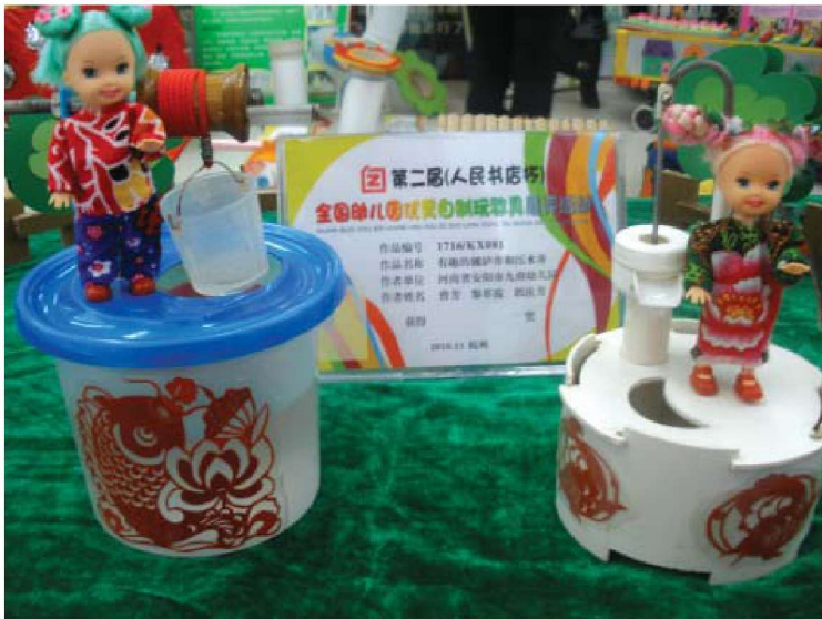
图 1-1-26 综合性玩具

(5) 按玩教具参与游戏功能的结构化程度的不同,可分为专门化玩教具和非专门化玩教具。专门化玩教具,主要指表征性玩教具、教育性玩教具、运动性玩教具等。这类玩教具的功能不仅确定,而且本身也包含着一定的玩法和游戏规则,属于结构功能较高的玩教具。非专门化玩教具是指玩具材料的游戏功能相对不确定,结构功能较低,游戏者可以根据自己的想法自由使用的游戏材料。