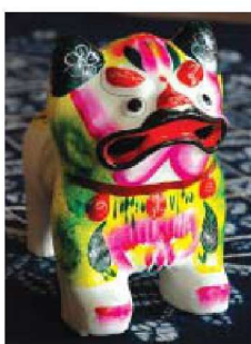
图 1-1-31 捏塑玩具