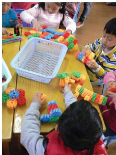
图 1-1-1 玩教具 1

幼儿的年龄小、经验少、判断力差、模仿性强，容易受到周围环境的影响和外部刺激，玩教具是保障