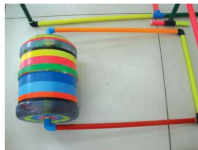
图 1-1-19 运动性玩教具 7