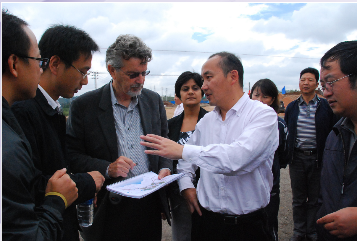
新区党工委书记、县委书记周峰越（前排右二）陪同美国能源基金会彼特·卡尔索普（左三）考察呈贡新区