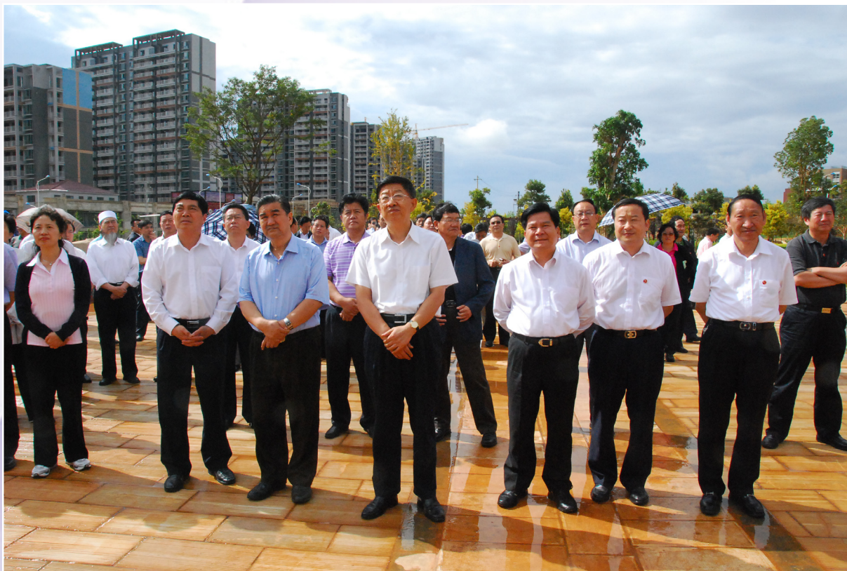
省委书记白恩培（前排中）率领省委中心组学习组领导在呈贡调研