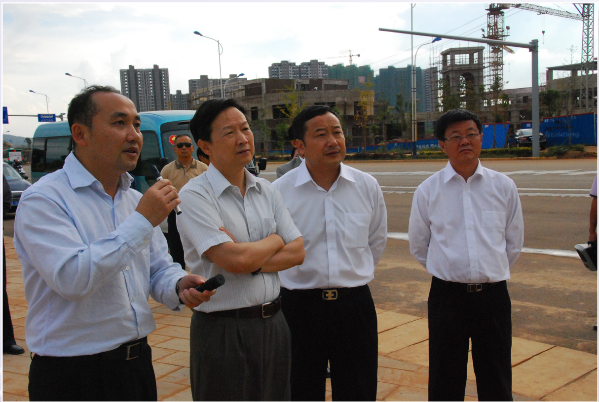
新区党工委书记、县委书记周峰越（左一），新区党工委（县委）副书记、管委会主任、县长吴庆昆（右一）陪同国家住建部副部长仇保兴（左二）等领导视察呈贡新区