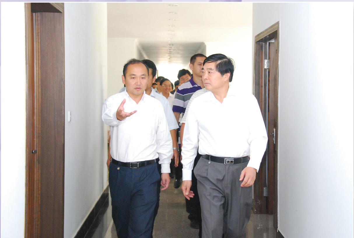
新区党工委书记、县委书记周峰越（左）陪同省委常委、市委书记仇和走访龙城街道