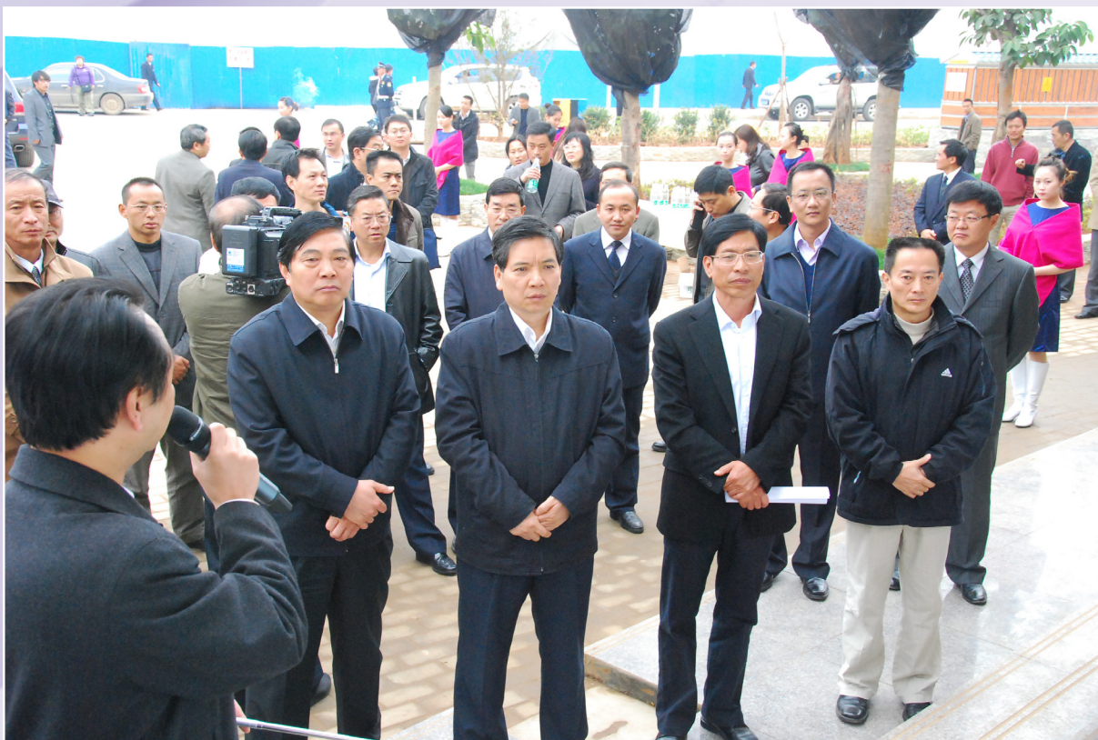
省长秦光荣（前排右三）等领导在云南艺术学院呈贡校区视察