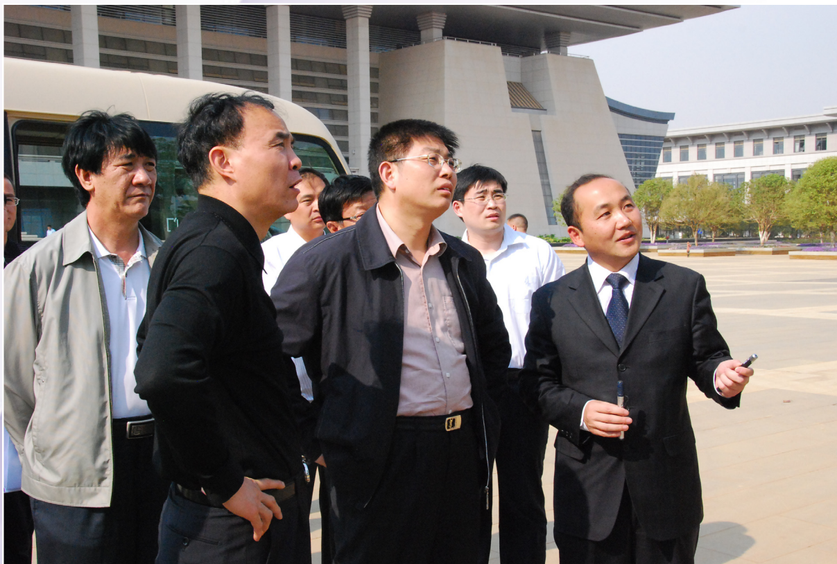
新区党工委书记、县委书记周峰越（右一）向国家民政部区划地名司司长代金良（右二）等领导汇报呈贡新区规划建设情况