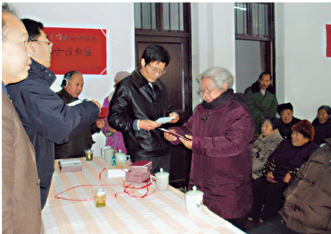
县农村社会养老保险管理处为被征地农民发放基本生活保障金（摄于2005年1月）