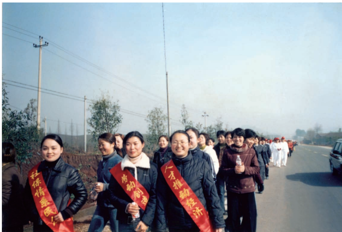
女职工开展庆“三八”社会保险知识宣传活动（摄于2004年3月）