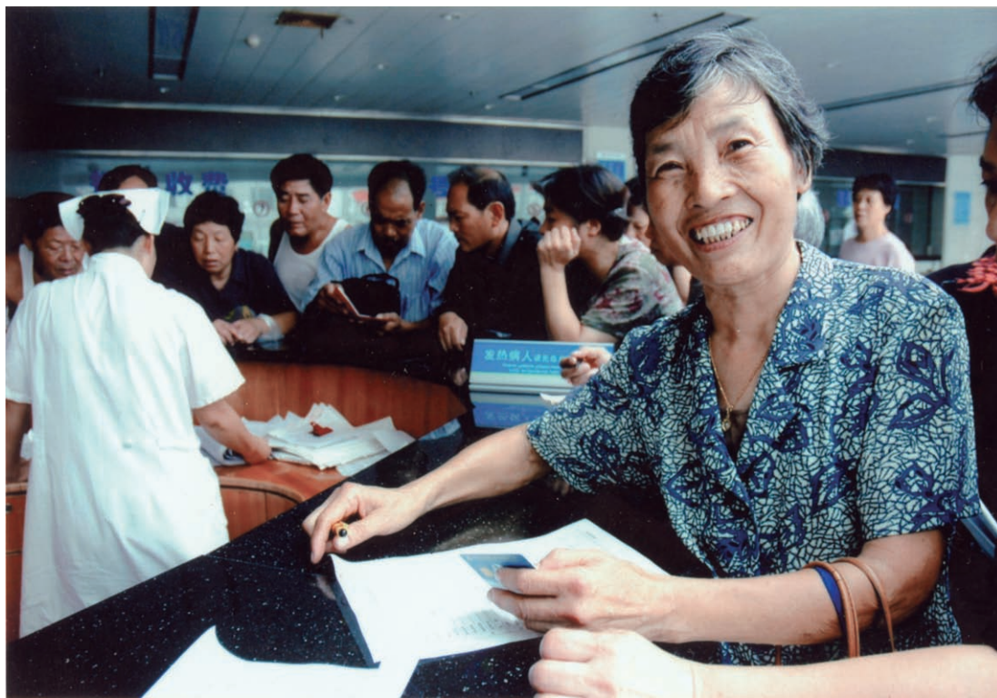
我县退休人员在医院办理免费健康体检手续（摄于2006年9月）