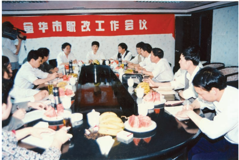
金华市职称改革工作 会议在我县召开（摄于 1996年）