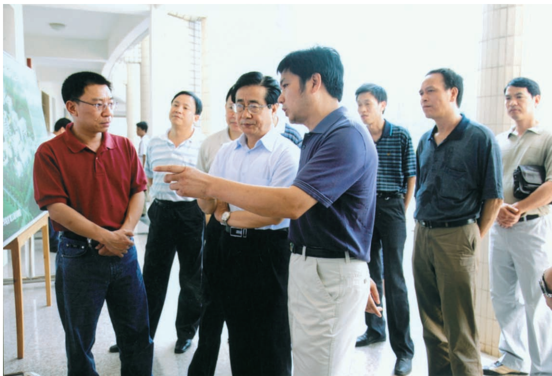
2008年7月27日，省委书记赵洪祝视察武义县农村劳动力素质培训基地