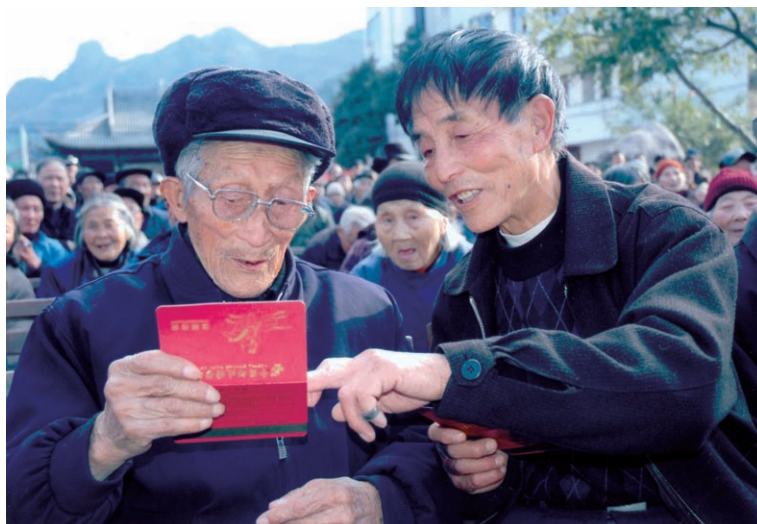
我县桃溪镇农民喜 领城乡居民养老保险金 (摄于2010年1月)