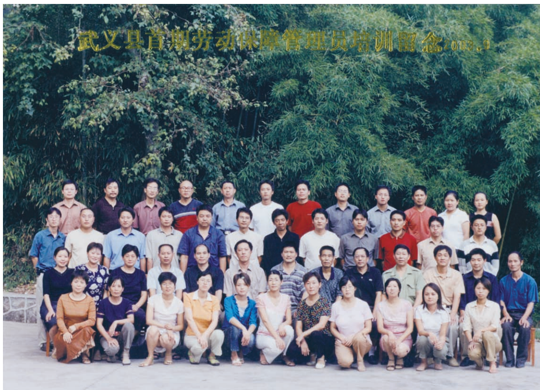
劳动保障管理所工作人员上岗培训班合影（摄于2003年9月）