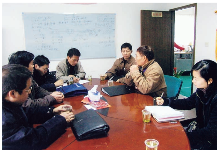
县劳动监察大队到 企业检查工资支付情况 (摄于2007年)