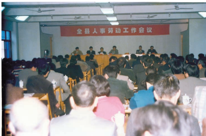
全县人事劳动工作会议现场（摄于1998年3月）