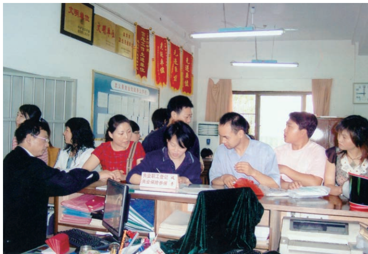
县就业管理服务处给 失业职工发放失业救济金 (摄于2007年5月)