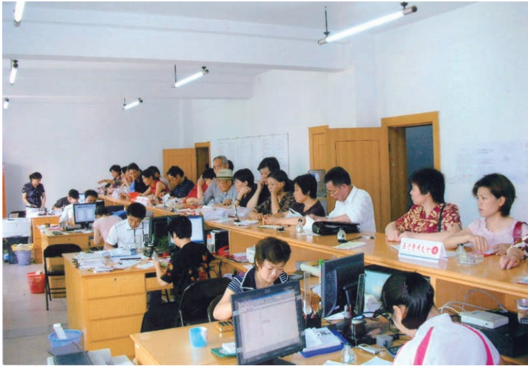
县社会医疗保险管理处正在为参保人员办理医药费报销手续（摄于2006年9月）