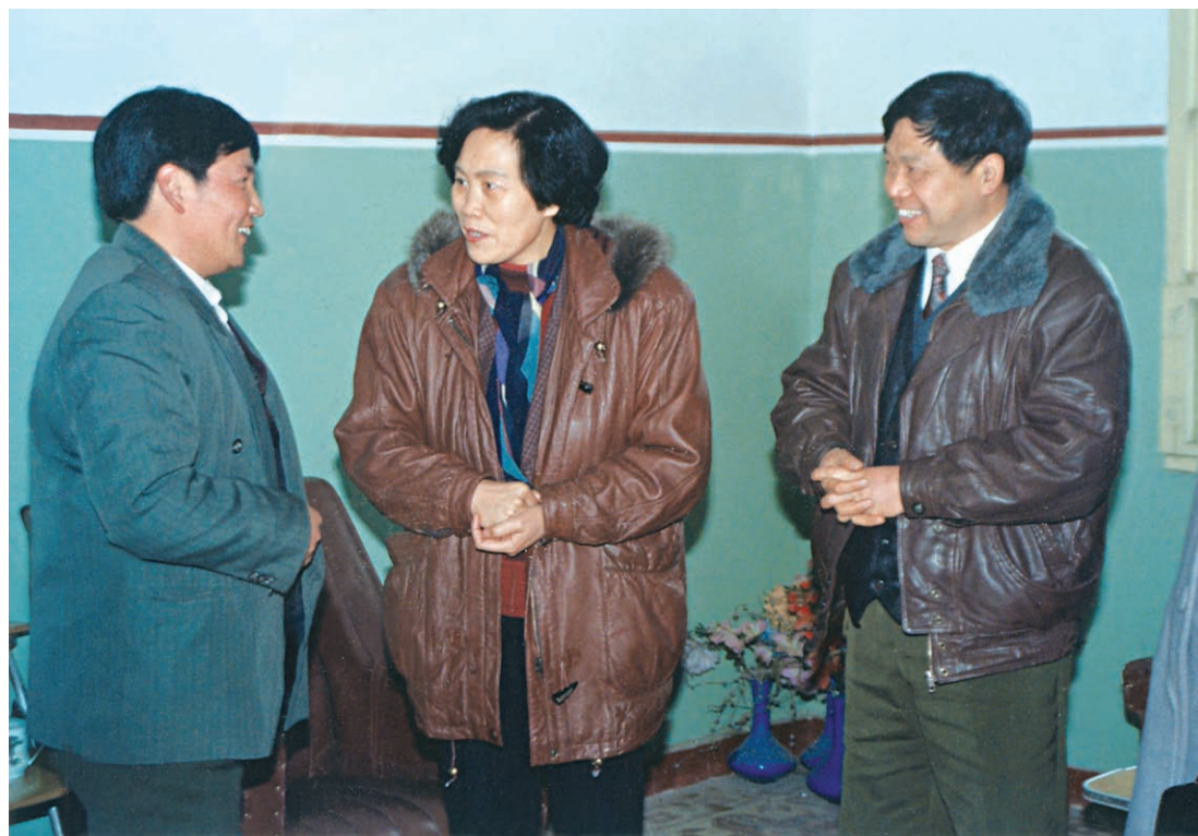
1996年1月25日，副省长叶荣宝到武义县慰问困难企业和特困职工