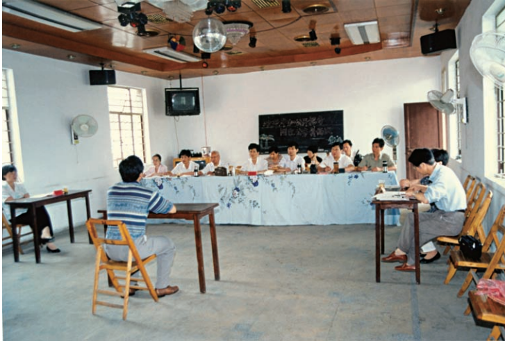
全县首次面向社会公开 招考公务员面试现场（摄于 1997年6月）