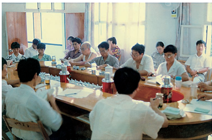
本系统的干部职工学习 《中华人民共和国劳动法》 （摄于1994年9月）