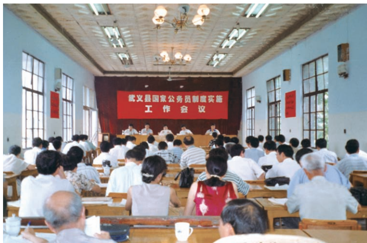
全县国家公务员制度 实施工作会议现场（摄于 1997年8月）