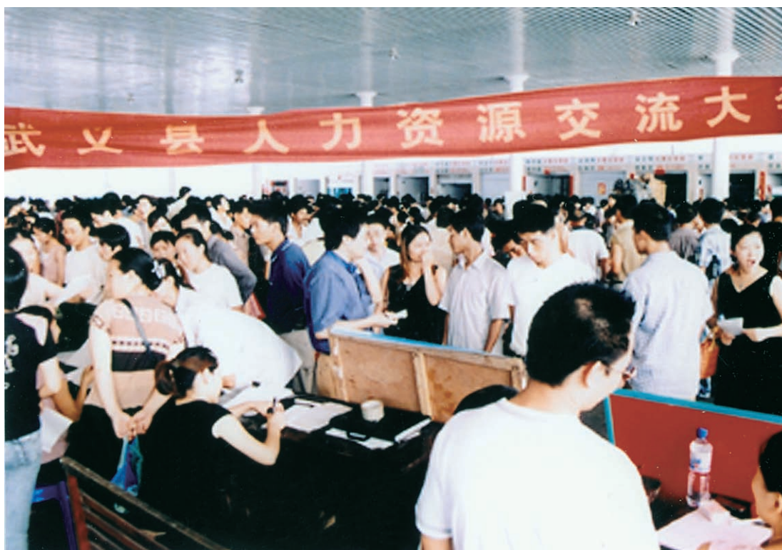
全县人力资源交流大会现场（摄于2006年）