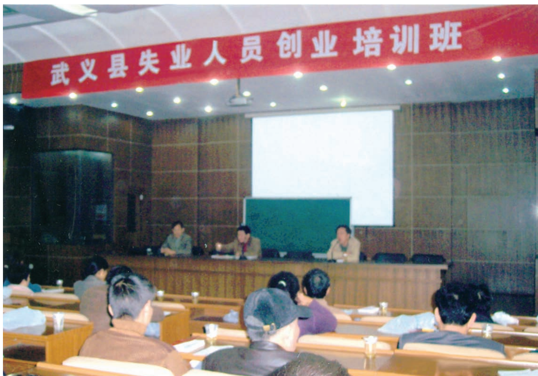
全县失业人员创业培训班（摄于2006年11月）