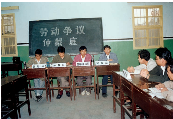
劳动争议仲裁案件开庭 现场（摄于1996年10月）