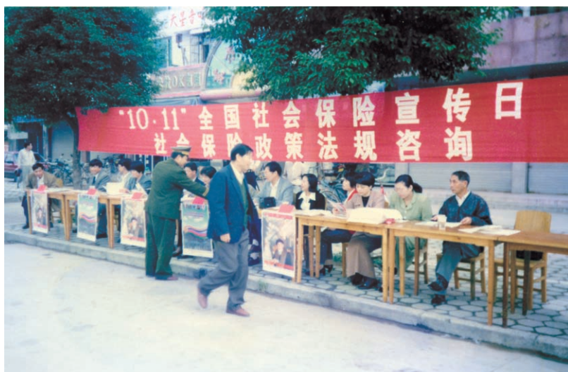
开展社会保险政策法规咨询活动（摄于1997年10月）