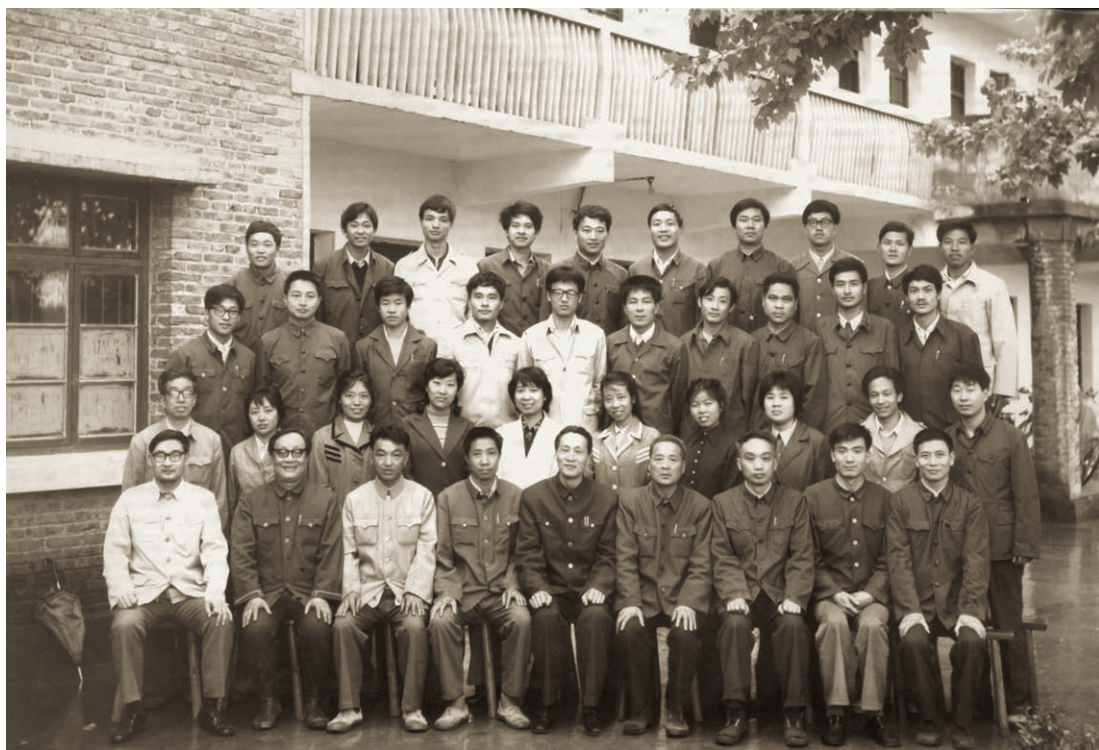
全县劳动定员定额工作培训班合影（摄于1984年5月）