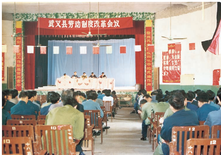
全县劳动制度改革会议 现场（摄于1986年10月）