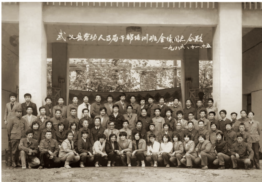
全县第一期劳动人事干部培训班合影（摄于1986年11月）