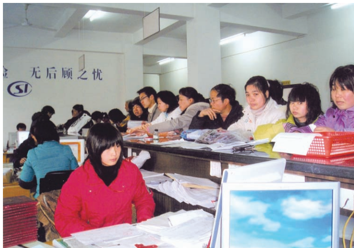
企事业单位前来县社会保险事业管理处办理申报参保手续（摄于2007年1月）