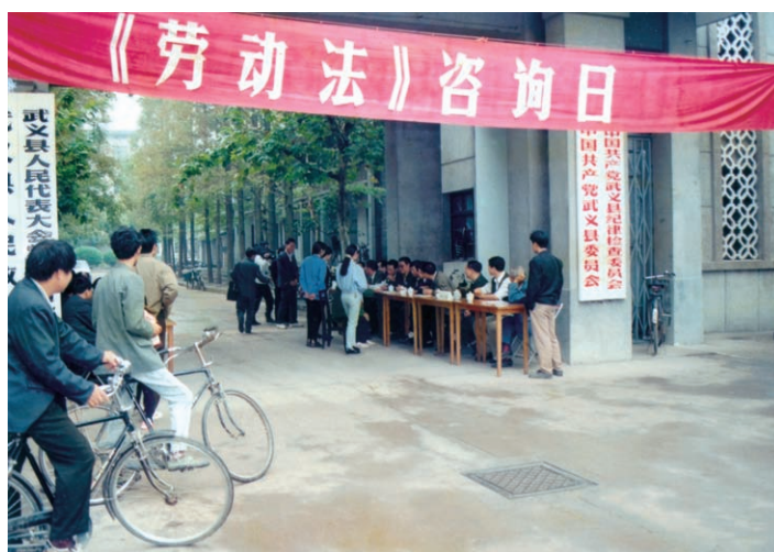
《中华人民共和国劳动法》咨询日活动（摄于1994年10月）