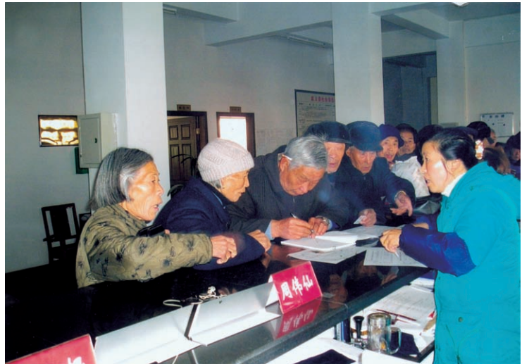
退休人员正在办理领取养老金资格认证手续（摄于2006年12月）