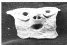
兽面器耳 嘉兴马家浜遗址