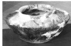
腰沿釜 桐乡罗家角遗址