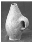
陶敛口耳瓶 桐乡罗家角遗址