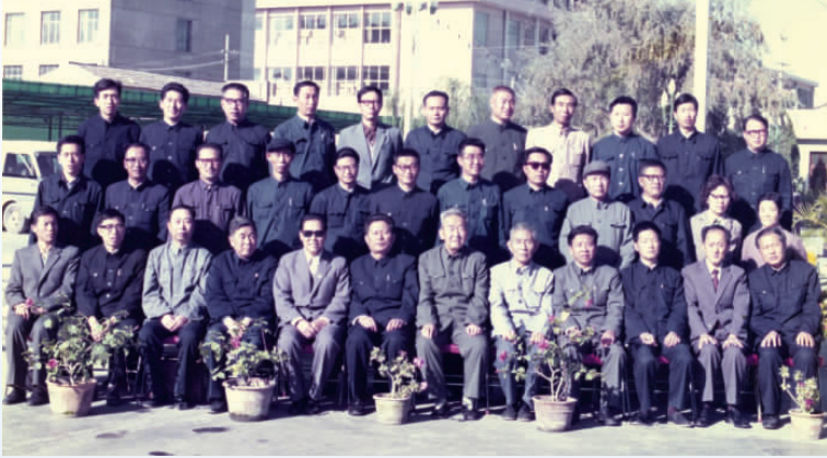
◀ 1985年，宁夏审计学会成立