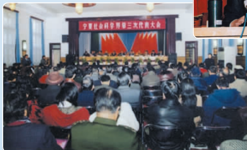
▲ 1998年,宁夏社会科学界联合会第三次代表大会