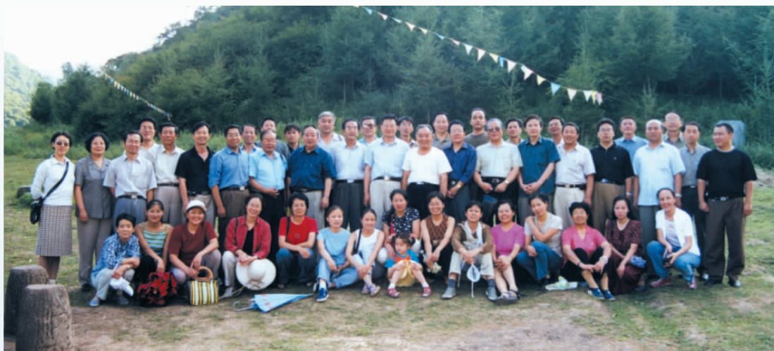
▲ 2002年,宁夏社科学会秘书长工作会在泾源召开