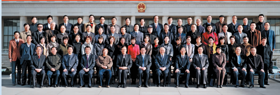
▲ 宁夏回族自治区首届社会科学突出贡献奖暨第十届社会科学优秀成果奖颁奖大会代表合影