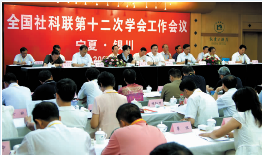
◀ 2008年，全国社科联第十二次学会工作会议在银川召开