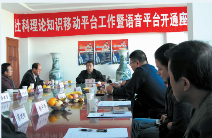
▲ 2007年，社科知识普及宣传语音平台正式开通