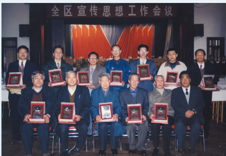
▲ 1997年,宁夏精神 文明建设“五个一工程奖”获 奖成果作者合影