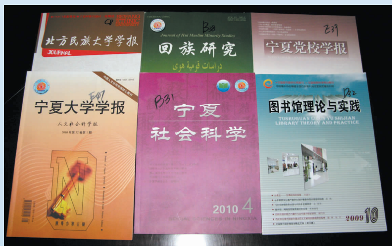
▲ 部分公开发行的社科期刊