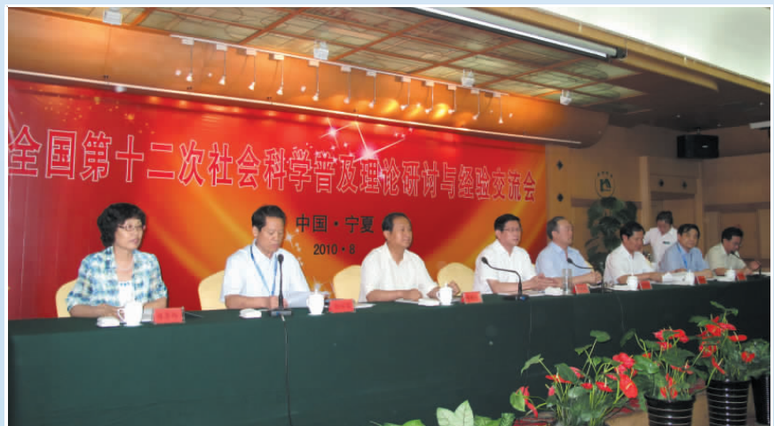
▲ 2010年，全国第十二次社会科学普及理论研讨与经验交流会在银川召开