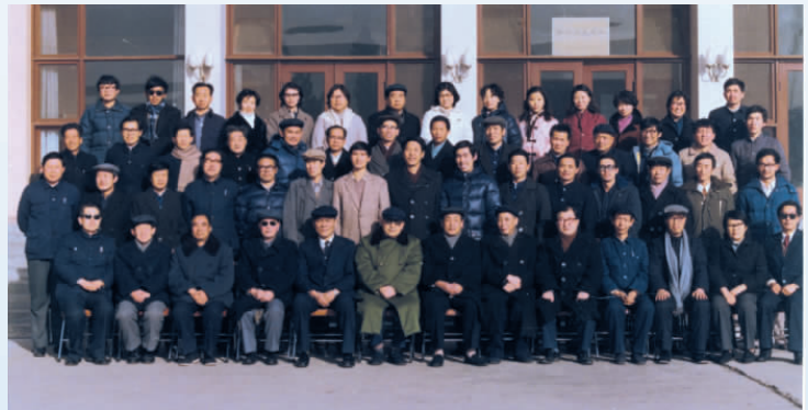
▲ 1986年，宁夏科学社会主义学会成立