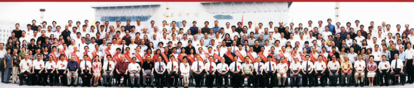
▲ 2006年,宁夏社会科学界联合会第四次代表大会全体代表合影