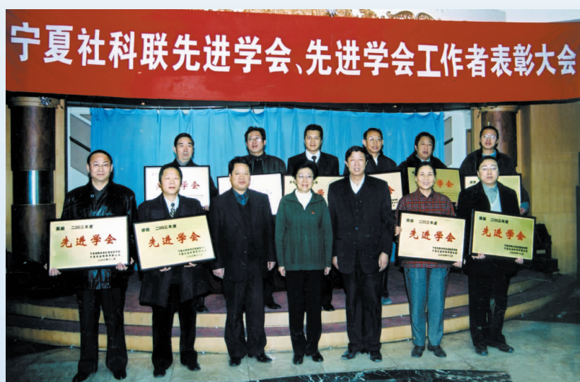
◀ 2003年,自治区党委宣传部、宁夏社会科学界联合会召开“双先”表彰会