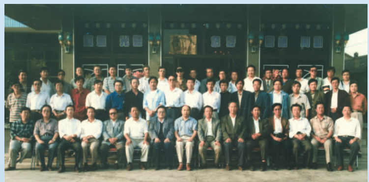
▲ 1995年，宁夏杂文学会年会在固原召开