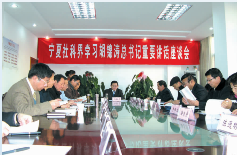
◀ 2008年,自治区党委常委、宣传部部长杨春光主持宁夏社科界召开学习胡锦涛总书记在纪念十一届三中全会召开30周年大会上重要讲话座谈会