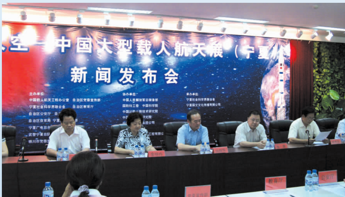
▲ 2007年,宁夏社会科学界联合会组织举行“飞向太空——中国大型载人航天展(宁夏)”新闻发布会