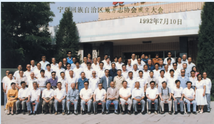
◀ 1992年，宁夏地方志协会成立