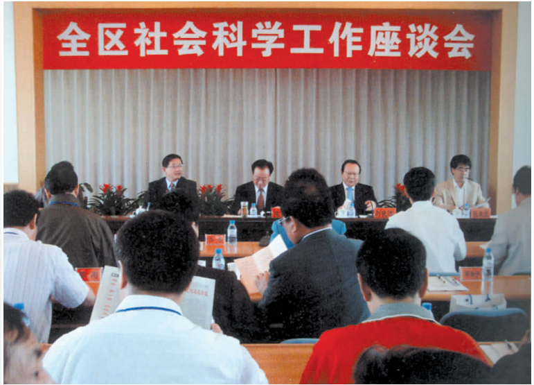
▲ 2007年，全区社会科学工作座谈会