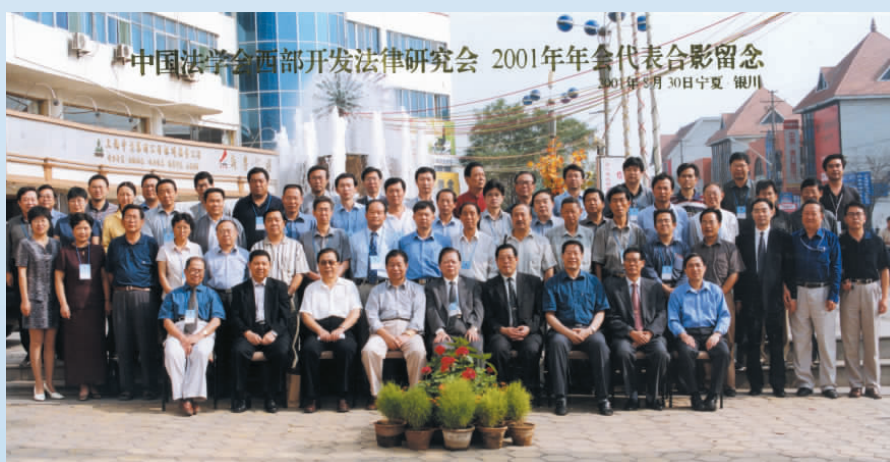
▲ 2001年， 中国法学会西部 开发法律研究会 在银川召开