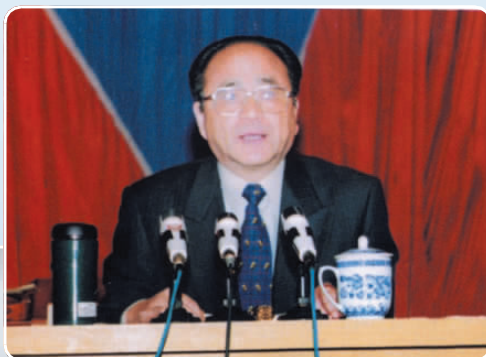
▲ 时任宁夏回族自治区党委书记毛如柏同志出席开幕式并做重要讲话