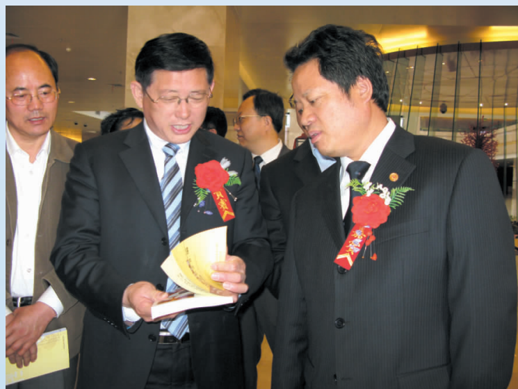
◀ 2009年,自治区党委 常委、宣传部部长杨春光(中) 出席宁夏首届社会科学成果 展开幕式