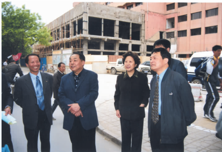
◀ 2002年，时任自治区党委副书记任启兴（左二），自治区党委常委、组织部部长陈希明（左三），区人大常委会副主任马昌裔（右一）视察指导宁夏社会科学界联合会举办的社科普及咨询日活动