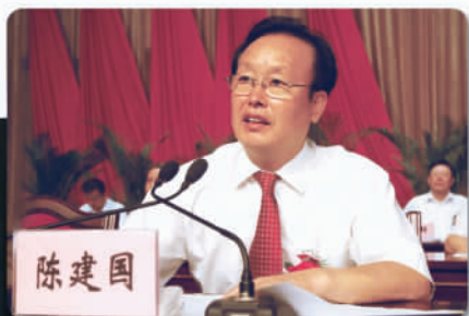
▲ 时任宁夏回族自治区党委书记陈建国同志出席开幕式并做重要讲话