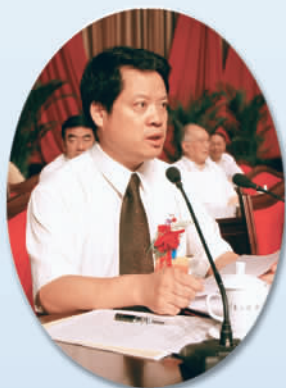
▲ 宁夏社会科学界联合会党组书记徐永富主持第四次代表大会开幕式