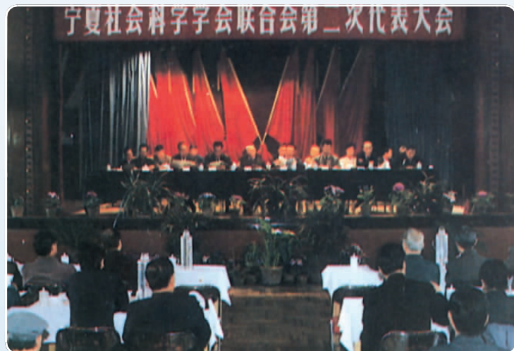
◀ 1995年,宁夏社会科学学会联合会第二次代表大会