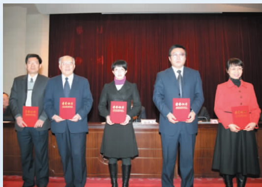
▲ 自治区第十届社科优秀成果著作一等奖获得者