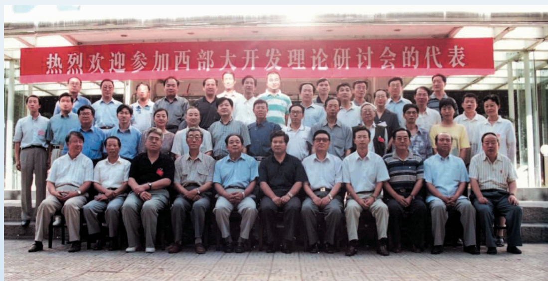
▲ 1999年，西部大开发理论研讨会在银川召开