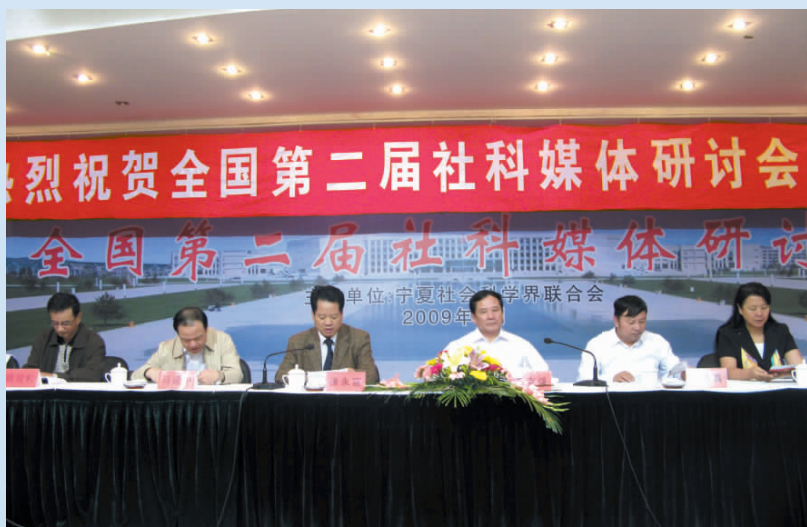
▲ 2009年,全国第二届社科媒体研讨会在银川召开