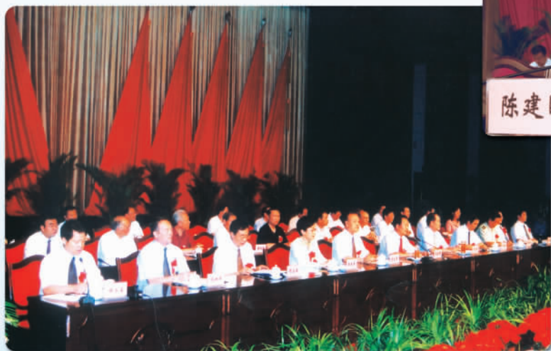
▲ 2006年,宁夏社会科学界联合会第四次代表大会