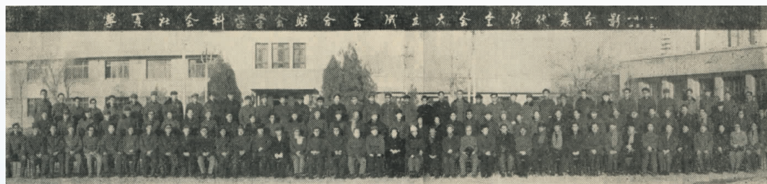
▲ 1981年,宁夏社会科学学会联合会成立大会代表合影