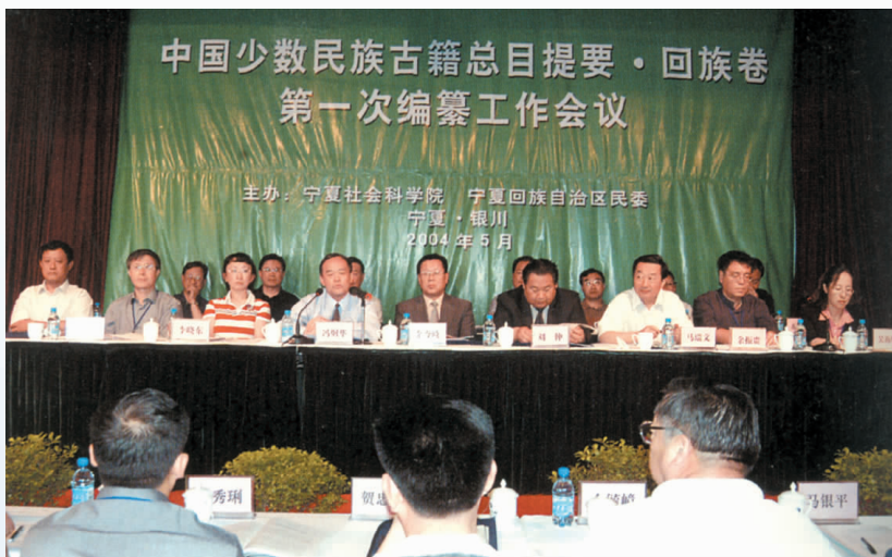
▲ 2004年,《中国少数民族古籍总目提要·回族卷》第一次编纂工作会议在银川举行