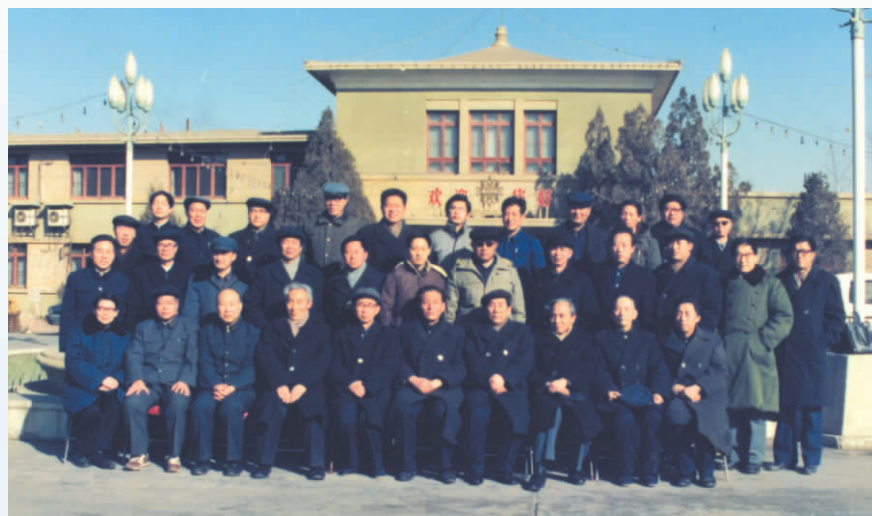
◀ 1989年， 全区农业经济理论 研讨会在宁夏 宾馆召开