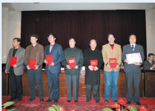
▲ 自治区第十届社科优秀成果论文一等奖获得者