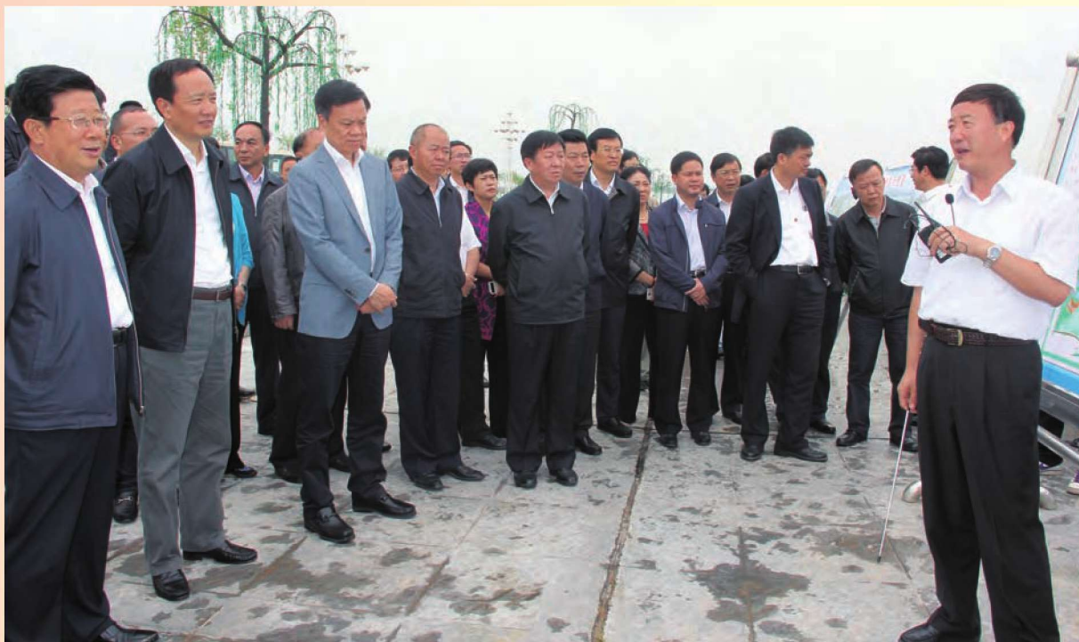
8月6日,自治区党委书记李建华(左二)调研黄河吴忠段治理工程