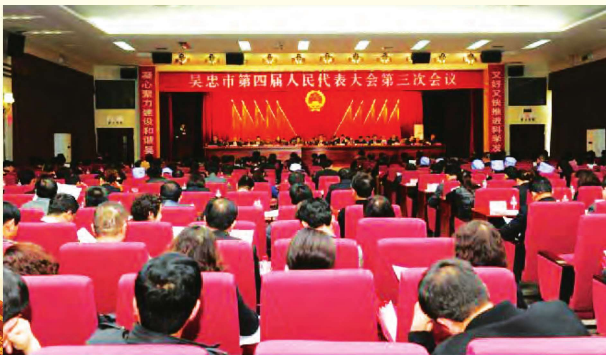
吴忠市四届人大第三次会议