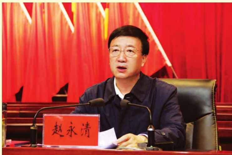
中共吴忠市委书记、市人大常委会主任 赵永清

在全市上下认真贯彻落实党的十八大和十八届三中、四中、五中全会及习近平总书记系列重要讲话精神之际,首部吴忠市级年鉴《吴忠年鉴 2015》创刊了,这是吴忠市文化事业繁荣发展中的一件大事、好事,可喜可贺!