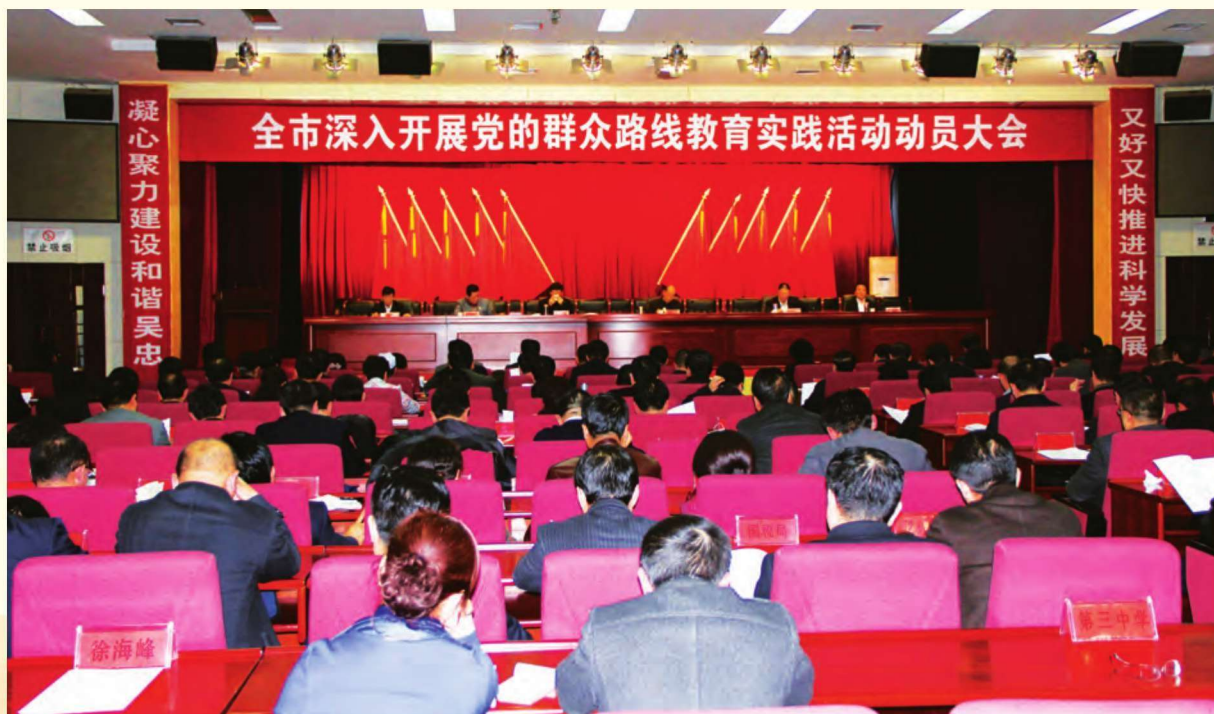
2月17日,吴忠市召开第二批深入开展党的群众路线教育实践活动动员大会