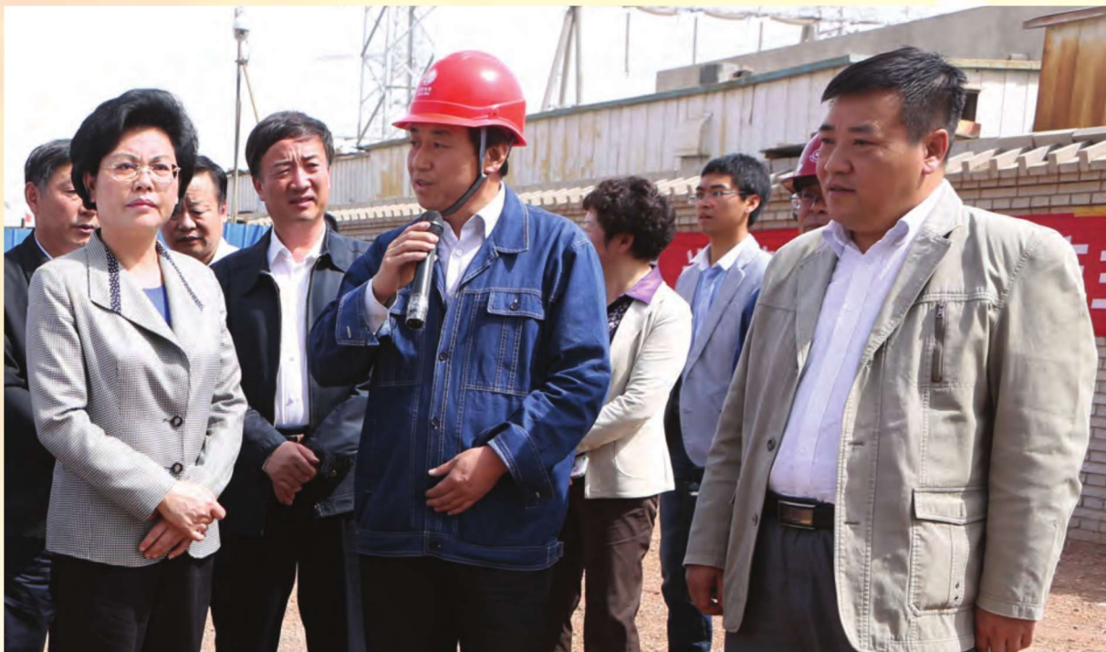
5月8日,自治区主席刘慧(左一)到青铜峡新材料基地调研