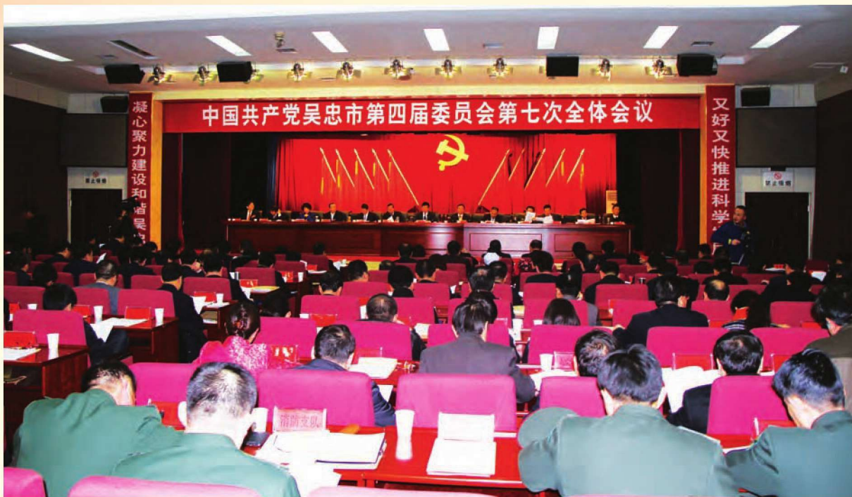
中共吴忠市四届七次全体会议