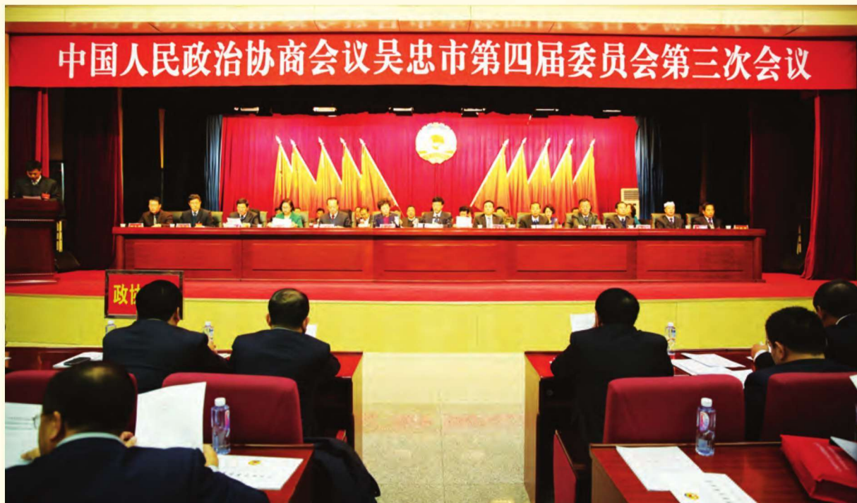
政协吴忠市四届三次会议