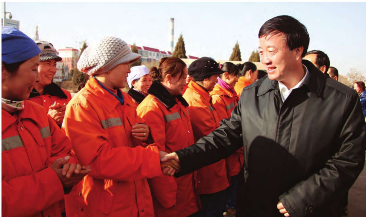
1月30日,中共吴忠市委书记赵永清(右一)慰问环卫工人