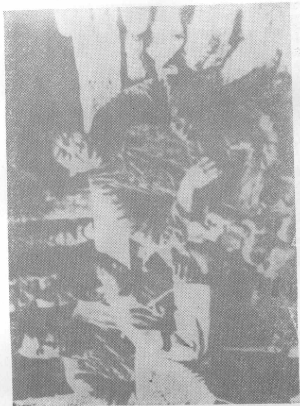
惨遭日军蹂躏的丰台地区人民痛不欲生。