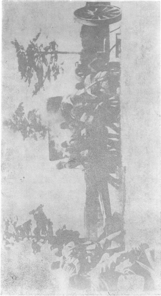
1937年7月7日，日军炮轰宛平城。