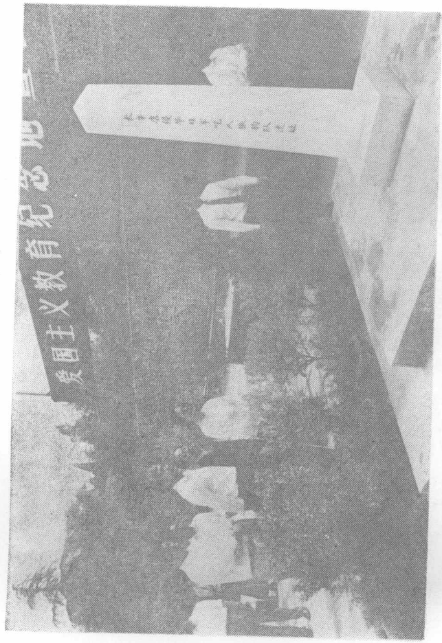
长辛店侵华日军吃人狼狗队的遗址。现为北京爱国主义教育纪念地。