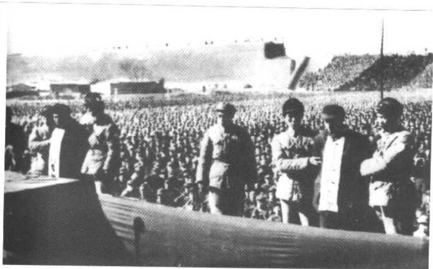
在“三反”运动中，河北省人民法院临时法庭公审大贪污犯、原中共天津地委书记刘青山、专员张子善，判处他们死刑。