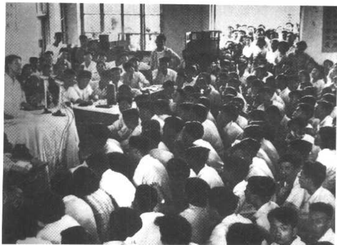
整风运动开展一段时间后，随即发动了反对资产阶级右派猖狂进攻的斗争。图为中国人民大学反击右派分子的辩论大会。