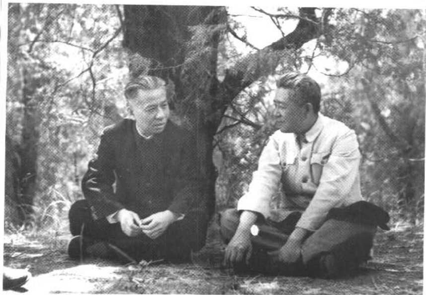
1955年刘少奇同皮肤病、性病专家胡传揆席地而坐，促膝交谈。