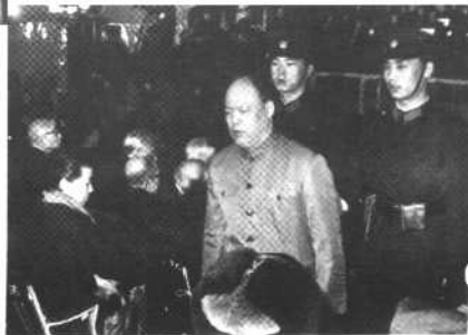
被押上法庭的姚文元。