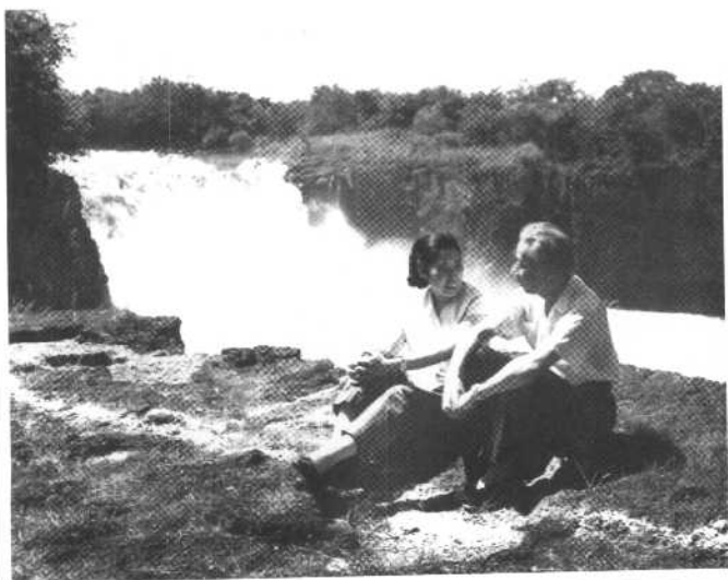
1961年7月，刘少奇在东北林区考察期间，在黑龙江镜泊湖休息。这是刘少奇、王光美在镜泊湖瀑布前小憩。