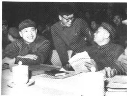
“文革”中姚文元（右3） 和蒯大富等造反派在大会 主席台上。