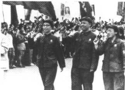
姚文元和江青向群众 挥手。