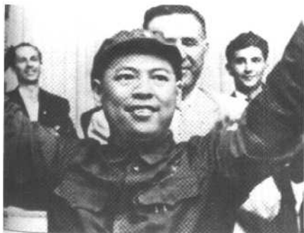
姚文元在阿尔巴尼亚访问 时向欢迎的人群挥手。