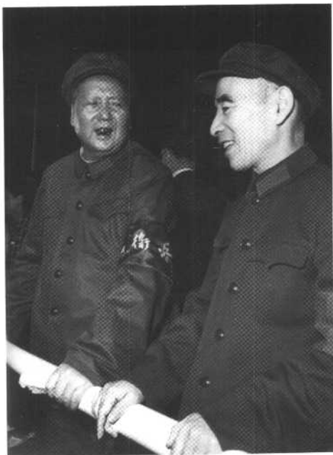
毛泽东和林彪在 天安门城楼上。

1966年8月1日至12日，中共八届十一中全会在北京举行。5日，毛泽东发表《炮打司令部——我的一张大字报》。8日，全会通过