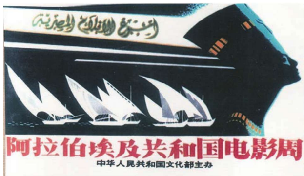
招贴画《埃及电影节》

海报的左下角是自由女神塑像，占画面近三分之一。她高擎火炬、仰视蓝天，是力量和自由意志的象征。自由女神的右上方闪出一片空间让给蓝天，虽方寸之地，却显画面视野辽阔。一群幻化中美丽的白天鹅掠过蓝天，飞往遥远的国度。