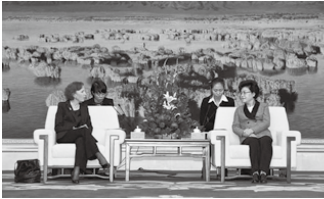
2013年11月27日，由副主席罗亚尔女士率领的包括塞尔维亚前总统塔迪奇、匈牙利国会议员亚诺士、波兰劳动联盟国际书记戈利克、丹麦社民党国际书记克罗格等在内的欧洲社会党高级代表团来宁访问。图为自治区主席刘慧会见罗亚尔一行

承办“第四届中国·欧洲农业研讨会”。邀请来自丹麦、德国、英国等7个欧洲国家、地区和国内北京、云南等6个省市的代表、专家161名和媒体记者24名来宁参加会议。推动欧洲国家与我达成在