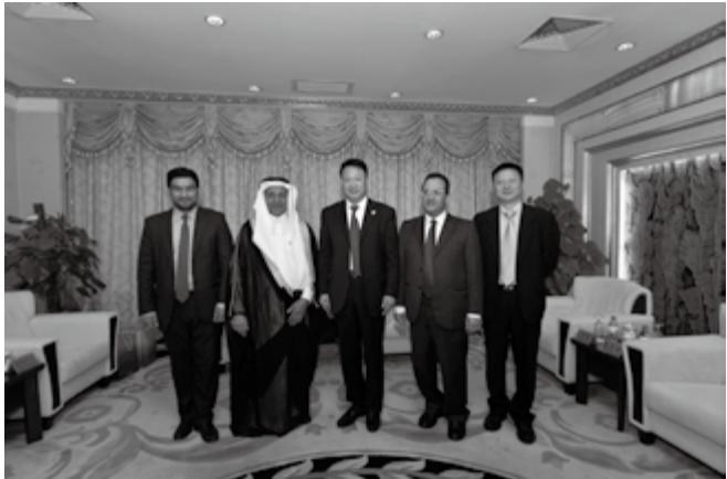
2013 年 5 月 6 日，沙特发展基金会董事会副主席兼总裁优素福·巴萨姆率团来宁考察访问。图为自治区副主席王和山与代表团合影留念

加强对因公出国管理中出现的新情况新问题的研究，部署专项治理工作。定期向自治区纪委、外交部、中外办等报送因公出访情况。严审因公出访计划，全年压缩计划申报出访团组 165 个 1350 人次，分别占上报总数的 50% 和 54%。召开相关联席工作会议；加强行前教育与出访报告的核查力度，促使出访成果共享。执行《自治区举办国际会议涉外论坛管理暂行办法》等相关规定，先后完成对宁夏理工学院申办全球教育联盟 2013 年年会、宁夏环保厅申办联合国环境规划署南亚、东南亚及太平洋区域臭氧官员网络会议等项的审批与管理工作。