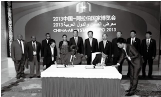
2013年9月16日，瓦努阿图总理莫阿纳·卡凯塞斯访问宁夏并出席中阿博览会。图为自治区党委书记、人大主任李建华与卡凯塞斯总理见证《中国宁夏回族自治区银川市与瓦努阿图维拉港建立友好关系和开展长期合作意向书》签字仪式

《中国宁夏回族自治区银川市与瓦努阿图维拉港建立友好关系和开展长期合作意向书》等的签署。推动宁夏光伏发电企业与约旦企业达成交流合作意向。