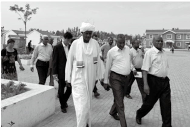
2013年6月28日，以领导委员会成员、工业部长阿卜杜拉·奥斯曼·阿里为团长的苏丹全国大会党高级干部研修班考察团来宁夏访问。图为考察团考察、了解村镇建设情况

为构建交流平台，全年与外国地方政府建立国际友城关系 8 对。其中自治区一级的国际友城有 5 对（与苏丹杰济拉州、与突尼斯凯鲁万省、与摩尔多瓦加告兹自治区、与蒙古前杭