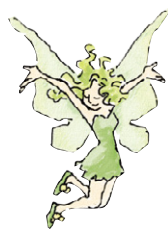
Tinker Bell 小叮当仙女