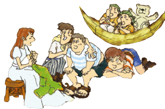
Lost Boys 迷失的男孩们