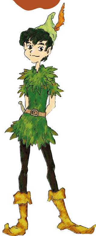
Peter Pan 彼得·潘