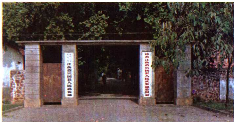
中国人民 解放军 江西省兴国县人民武装部