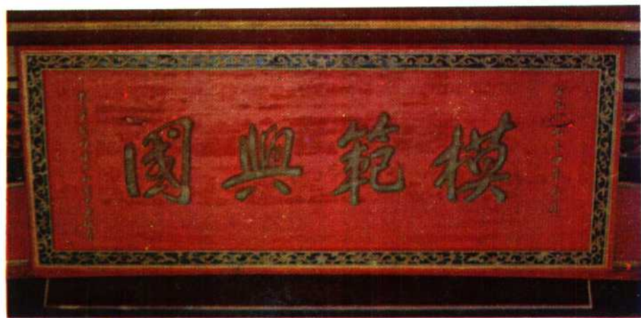
中华苏维埃共和国中央政府 授予兴国奖匾