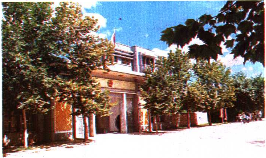
兴国县人民代表大会常务委员会