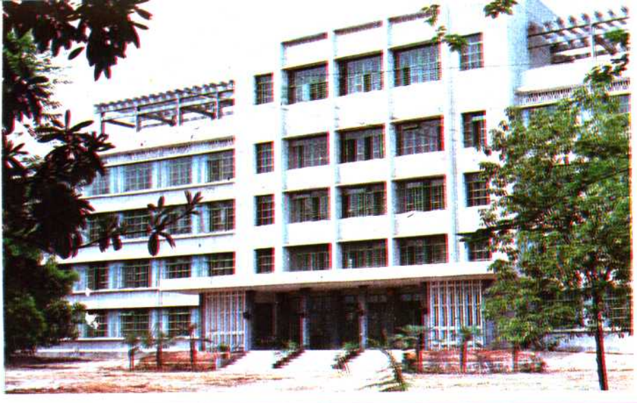
中国共产党兴国县委员会 中共兴国县纪律检查委员会