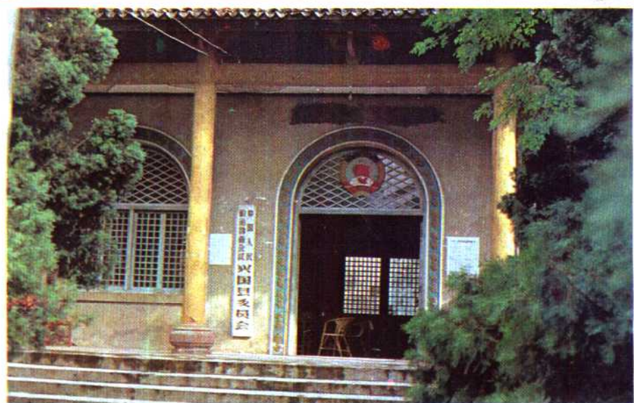
中国人民 政治协商会议 兴国县委员会