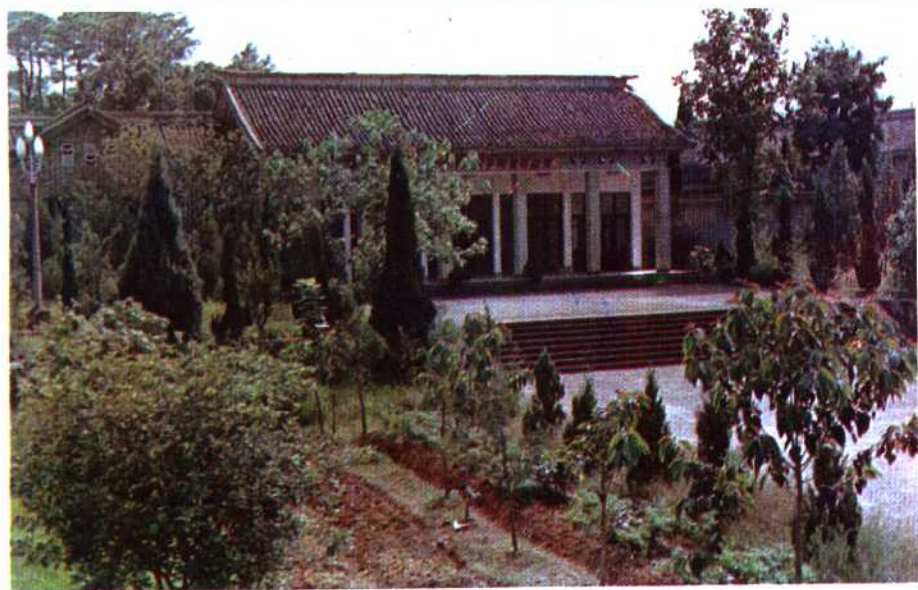
毛泽东作长冈乡调查陈列馆