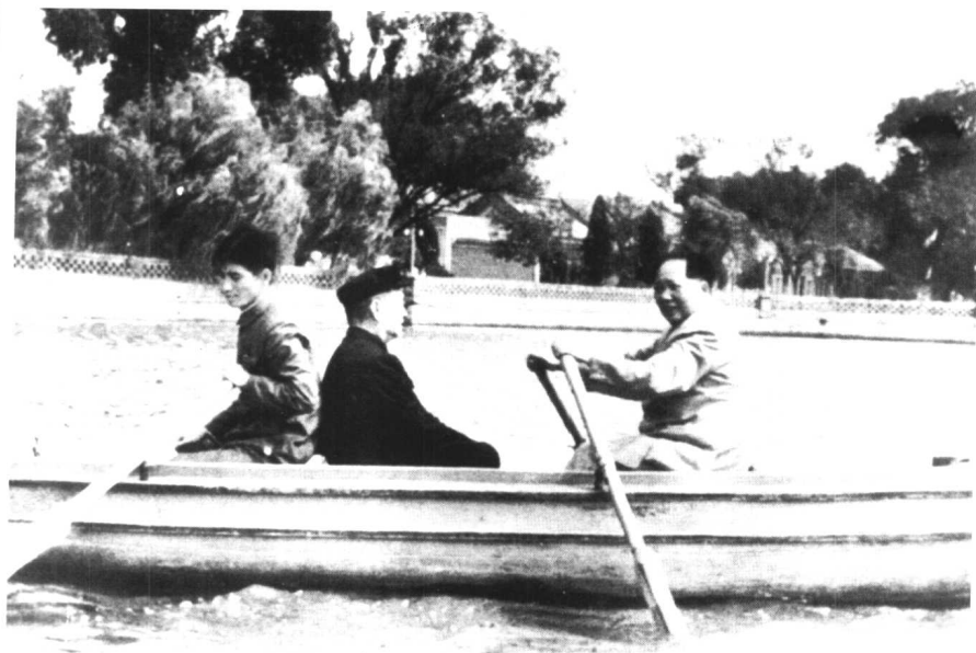
50年代初，毛泽东和民主人士程潜在中南海泛舟。