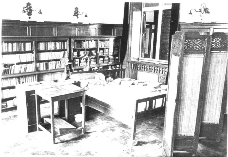
毛泽东在丰泽园内的卧室。

丰泽园建于清康熙年间，正门所悬匾额“丰泽园”三字，是清乾隆皇帝的御笔。从建国初期到“文化大革命”开始，毛泽东长期住在这里。