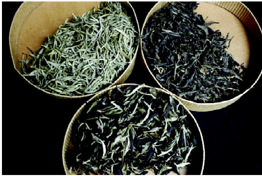
图左上 芽尖 图右上 勐库古树茶菁 图中下 无揉捻之毛茶