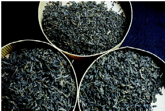
图中上 特级熟茶毛茶 图右下 五级熟茶毛茶 图左下 七级熟茶毛茶