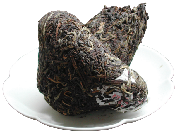
2004年 茶品天下~女儿沱（香菇紧茶）