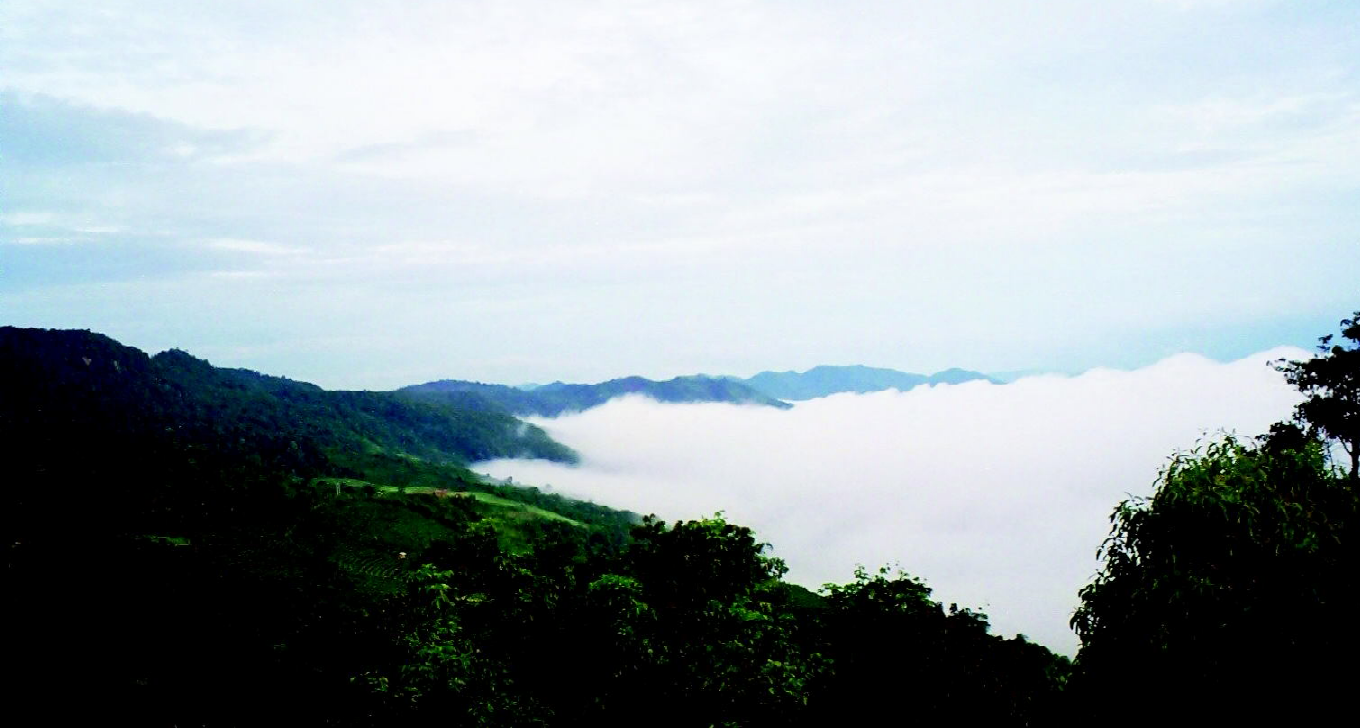
云雾缭绕的云南茶园