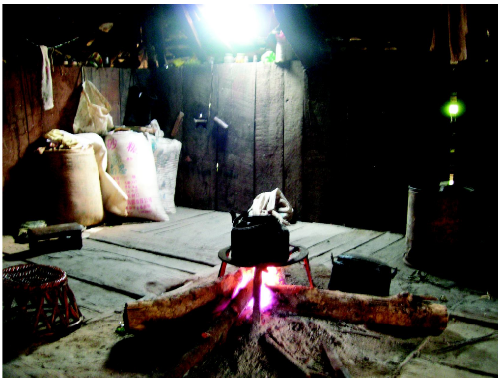
烧柴煮水 少数民族的木楼 角落存放一袋袋的晒青毛茶

普洱茶以发酵制作工序来区分,基本上有生茶与熟茶之别。制作过程中,没有经过长时间增湿渥堆发酵工序,所产生的称为青毛茶。反之,利用增湿渥堆或菌类人工发酵的称“熟毛茶”,也就是中国大陆茶学界所谓现代普洱茶。简单叙述传统与现代