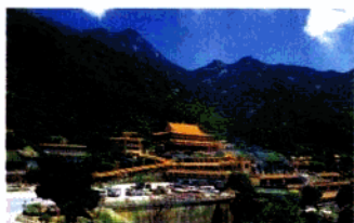
岭南第一山—罗浮山

惠州自然风光绮丽，拥有众多风景名胜，集山、泉、湖、海、岛为一体，融自然景观与人文景观于一身。全市有省级、国家级风景名胜及自然保护区6处，著名风景名胜有惠州西湖、罗浮山、南昆山，还有全国唯一的港口海龟自然保护区等。惠州集古城胜迹、道教源流、名士遗址、革命纪念地以及瑶乡风情和客家民俗于一体，营造了独具特色的多功能综合旅游体系。