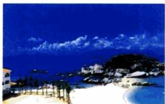
风景如画的大亚湾