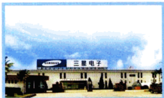
三星电子(惠州)公司