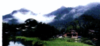
北回归线上的绿洲—南昆山