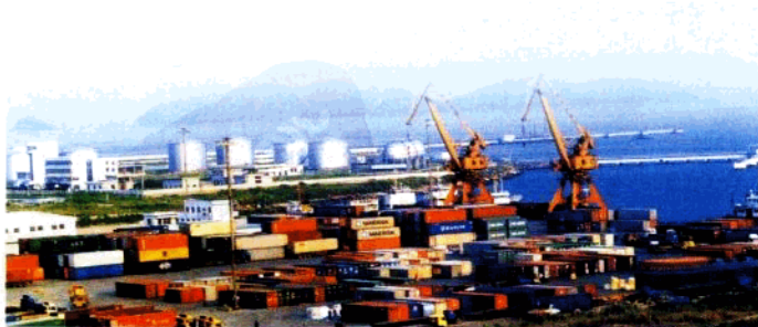
天然深水良港—惠州港

惠州已建成由深水港、航空港、高速公路、铁路和现代通信系统互相衔接的立体交通通信网络。位于大亚湾的惠州港为国家一级口岸，已建成2座万吨级通用泊位和4座3.5万吨级的油气码头，年吞吐量超千万吨。京九铁路与广梅汕铁路在惠州交汇，已通车的惠澳（惠州港）铁路与京九、广梅汕铁路接轨，形成铁路连接港口的大陆桥格局。有4条高速公路从惠州过境，全市境内公路通车里程7381公里。惠州机场已开通北京、成都、苏州等多条国内航线。境内通过的多条国家一级光缆干线与境内通信网络相连接，构筑起发达的现代信息高速公路网络。市区自来水日供水能力60万吨，输变电能力成为全国主变容量超200万千伏安的53个城市之一。