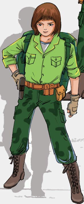
沉着睿智的 啄木鸟