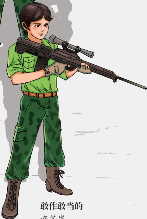
敢作敢当的 梅花雀