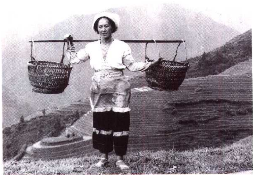
北方方言的壮族妇女