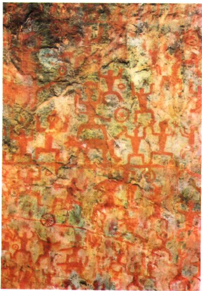
宁明县花山崖壁画