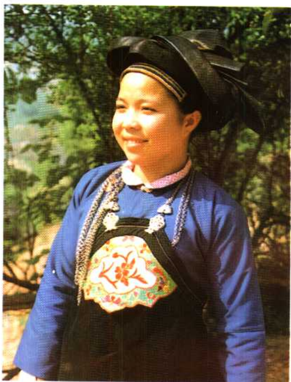
云南省文山壮族妇女