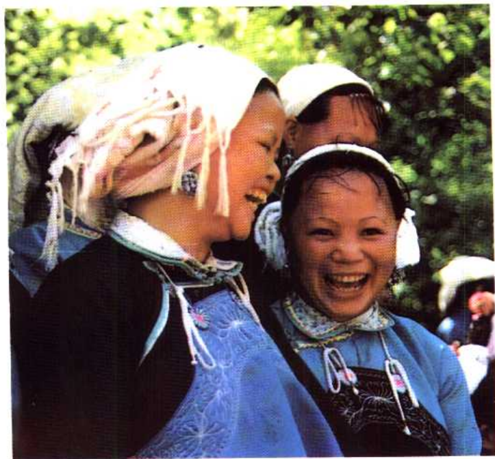
南方方言的壮族妇女