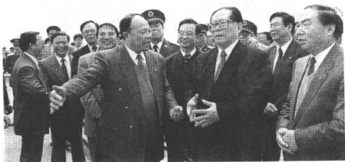
江泽民总书记视察张家港