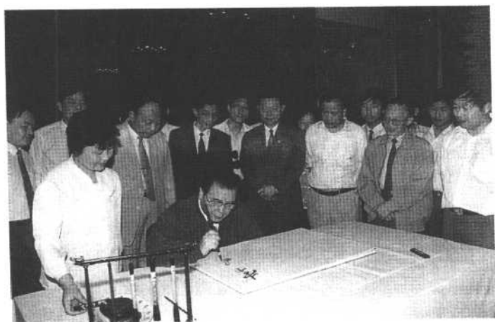
李鹏总理签名留念