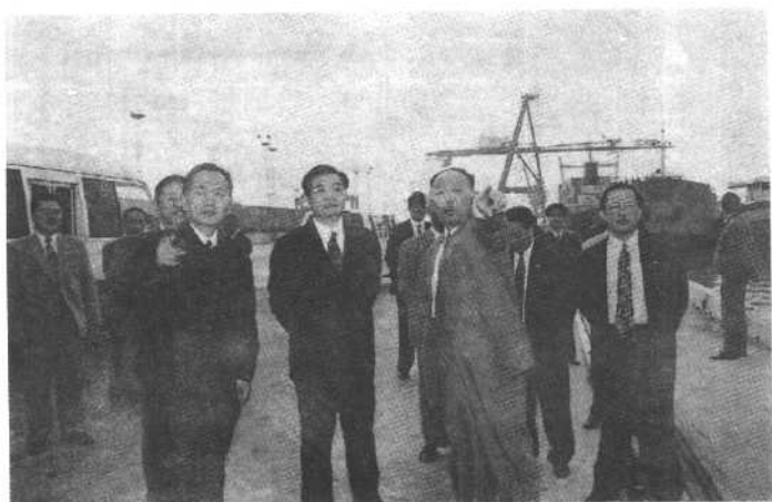
胡锦涛同志视察张家港