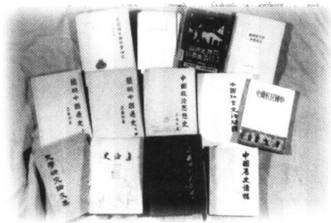
吕振羽先生部分论著书影