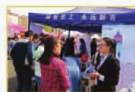
学院举办2016年双选洽谈会

学院今后的发展目标是：强化内涵建设，凝练办学特色，努力把宁夏大学新华学院建设成为西部地区特色鲜明、较高水平的独立学院。