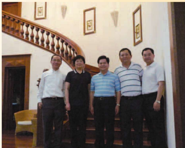
李省长领导莅临代表处指导工作

Yangon Representative office of Yunnan Commerce