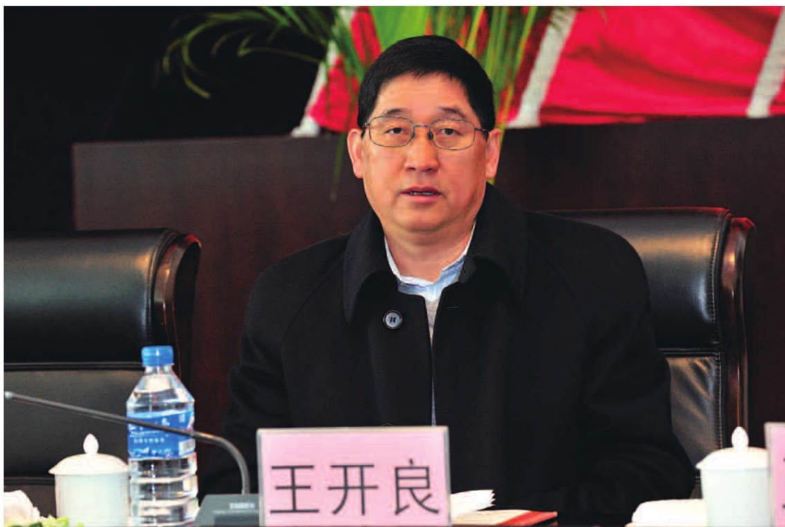
省商务厅党组成员、副厅长王开良出席2012全省商务工作会议