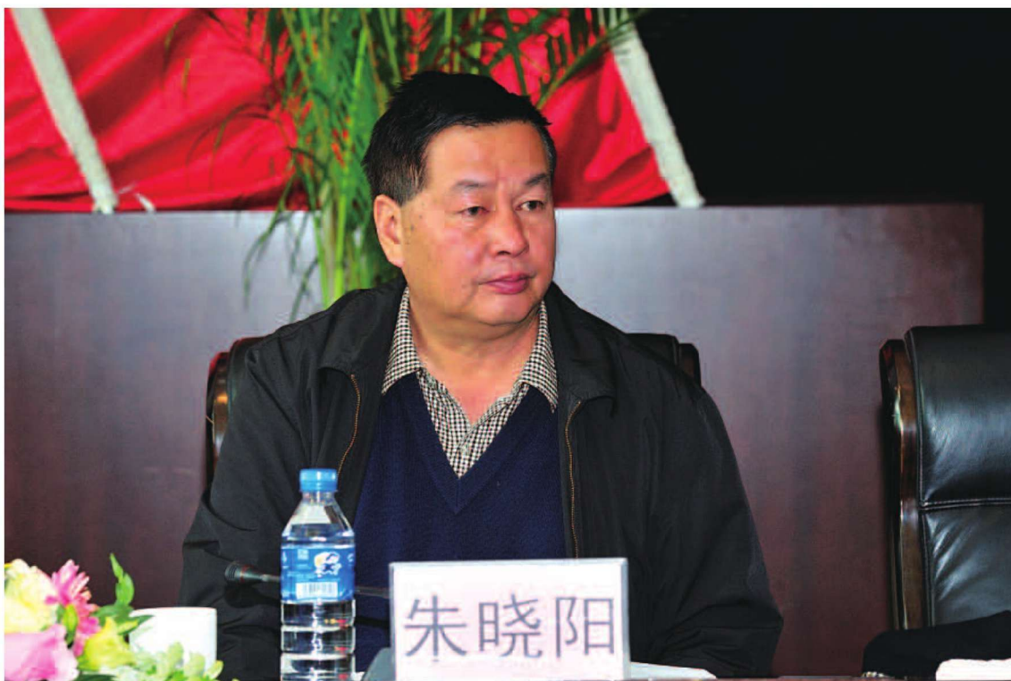
省商务厅党组成员、副厅长朱晓阳出席2012全省商务工作会议