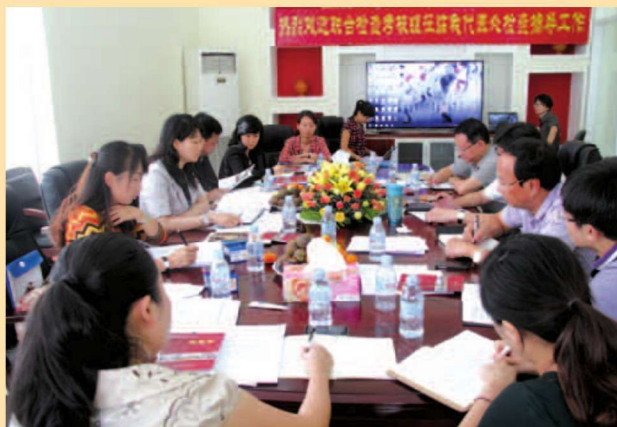
2013年3月11日我代表处向马永福副厅长汇报工作

Under the commission of Department of Commerce of Yunnan Province, Department of Finance of Yunnan Province, Foreign Affairs Office of People's Government of Yunnan Province has set up Phnom Penh Representative Office of Yunnan Commerce on 6th April, 2012.