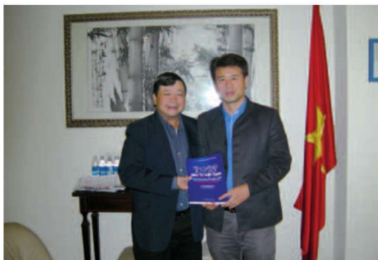
拜访越南工商总会

地址: So 1, Ngo 172, Nguyen Tuan, ThanhXuan, Ha Noi, Viet Nam