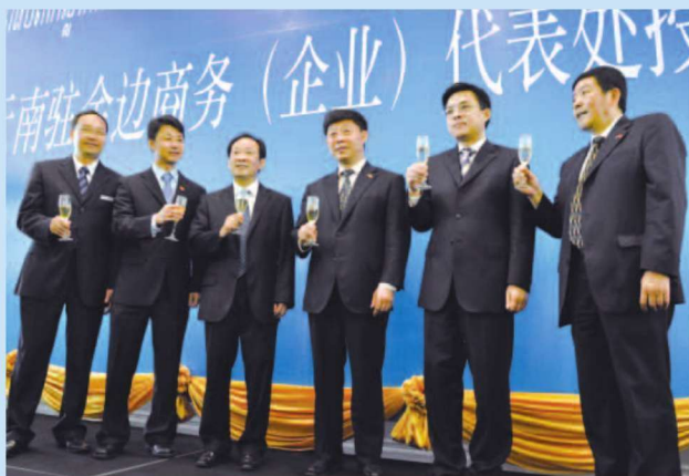
2012年4月云南驻金边商务（企业）代表处正式挂牌成立

金边商务（企业）代表处是云南省人民政府在柬埔寨设立的对外开放窗口之一，成立于2012年4月6日。在云南省人民政府、云南省商务厅和云南省人民政府外事办公室的直接指导下，金边商务（企业）充分发挥了“窗口、协调、桥梁、服务”的综合职能，与柬埔寨政府部门、商会、驻柬使馆、经商处、当地社会和新闻媒体建立了广泛的联系，积极宣传云南省对外开放的成果政策和相关举措，疏通和拓展云南省与柬埔寨的经贸合作渠道，促进云南省与柬埔寨发展健康友好的经贸合作关系，为云南省企业“走出去”提供了改革咨询、信息服务和协调沟通等便利服务，积极推进云南省企业在柬埔寨开展经贸项目及活动，树立了云南省企业在外的良好形象，是我省扩大在柬埔寨影响力、树立开放形象的窗口和平台。我们欢迎有意到柬埔寨开展经贸合作的企业联系我们，我们将提供热情周到的服务与咨询。