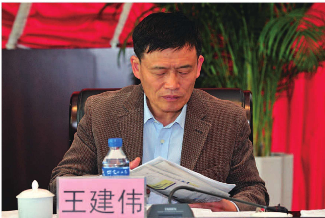
省商务厅党组成员、副厅长王建伟出席2012全省商务工作会议