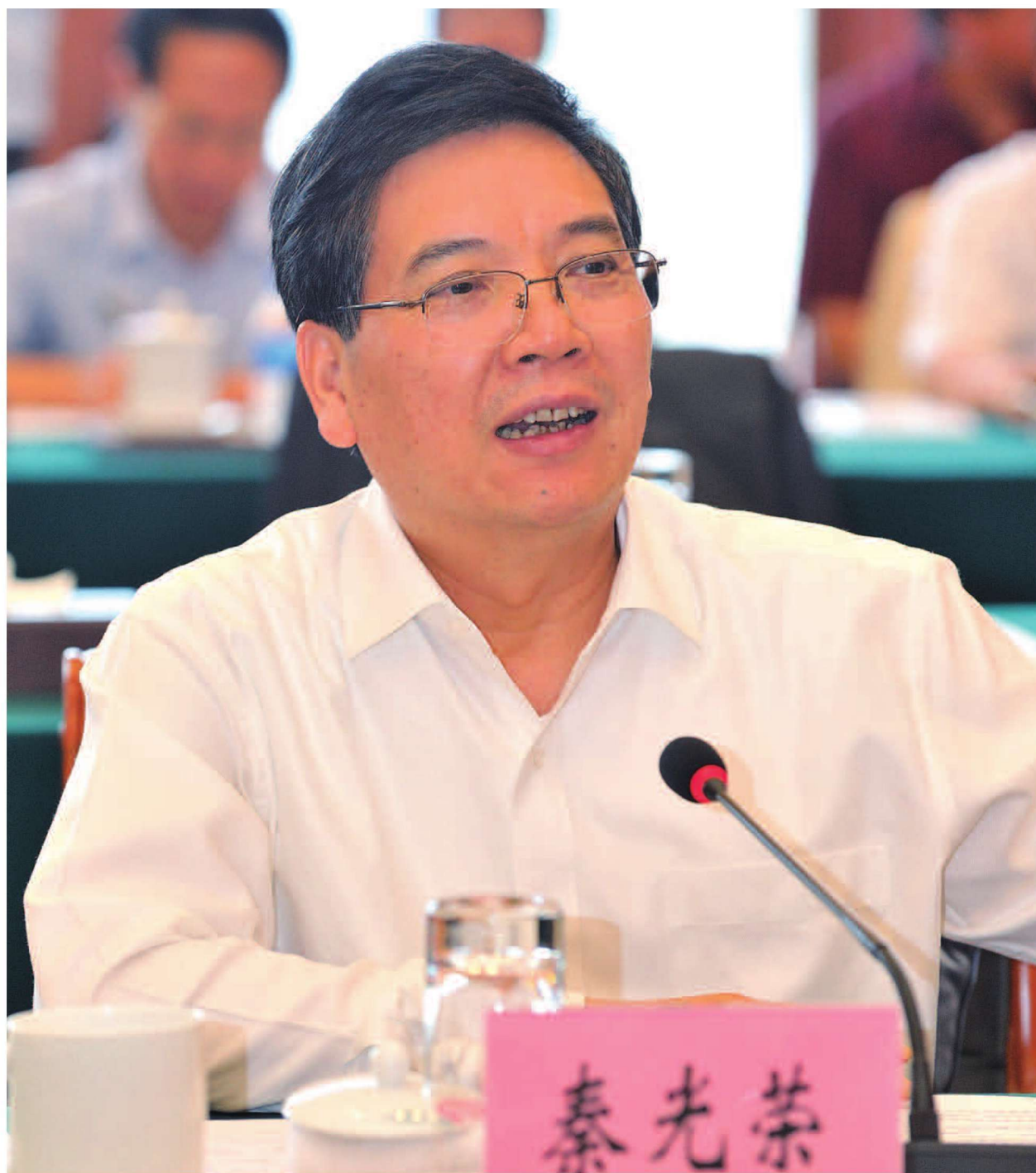
2012年 8月11日，商务部云南省部省合作联席会议在昆明举行。省委书记、省人大常委会主任秦光荣出席会议并讲话。