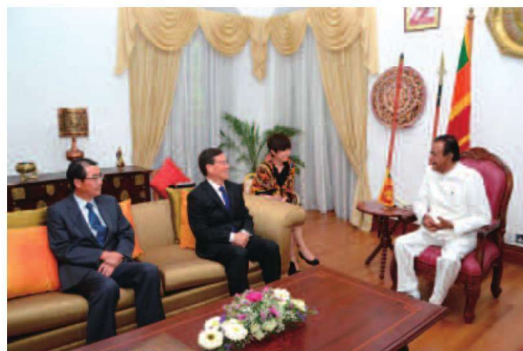
丁绍祥副省长会晤斯里兰卡总理