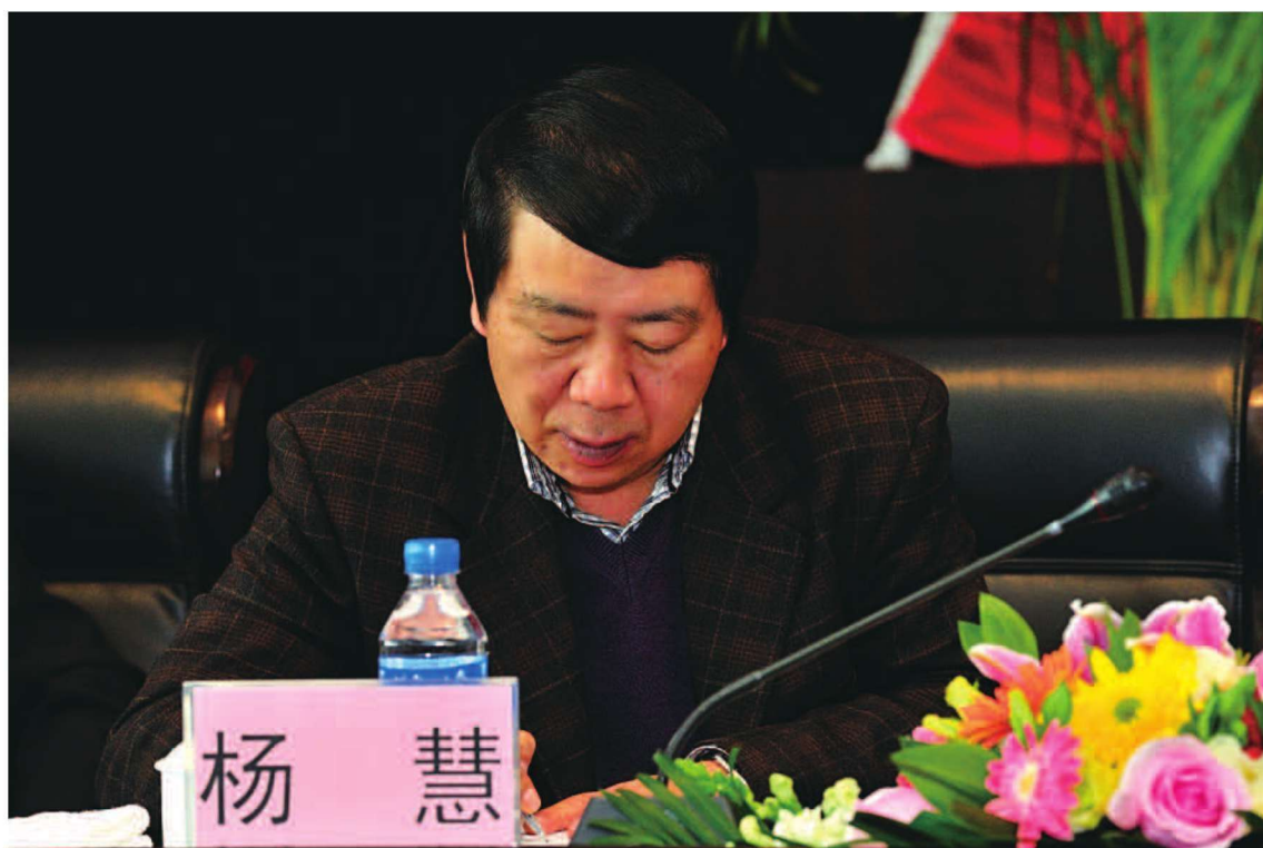
省商务厅党组成员、副厅长杨慧出席2012全省商务工作会议