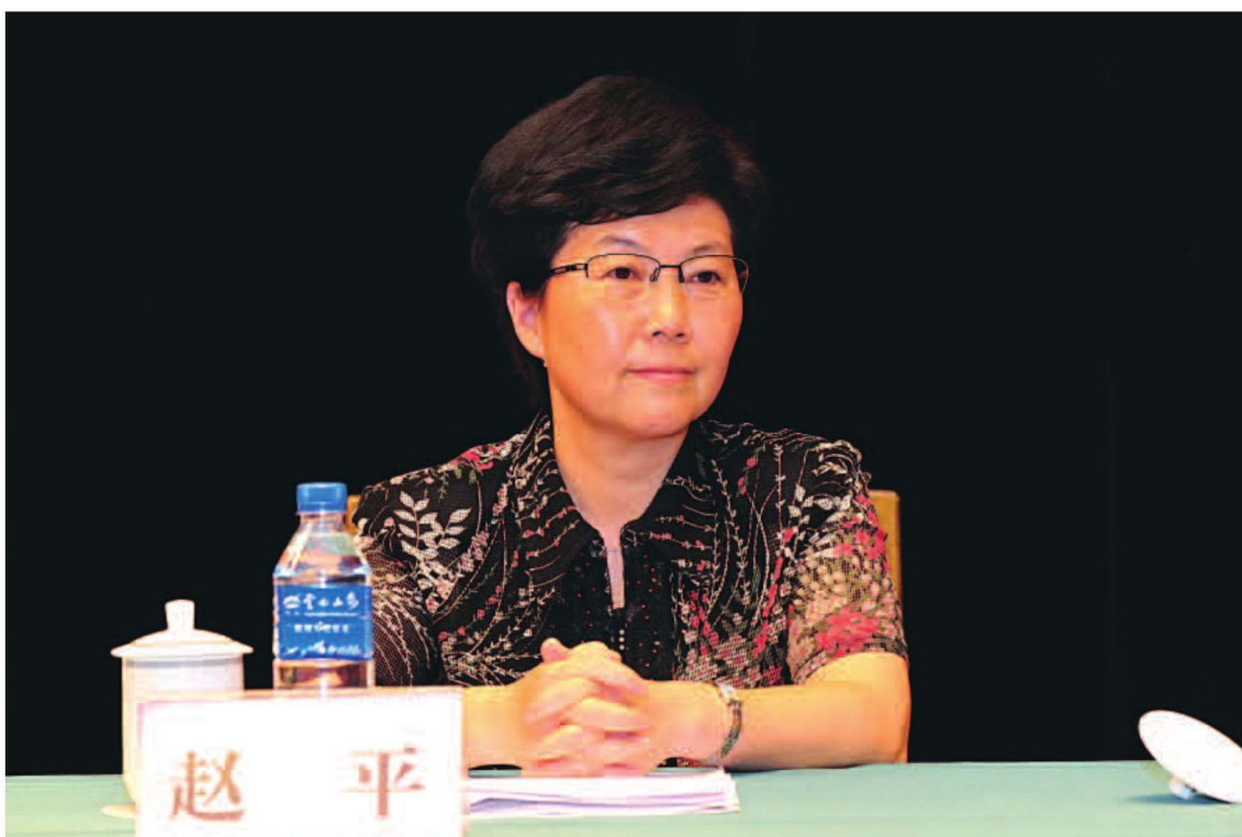
省商务厅党组成员、纪检组长赵平出席2012全省商务工作会议