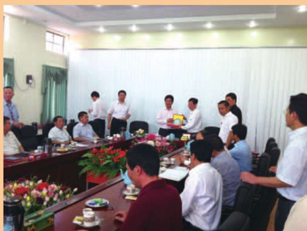
联系缅甸华商商会