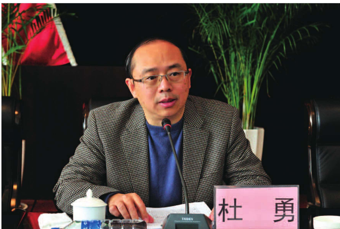
省招商合作局局长杜勇出席2012年全省商务工作会议