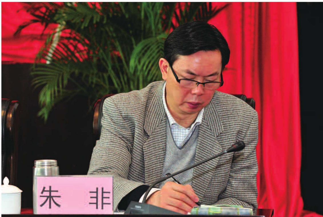
省商务厅党组成员、副厅长朱非出席2012全省商务工作会议