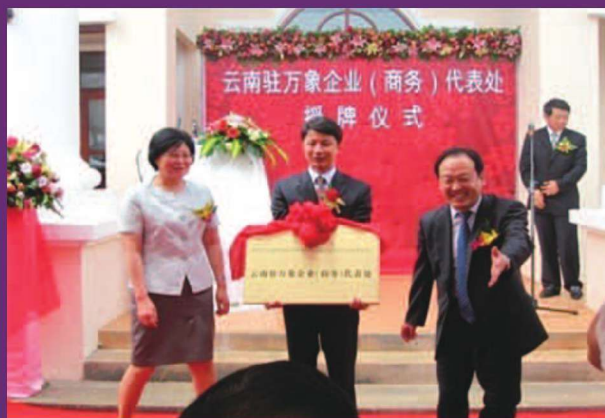
云南驻万象商务（企业）代表处成立授牌仪式现场