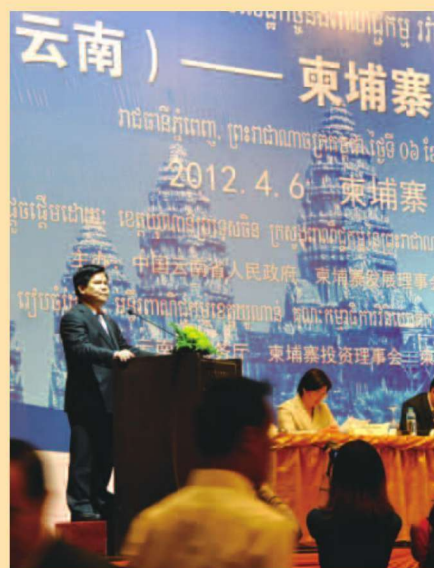
2012年4月李纪恒省长 参加云南—柬埔寨经贸推介会