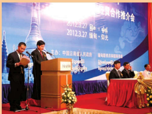
承担省委省政府的外事接待

ADD: 36-D-1Inya Road, Kamayut T/S Yangon, Republic of the Union of Myanmar