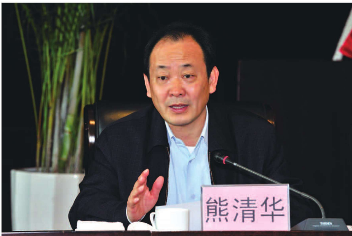
2012年1月17日，全省商务工作会议召开，云南省商务厅党组书记、厅长熊清华在会上作了“认清形势 迎难而上确保全省商务工作不断登上新台阶”的报告。