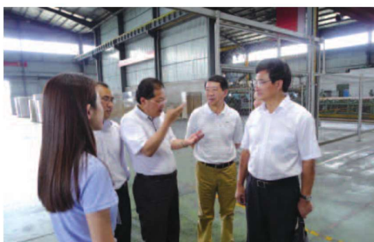
陪同领导考察企业