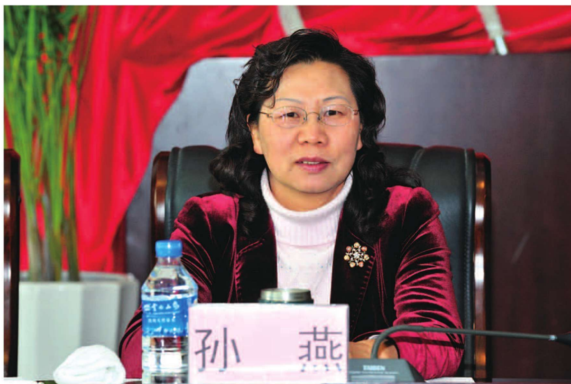
省商务厅党组成员、副厅长孙燕出席2012全省商务工作会议