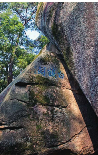
↑ 摩崖石刻——白鹤洞（溥杰题）