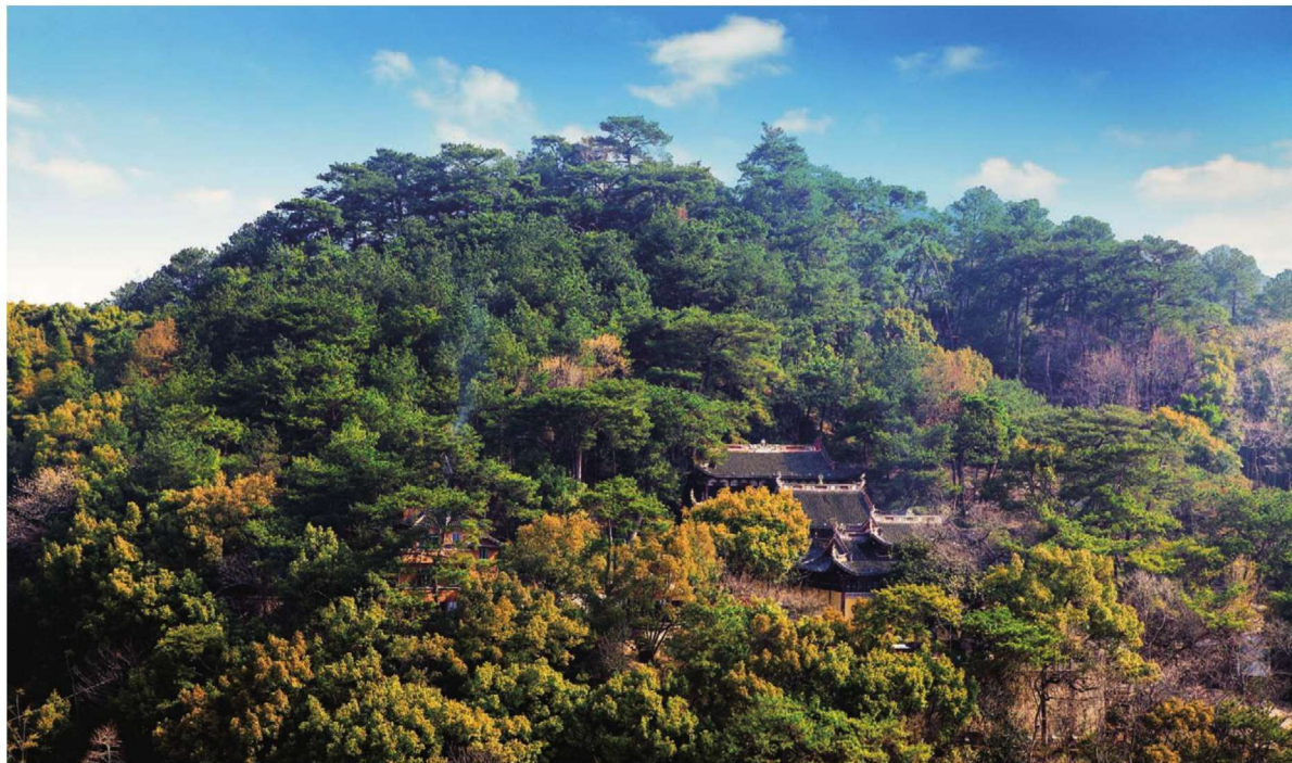
↑ 太鹤远眺

岁月悠悠，斗转星移。白鹤已衔芝草飞没于远空，真人已凌空步虚仙踪无觅处。现在，太鹤山已由道家的“洞天”、白鹤的栖息地，建造成为供市民、游人休闲游览的公园。相传唐代道士叶法善在此炼丹成功之后用剑劈裂的“试剑石”、白鹤栖居过的“白鹤洞”、乡贤端木国瑚埋《周易》书稿的“易冢”，还有孝顺岩、公鸡岩、问鹤亭、点易亭、丹井等都是太鹤山公园里的著名景点。