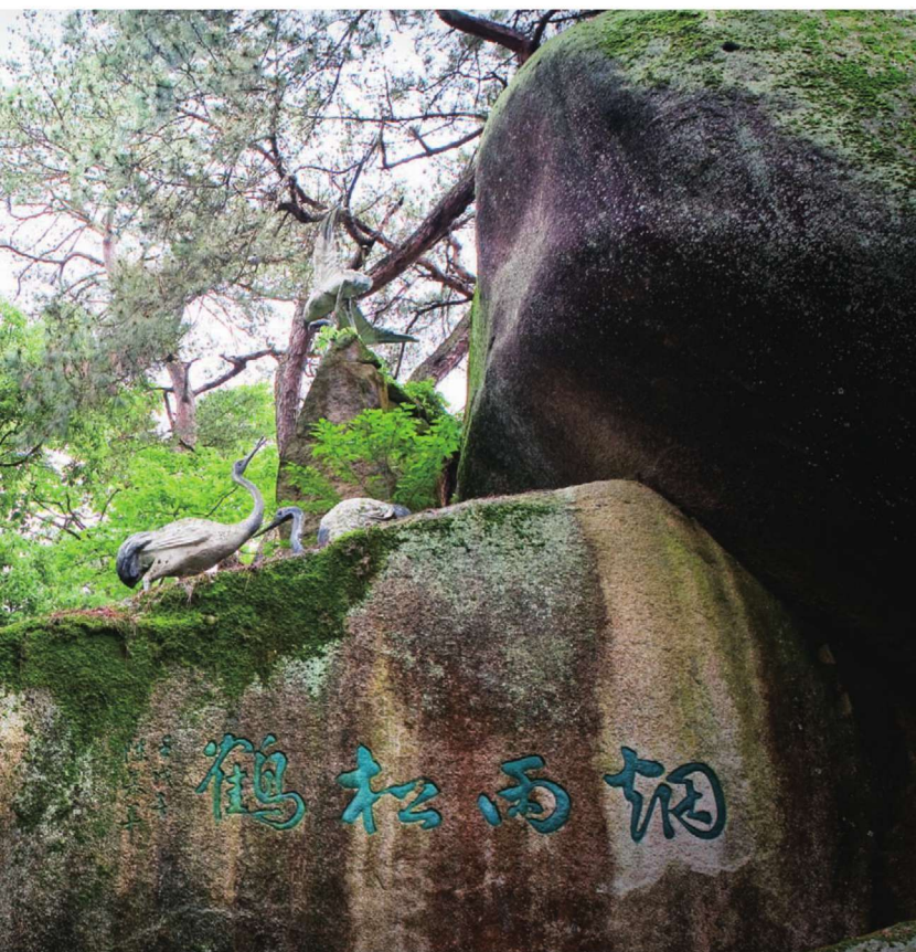
↑ 摩崖石刻——烟雨松鹤（陈慕华题）

除了上述风景名胜之外，太鹤山上还有很多风雅古朴的摩崖石刻。太鹤山的摩崖石刻有题名、题刻、刻画三种形式，宋元明清皆有，行楷篆草齐备，颇具学术研究和观赏价值。其中在混元峰东面石壁上，由青田教谕郑奎光画刻的《杨枝观音像》（1623年），宽1.63米，高3.80米，尤为珍贵。太鹤山摩崖石刻，现已被列为浙江省第五批文物保护单位。