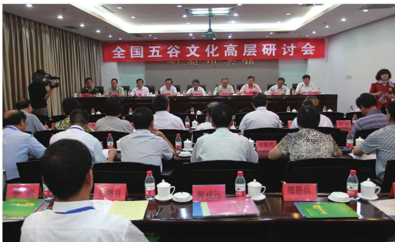
2012年8月1日全国五谷文化高层研讨会会场