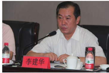
2012年8月1日河北省文化厅副厅长李建华在全国五谷文化高层研讨会上发言