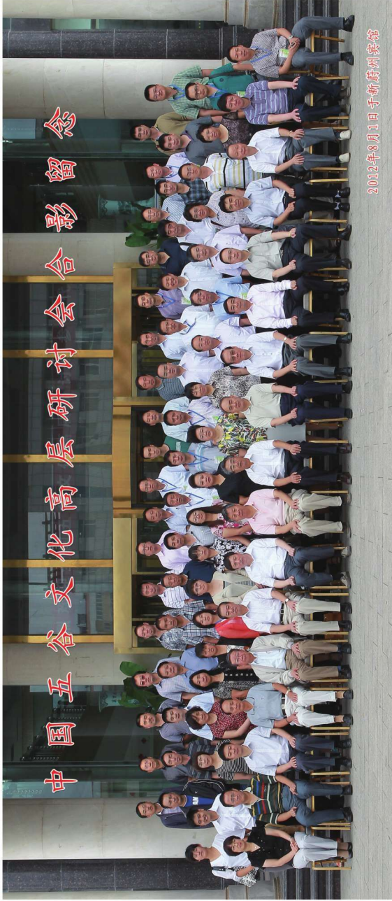
2012年8月1日全国五谷文化高层研讨会合影留念