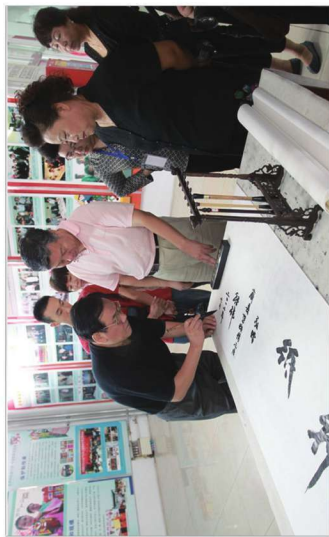
2012年7月31日参观考察中国剪纸第一街