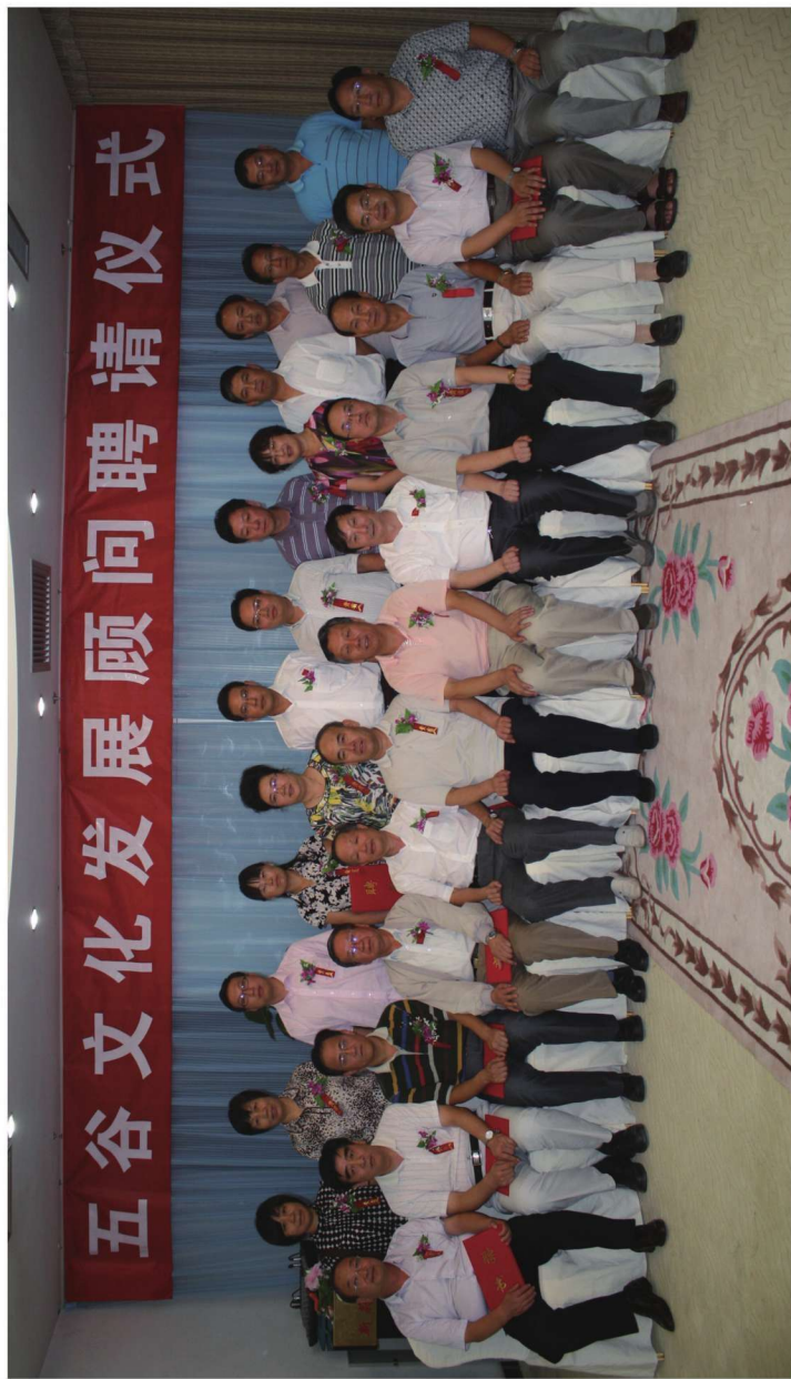
2012年8月1日五谷文化发展顾问聘请仪式留念