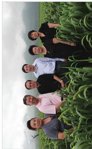
(左一：河北省老年产业协会秘书长 田晶丽 左二：蔚县委书记 王志军 左三：河北省委农工部部长 董经纬 右三：河北省农林科学院院长、总农艺师 赵治涛 右二：河北省老年产业协会常务副会长 朱作芳 右一：蔚县政协副主席 贾智彬)