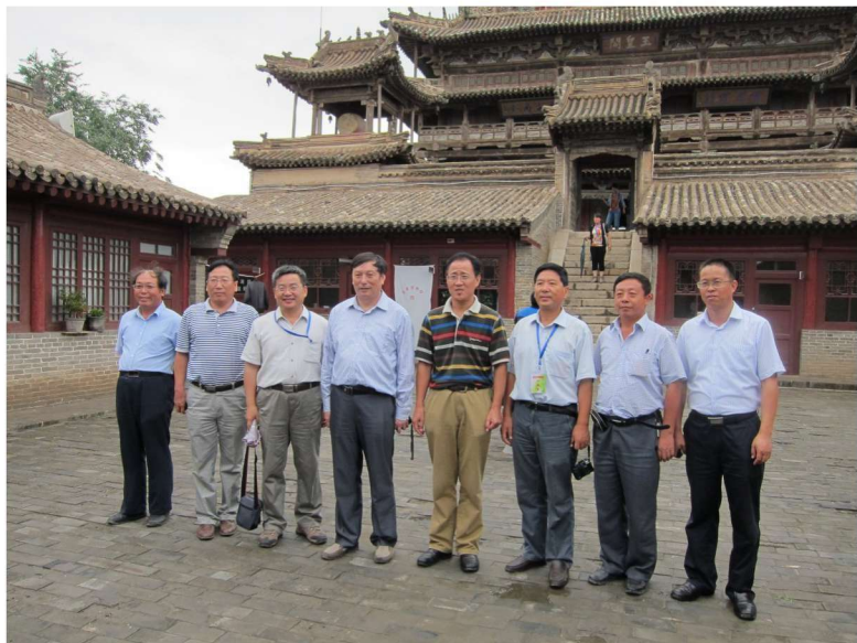
国家谷子糜子产业技术体系首席专家、部分岗位科学家考察玉皇阁