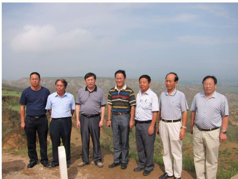
国家谷子糜子产业体系首席专家、部分岗位科学家考察泥河湾文化遗址