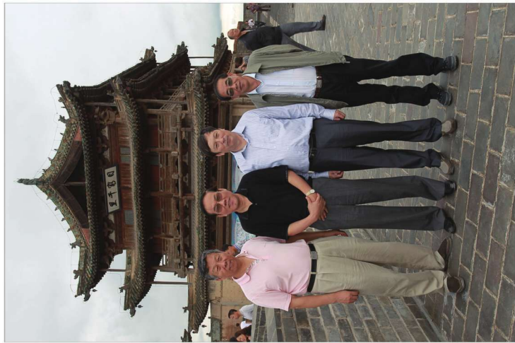
2012年7月31日参观考察玉皇阁

(左: 蔚县委书记 王志军 中: 原河北省人大副主任 张群生 右: 河北省委农工部部长 董经纬)