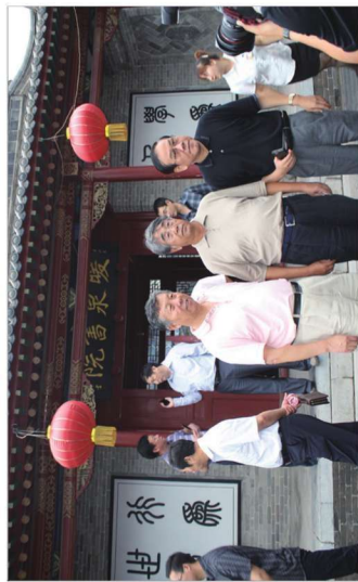
2012年7月31日参观考察暖泉古镇

(左: 蔚县委书记 王志军 中: 原河北省人大副主任 张群生 右: 河北省委农工部部长 董经纬)