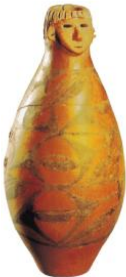
> 秦安大地湾人头形器口瓶

这样的自然环境促使他们在性格方面既有游牧民族豁达、开阔、与天地自然融为一体的情怀，也有农耕民族求稳、本分安静、固执、封闭狭隘的一面。