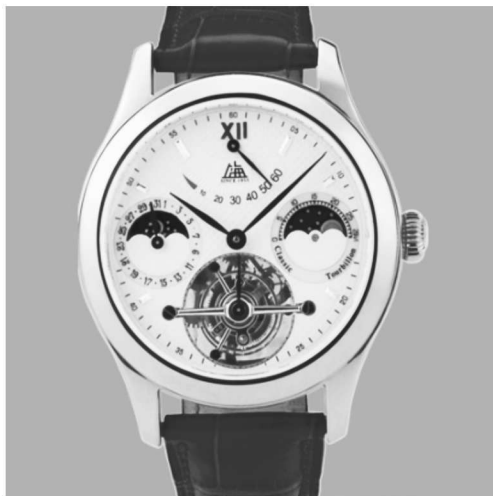
图 1-4 设计新颖的陀飞轮

思考路径:上海牌手表的故事里体现了怎样的经济模式变迁? 订单主导的生产模式下,工作岗位出现了怎样的变化?