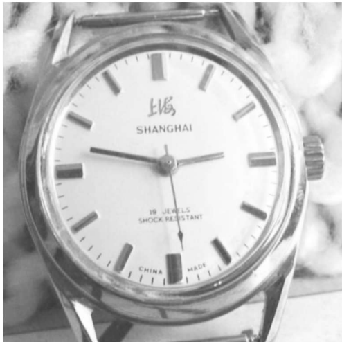
图 1-2 20 世纪 60 年代上海牌手表曾经是人们节衣缩食所追求的目标