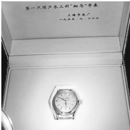
图 1-1 1955 年 9 月中国第一只细马机械手表在上海诞生

到 2003 年,企业不但扭亏为盈,而且利润额已经增加到 2600 万元。2010 年上海表业