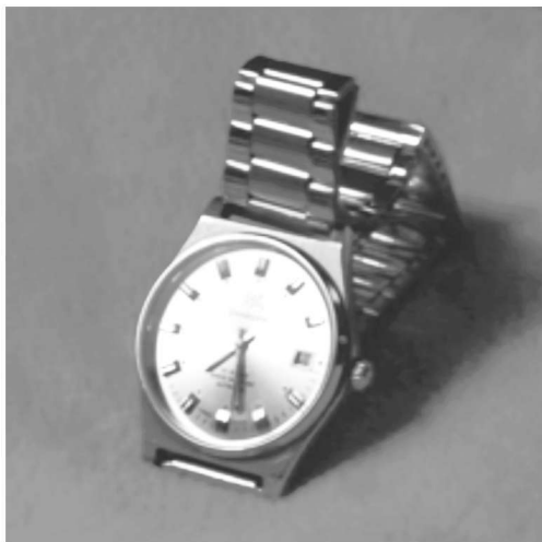
图 1-3 当时一只手表的价格相当于一个普通职工 3~4 个月的正常收入

订单加工带来利润,以销定产解决库存,但是没有自主权,品牌就没有定价权。脱去“廉价、低端、代工”的标签,重新打造钟表界的民族品牌,成为上海牌手表的梦想。今天中国手表产量已占世界产量的 70% 以上,却处于产业链的最下游,利润不过占全球表业的 10%。有人算过这样一笔账,整个中国一年制造 11 亿只手表,总产值是 10.6 亿美元,平均一只手表 1 美元还不到;瑞士一年生产 2700 多万只手表,但总产值是 62 亿美元,平均每只手表约 224 美元……中国表业的困惑仍与希望共存。