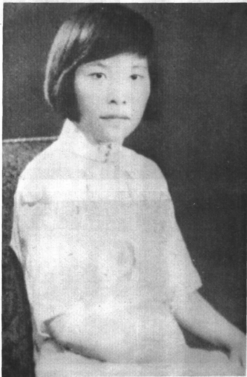
作者像（摄于三十年代初）