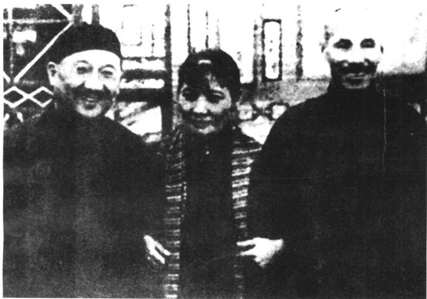
孔祥熙、宋霭龄和蒋介石在老家山西太谷。