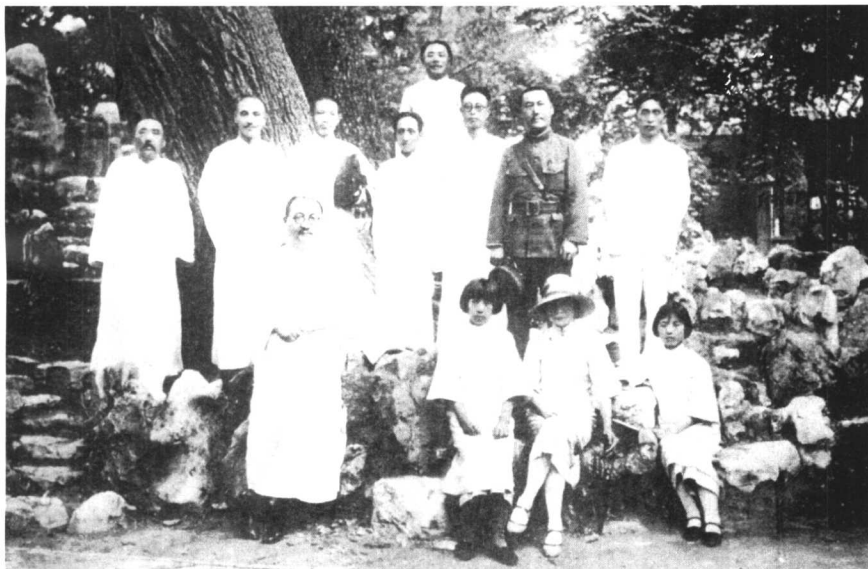
孔祥熙、宋霭龄与蒋介石在北京合影。