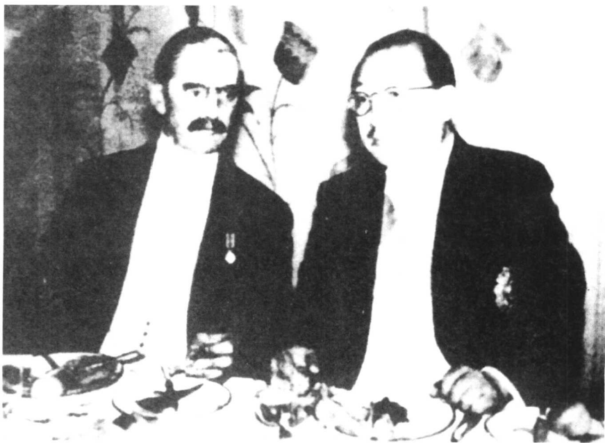
孔祥熙会晤英国首相张伯伦。