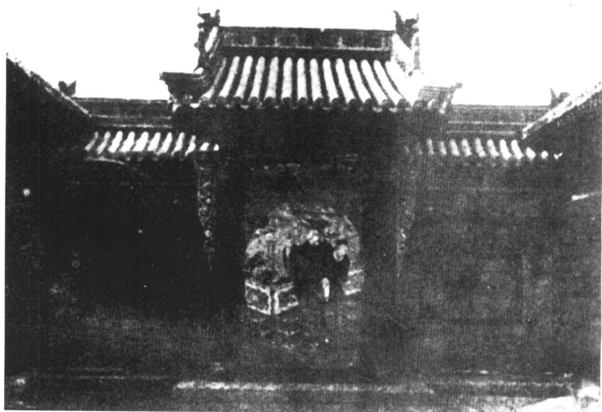
山西省太谷城內孔祥熙寓所。