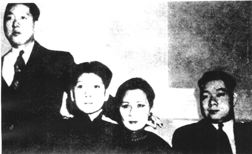
孔二小姐、孔令侃、孔令杰与姨妈宋美龄合影。