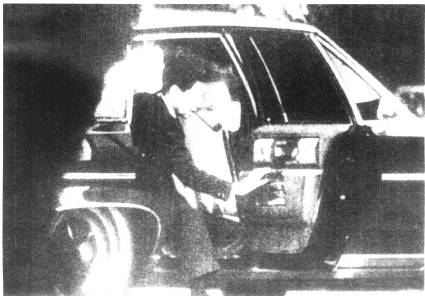
孔二小姐在台北男装照。