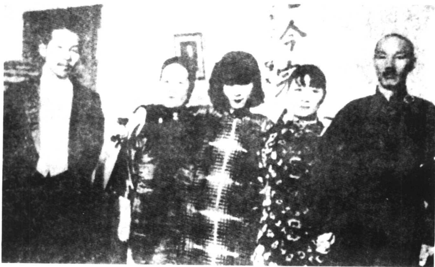
蒋介石、宋美齡、宋霽齡、张学良合影。