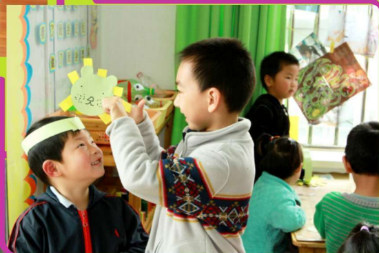
做好头饰，为弟弟带上