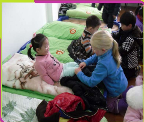
姐姐帮我脱裤子，谢谢好姐姐

每周一次大手牵小手的活动，由大班的哥哥姐姐牵着小班的弟弟妹妹一起散步、阅读图书、分享玩具、共同绘画等。活动中孩子们深切感受到了友善关爱、团结互助的交往情谊。