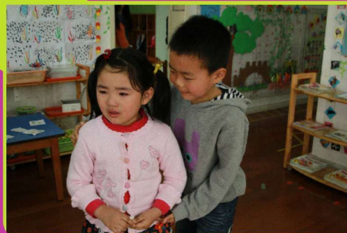
妹妹不哭，有哥哥在