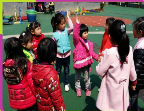
我和姐姐做游戏，真开心