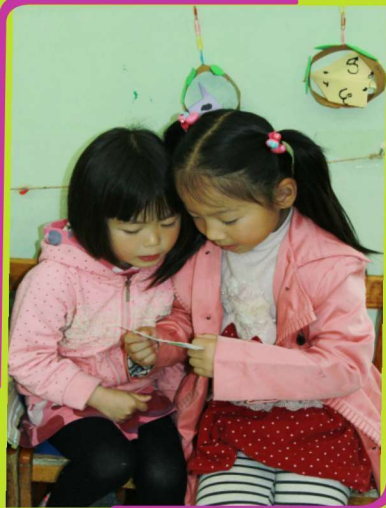
看看玩了几个游戏了