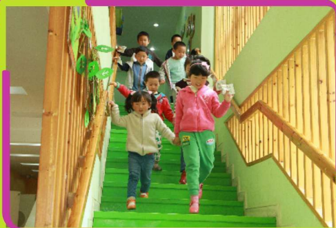
大手牵小手一起去游园