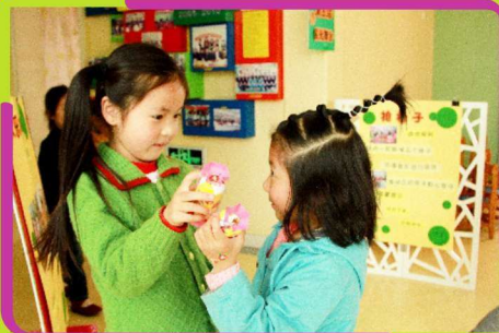
领到奖品，好开心啊