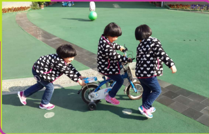
三姐妹的快乐有约