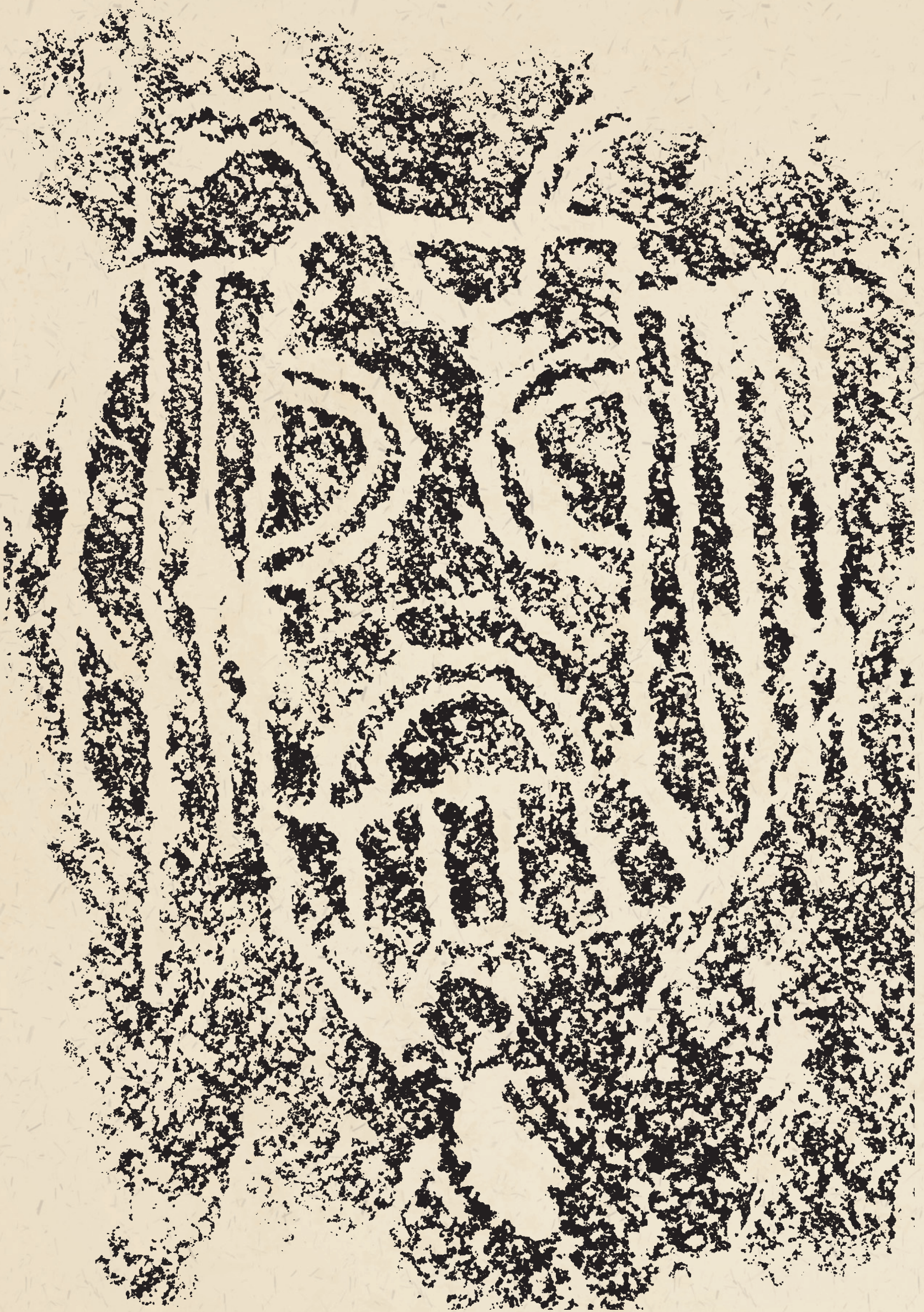
人面像 a human face (62cm×68cm)