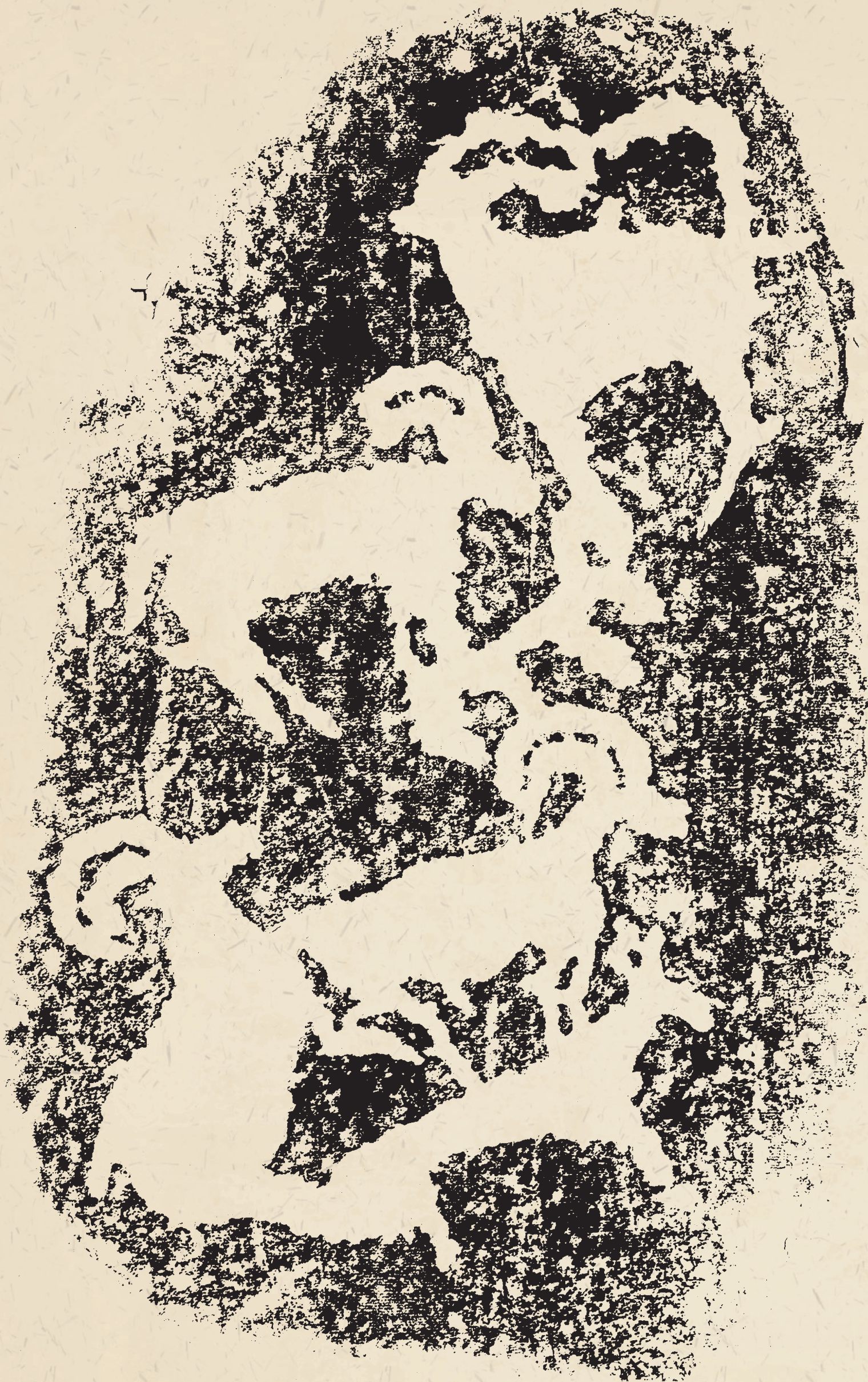
群羊 ibex figures (53cm×32cm)