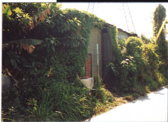
←800多公 斤炸药最后就 是藏在香港这 间铁皮房里。