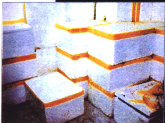
←装炸药的 塑料发泡箱。