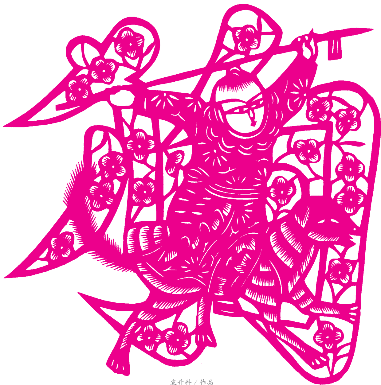
袁升科 / 作品