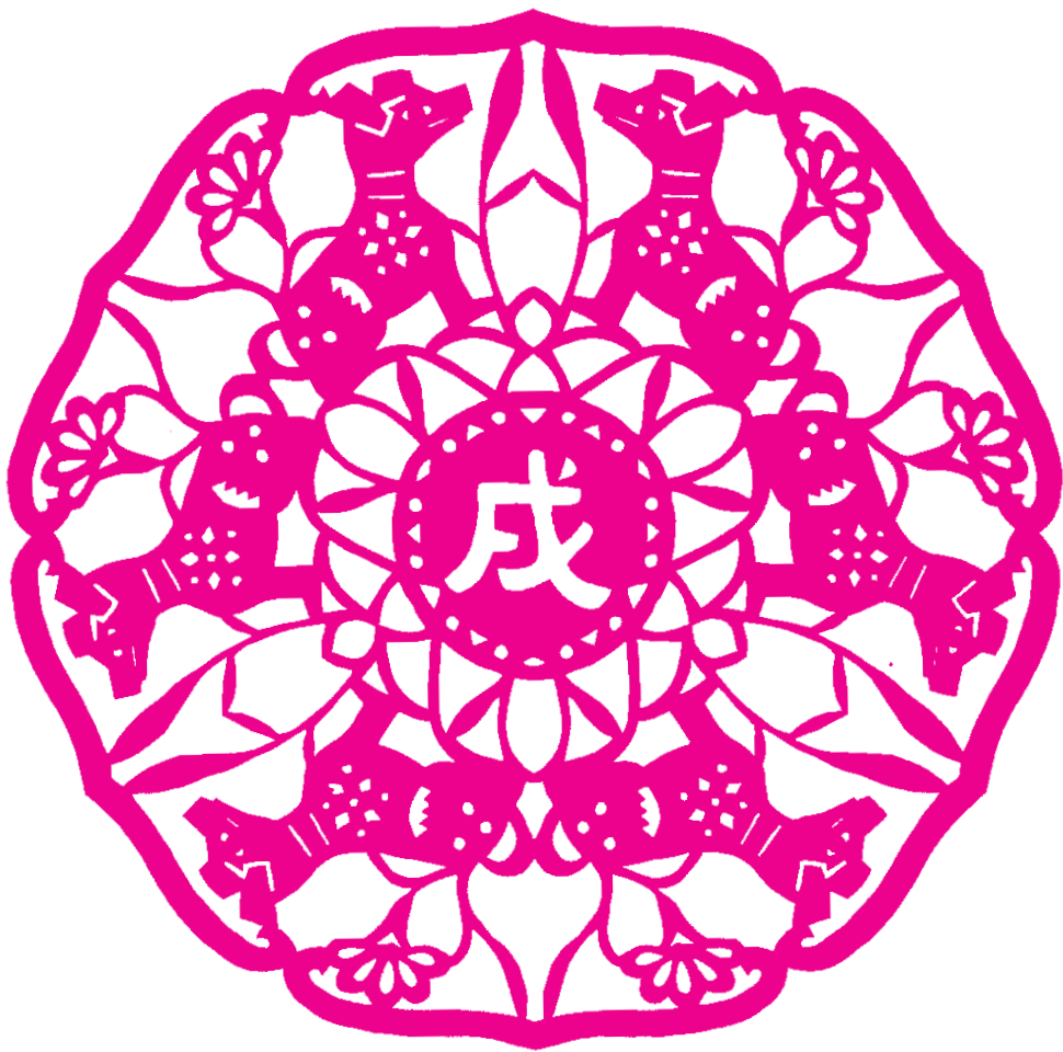
连德林 / 作品