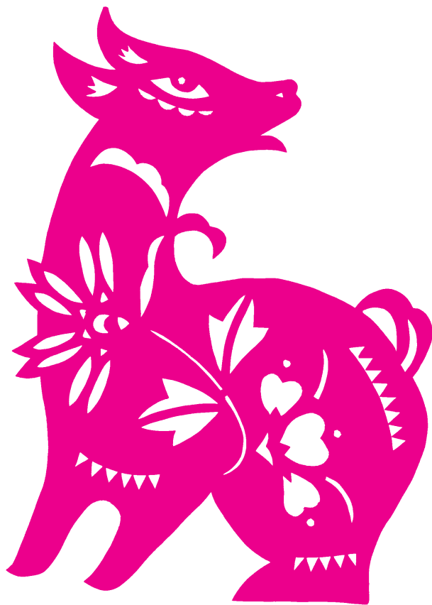
连德林 / 作品