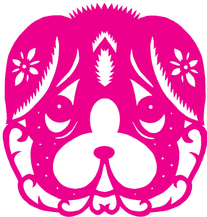
连德林 / 作品