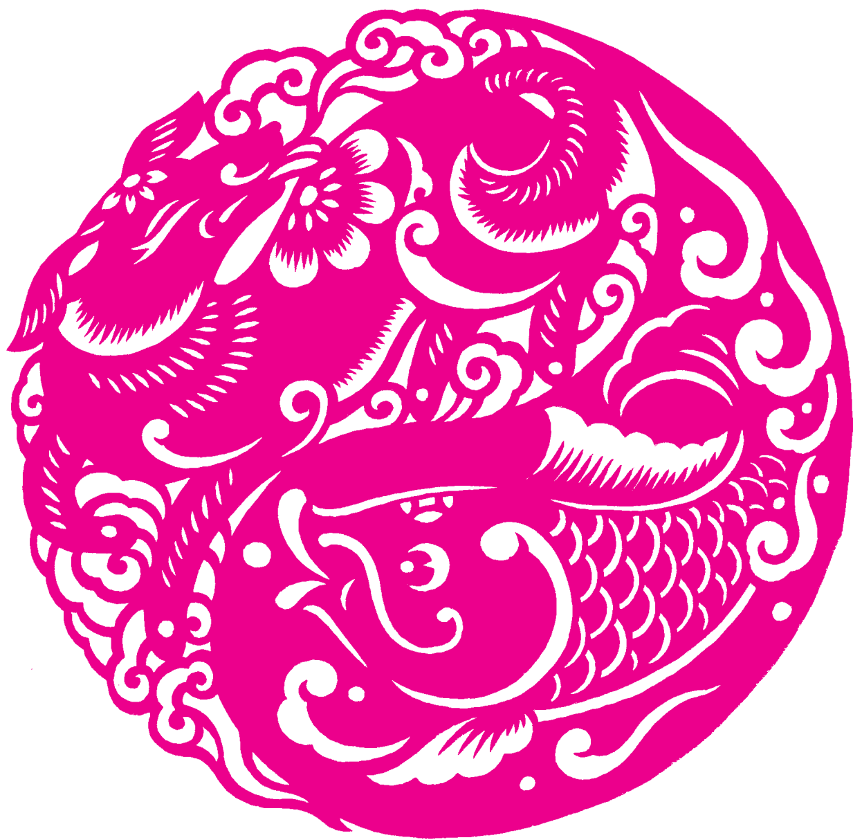
袁升科 / 作品