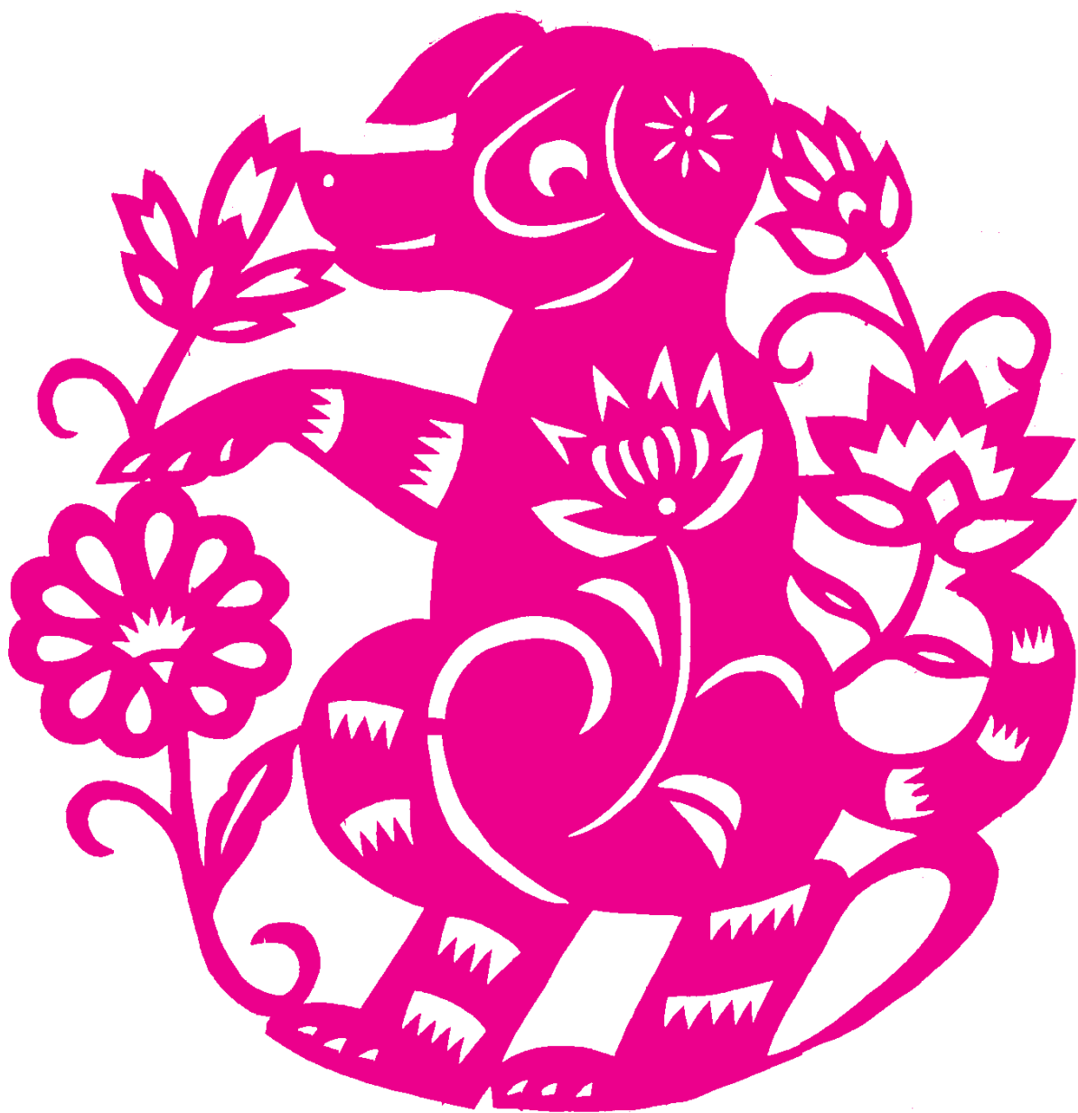
连德林 / 作品