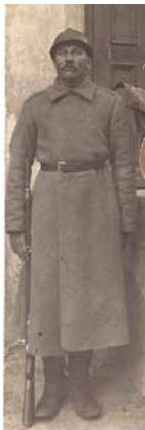
▲ 一名佩戴法国M15钢盔的俄罗斯士兵肖像照。