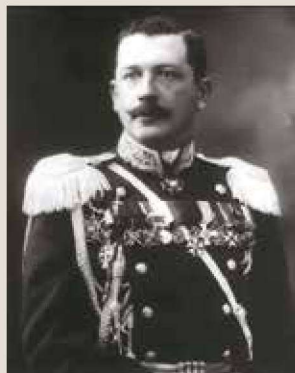
▲ 阿列克谢·阿列克谢耶夫斯基·伊格纳季耶夫上校。

军并没有装备钢盔，仅装备着制式军帽和毛皮帽，历史照片也证明这是一战时间俄军的头部主要装备，落后于其他欧洲国家。法军装备新式钢盔后，驻法国的俄罗斯军事武官，伯爵阿列克谢·阿列克谢耶夫斯基·伊格纳季耶夫上校（Алексей Алексеевич Игнатъев, 1877-1954）在1915年向军方报告了法军的新式钢盔，并建议为俄军进口这种钢盔。伊格纳季耶夫参加过日俄战争，1908-1912年担任驻丹麦武官，1912-1917年担任驻法国武官。在俄国革命后他投身苏维埃政权，但仍留在法国。1925年他把存在法国银行他名下原先属于俄罗斯帝国的22500万卢布资金转交给苏联政府，他的这一举动遭到了俄罗斯移民组织的联合抵制，后来他在巴黎为苏联政府贸易代表团工作。回到苏联后在苏军中服役，投身于军事教育工作，曾担任军事医学院外国教研组的主任。1940