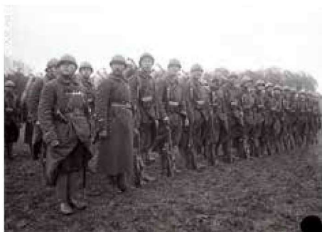
▲ 这张来自法国国防部的俄罗斯远征军档案照片，陈列在第一次世界大战博物馆，在这个博物馆有独立的展区陈列马利诺夫斯基元帅档案的纪念资料，马利诺夫斯基元帅的名字与俄罗斯的法国远征军史密不可分。