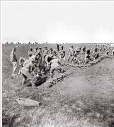
▲ 第1旅的士兵正在营地附近战壕构筑训练，注意此时他们已经配备了钢盔。