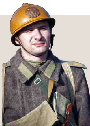
▲ 由现代军迷扮演的一战俄罗斯士兵，头戴来自法国的钢盔。