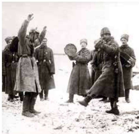
▲ 1915年东线几名俄军士兵正在教德军战俘跳舞，注意俄军士兵只戴着软毛帽。

1914年8月，俄军在东线发动了第一场战役，史称东普鲁士战役，即坦能堡会战，这场战役中俄军的表现让人大跌眼镜，由于无能的指挥，西北方面军以失败告终，第二集团军全部损失，其司令官萨姆索诺夫战败自杀，俄国人共损失了25万的士兵和大量武器装备，灾难性的后果也预示着俄国将不可避免的面临失败。面对巨大的损失，官老爷们终于缓慢地意识到