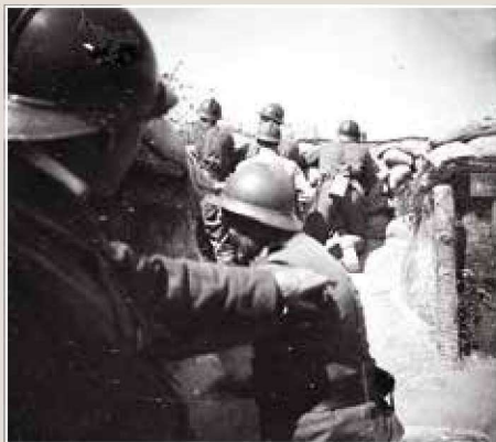
▲ 这张战壕中的照片显示俄罗斯远征军的士兵装备了法式装备，以减轻法国的弹药供应负担。