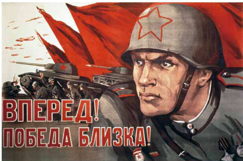
▲ 卫国战争时期的苏军宣传画，此时新式钢盔已经被作为标准装备。