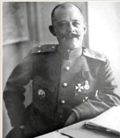
▲ 弗拉基米尔·弗拉基米洛维奇·马鲁舍夫斯基。曾参加过日俄战争，1915年12月6日晋升少将，1916年7月指挥第3特别步兵旅前往法国，1917年春参加了法国北部的战斗。1917年5月组建第1特别步兵师，由于与下属的冲突被迫交出指挥权并被召回俄罗斯。1917年3月以预备军衔在彼得格勒军区司令部重新服役。1917年9月26日成为俄军最后一任总参谋长，1917年10月20日被以“旨在反对苏维埃的谈判，在组织停战谈判代表团时罪恶地进行暗中破坏”，被列宁下令逮捕，交保释放出狱后逃往芬兰，1918年8月前往斯德哥尔摩。1918年11月因英国和法国军事使团的邀请抵达阿尔汉格尔斯克，并被任命为北方地区总司令，同时成为北方临时政府成员，担任总督、内务部长等职。在英国干涉军的支持下，领导组建白军北方集团军，约有20万人。1919年1月将总督职务交给米勒，他保留了部队总司令的职务（在战斗中实际上担任叶夫根尼·卡尔洛维奇·米勒的助手，米勒于同年5月担任北方集团军总司令），1919年5月晋升中将，1919年8月辞职。前往瑞典后流亡南斯拉夫，死于萨格勒布。