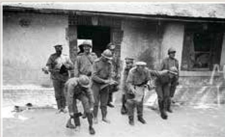
▲ 一队正在擦拭靴子的第1旅士兵，他们头戴法式钢盔，身上却穿着俄式军服。