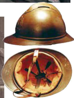
▲ 俄军使用的法国M15钢盔，这是一顶配发给在俄国战斗的俄国陆军部队钢盔，带有罗曼诺夫双头鹰盔徽，通过原来安装法国盔徽的两个冲孔安装，涂装为橄榄色，带有法国原装皮革七指整体式衬垫。博物馆陈列的这顶钢盔涂着被俄罗斯人称为“橄榄色”的涂装，不过并不清楚博物馆的重新喷涂是否符合常常被忽视的俄罗斯涂装标准。