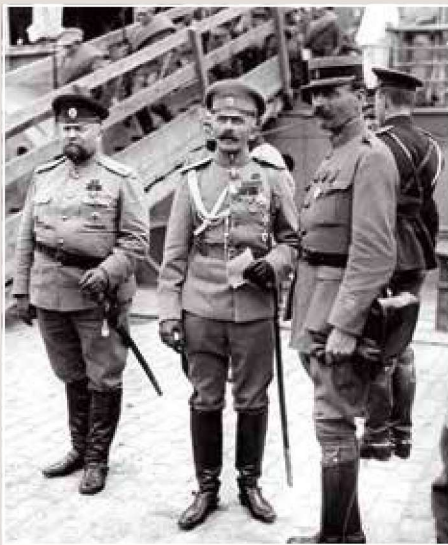
▲ 在萨洛尼卡登陆的俄国远征军第2旅长季捷利赫斯少将，他右边是第3团团团长塔尔别耶夫上校。