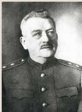
▲ 来自《1940年苏联将领》相集中的伊格纳季耶夫标准照。