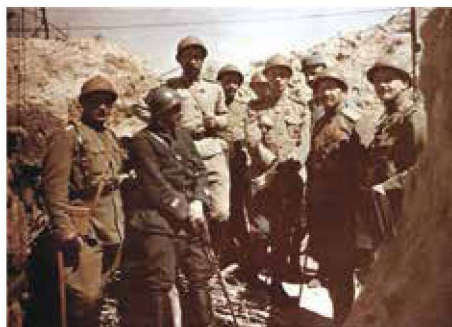
▲ 这是一张珍贵的一战时期的彩照，1916年夏季的法国香槟地区，在战壕中的俄罗斯远征第1特别步兵旅旅长洛赫维茨基少将（前排右起第三人）和法国军官在一起，他的右边是第2团团团长季亚科夫（Дьяконов）上校和团长副官克勒（Клере）中尉。这张彩色照片清晰展示了俄军制服和蓝灰色法军制服，还有不同颜色的钢盔。