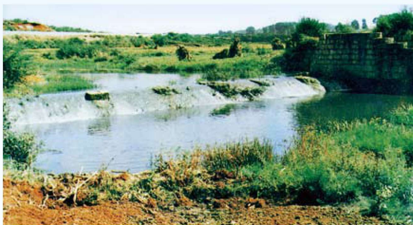
华惠渠溢流坝（1642年修建）