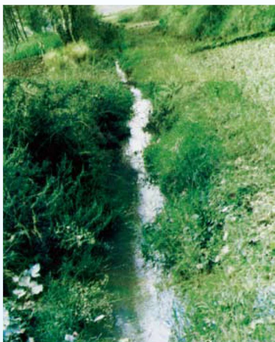
沾益官沟上段（1621年修建）