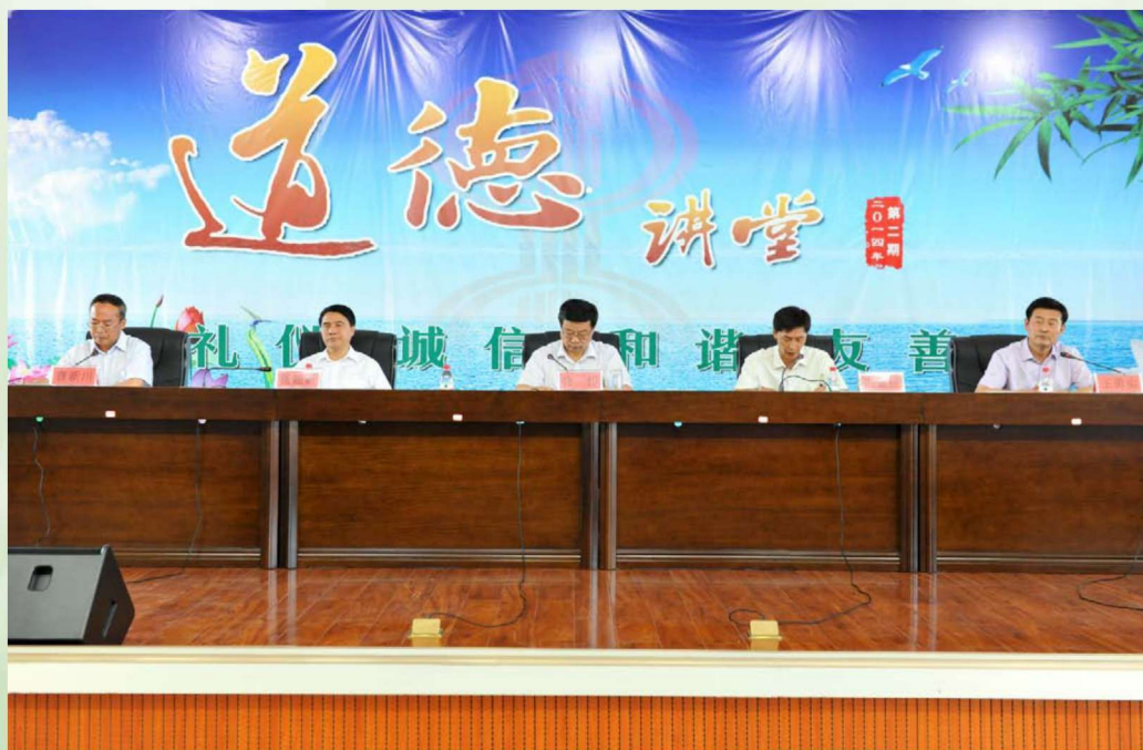
2014年7月,自治区国税局局长佟伟(左三)来伊犁州宣布王勇实(右一)局长任职。