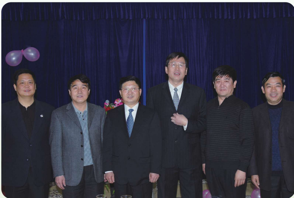
2005年12月30日,伊犁州党委书记张继勋(左三)在伊犁州国税局调研。