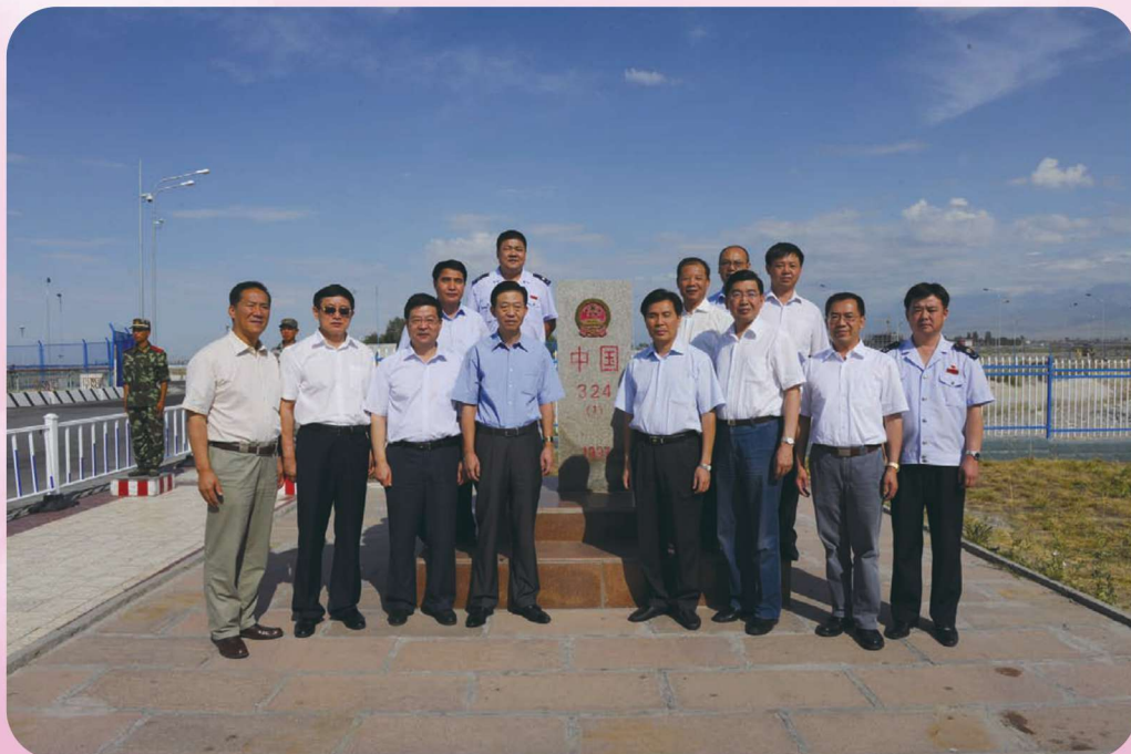
2011年8月,国家税务总局党组书记、局长肖捷(前排左四)在伊犁州考察调研。