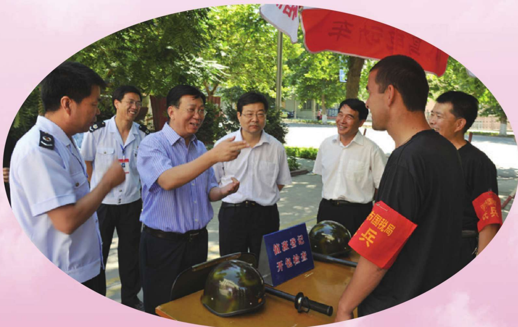
2012年6月,国家税务总局总会计师汪康(左二)在伊犁州调研,与国税干部交谈。