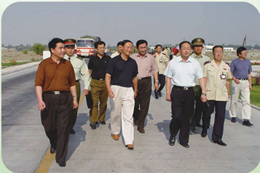
2003年9月,自治区国税局局长蒋立勋(右二)来伊犁州在霍尔果斯口岸调研。