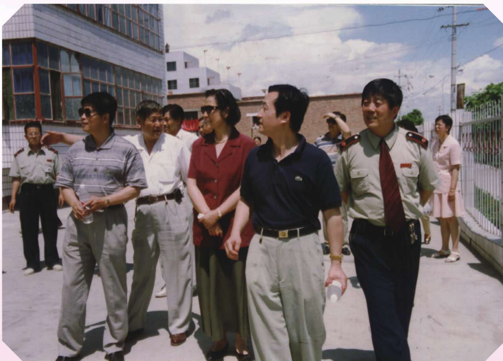
1996年10月,国家税务总局总经济师张英慧(女)在伊犁州调研。