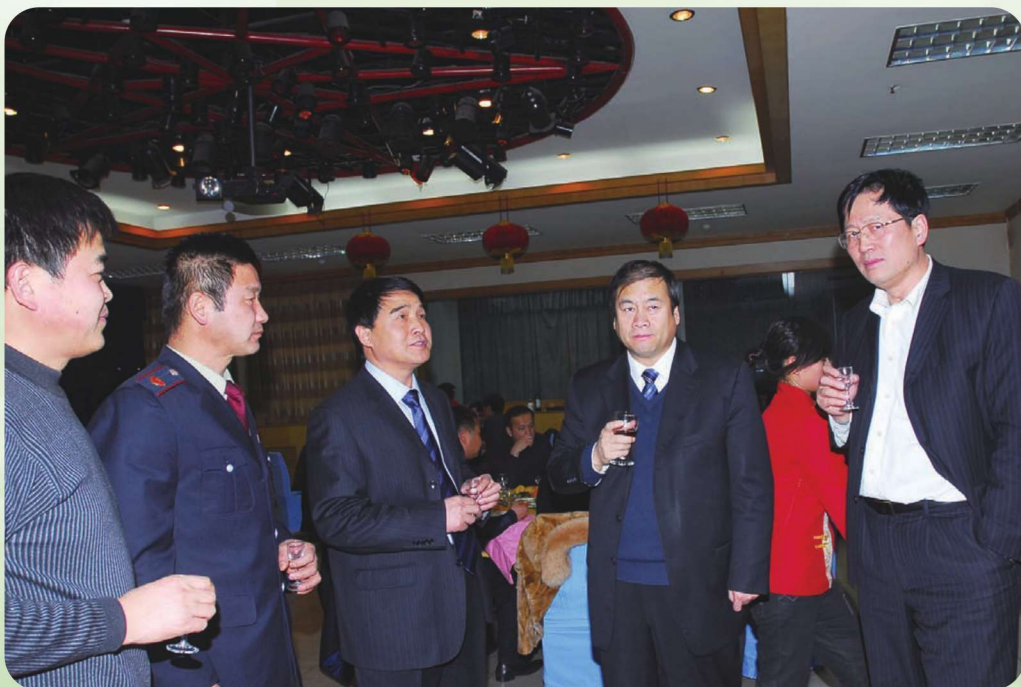
2008年11月9日,伊犁州党委书记李湘林(右二)了解国税工作情况。