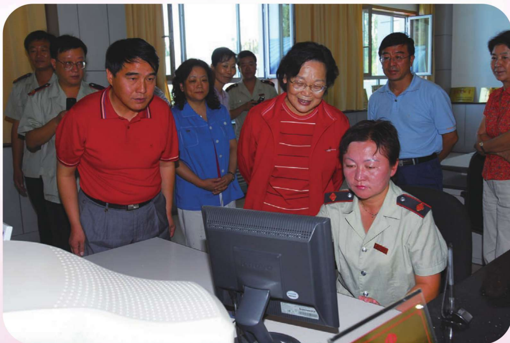
2006年8月,国家税务总局纪检组长贺邦靖(女)在伊犁州调研。