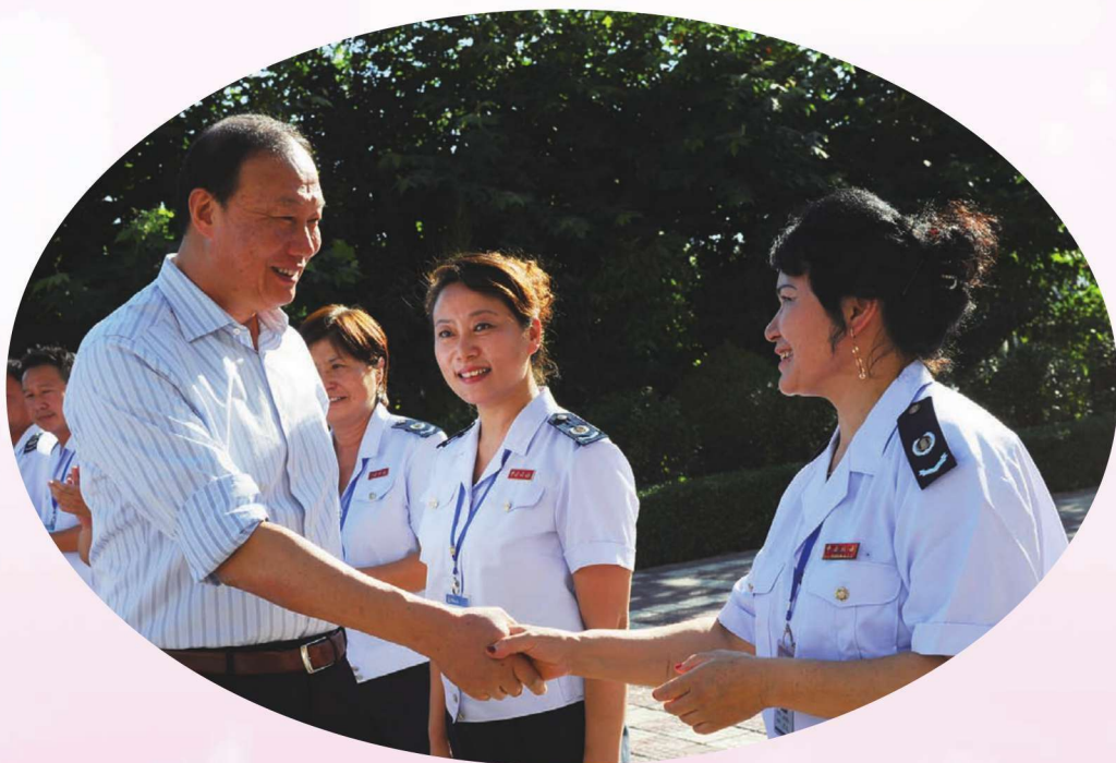
2011年9月,国家税务总局副局长钱冠林在伊犁州国税局调研。