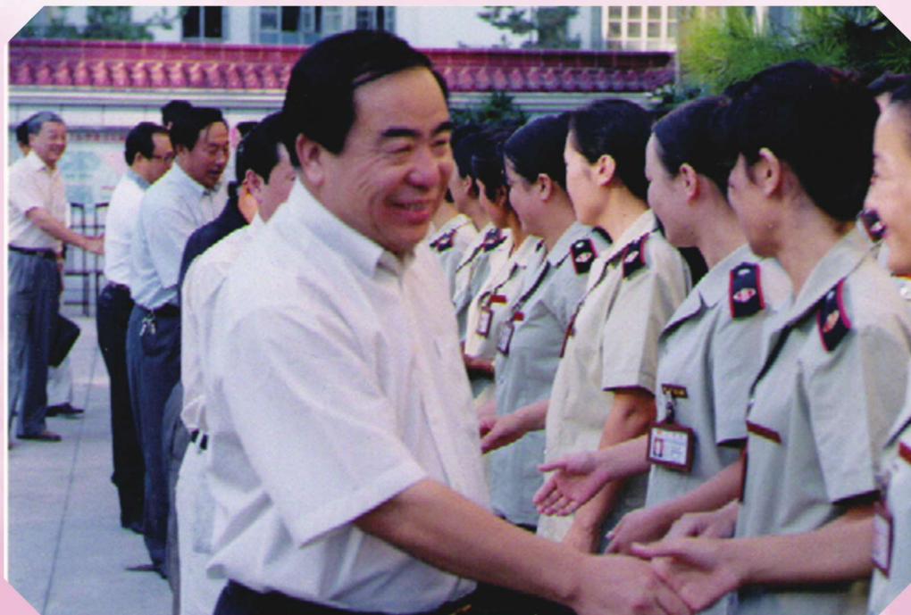
2005年9月,国家税务总局副局长崔俊慧在伊犁州调研,看望国税干部。