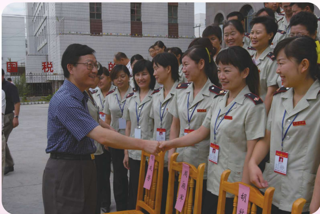
2005年8月,国家税务总局党组书记、局长谢旭人在伊犁州考察国税工作。