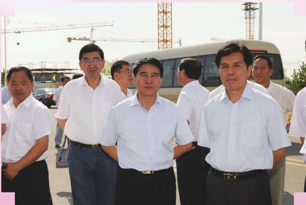
2011年8月,国家税务总局副局长丘小雄(右一)在伊犁州调研。