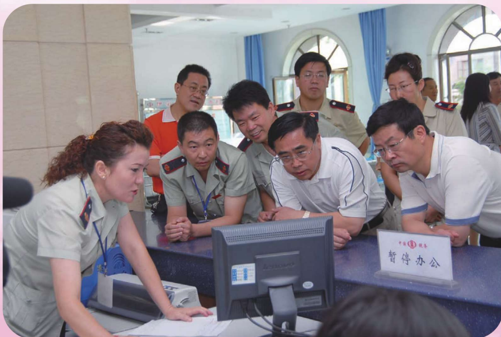
2007年8月,国家税务总局总经济师董树奎(中)在伊犁州调研。