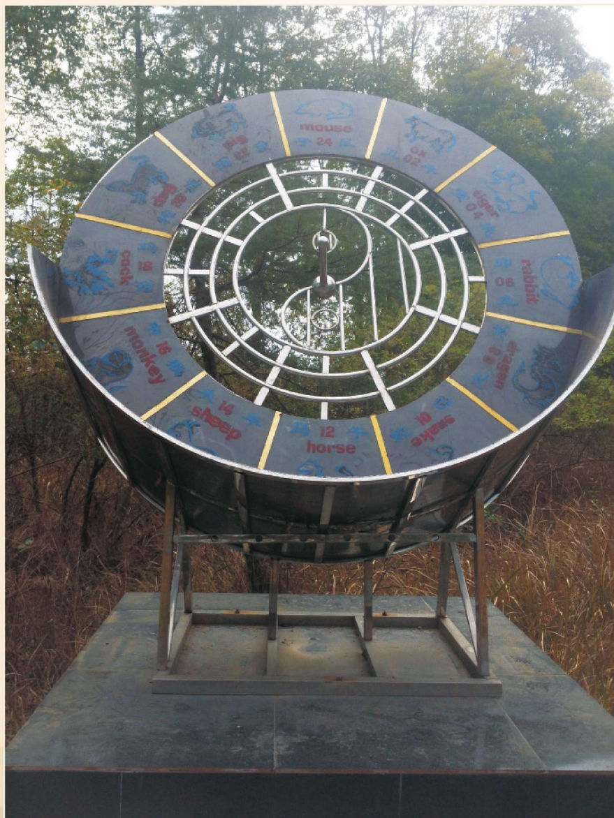
△ 陈列于阆中锦屏山的十二生肖盘