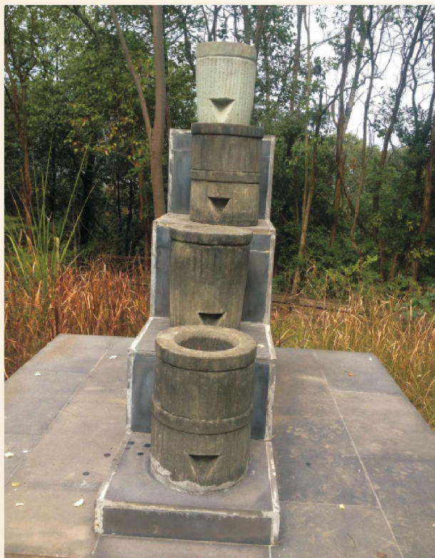
△ 陈列于阆中锦屏山的漏壺