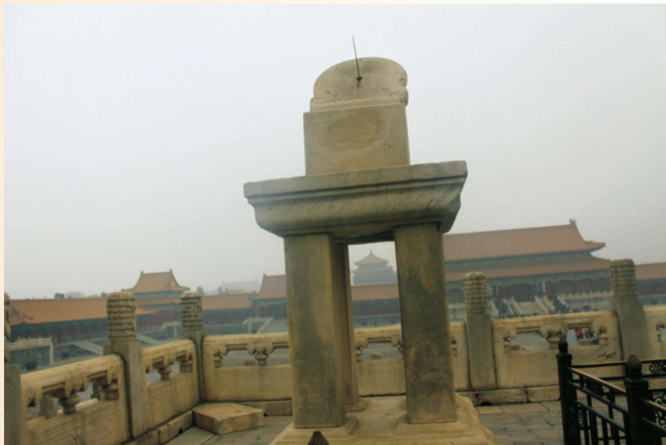
△ 陈列于北京故宫的观天日晷