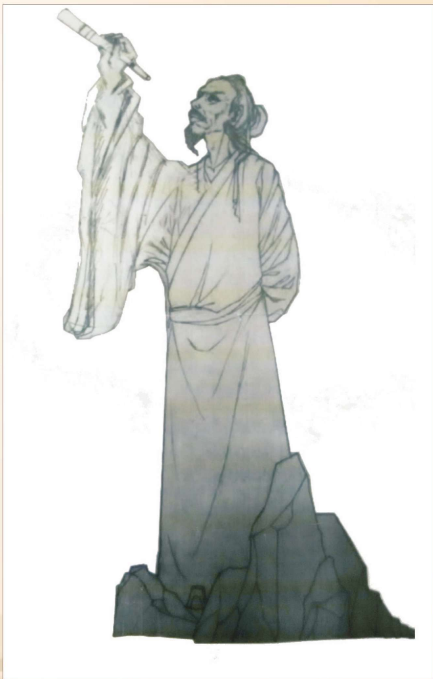
△ 矗立于桥楼落阳山上的落下闳观天塑像