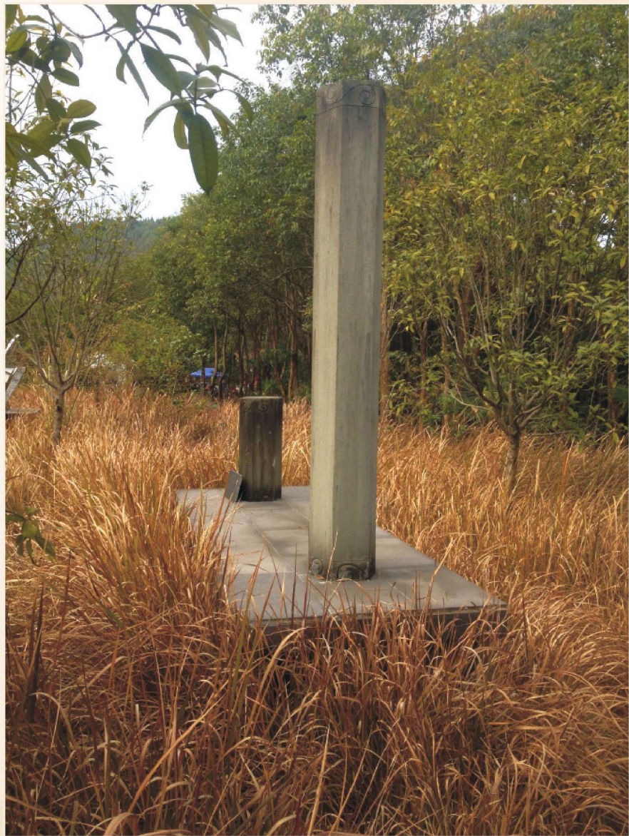
△ 陈列于闽中锦屏山的日影杆