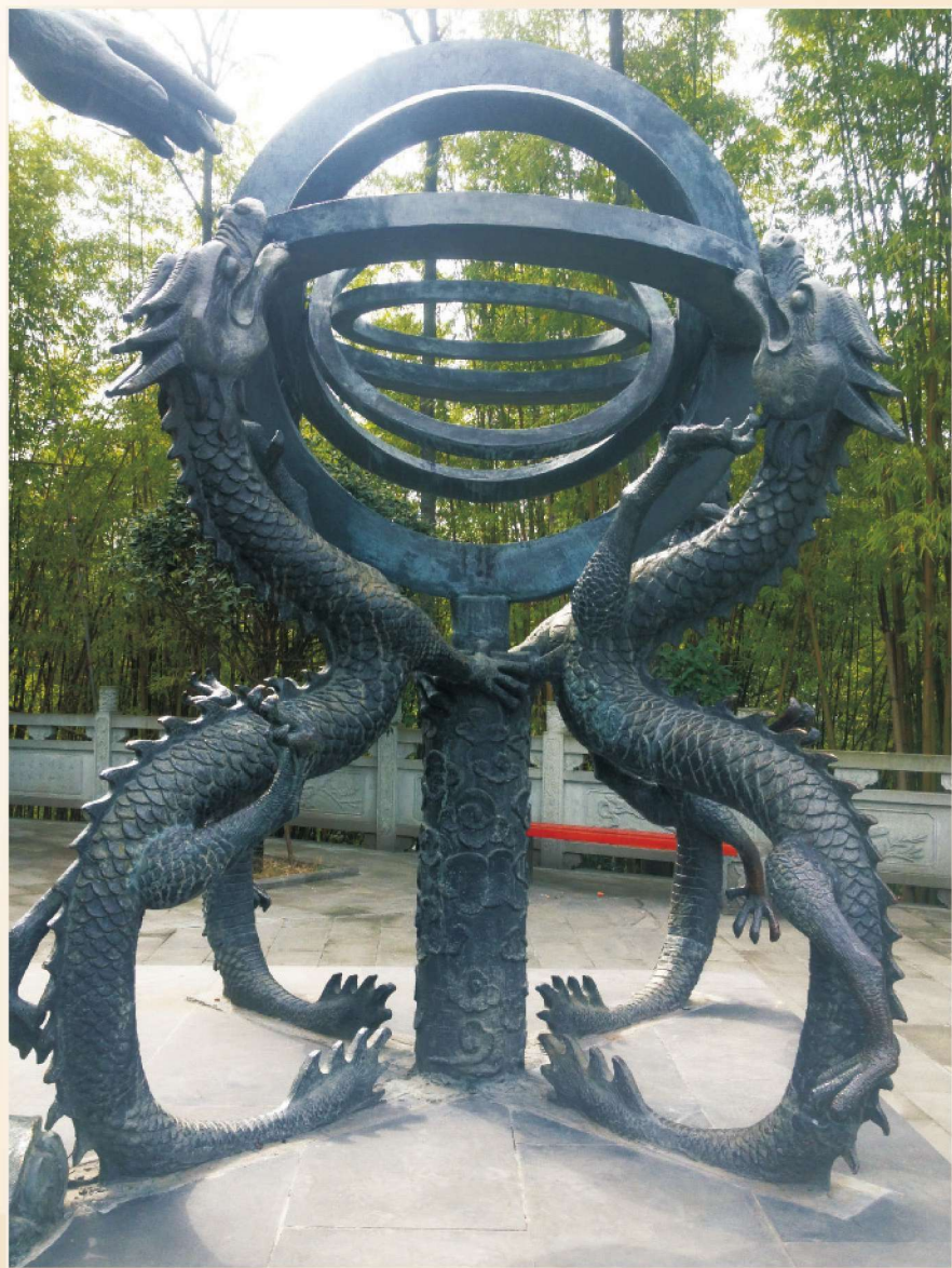
△ 陈列于南京紫金山天文台的浑天仪