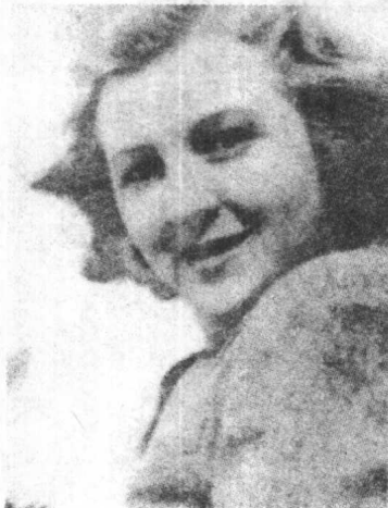
▼ 希特勒的情妇爱娃