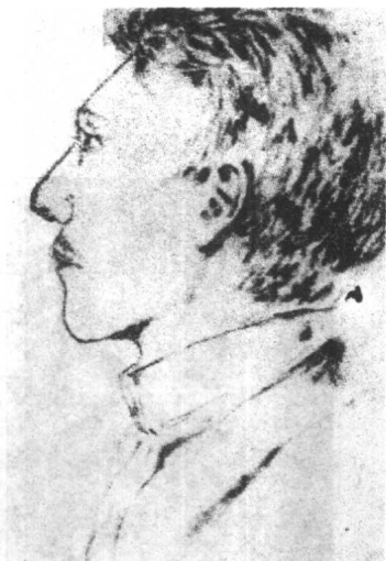
◀ 希特勒15岁时，他的同学给他画的肖像素描