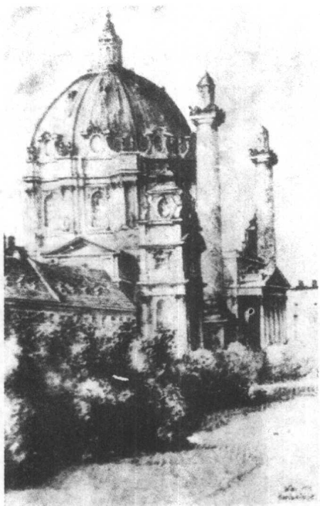
◀维也纳的教堂 ——希特勒的绘画作品