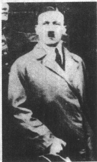
◀啤酒馆政变后入狱