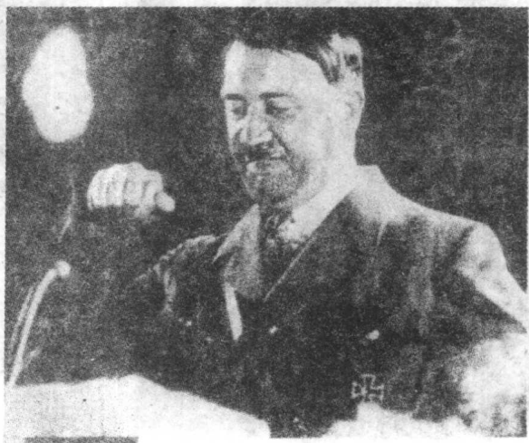
▼ 希特勒在宣传“反犹”政策