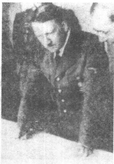
◀“二战”初期,希特勒制定 侵略计划