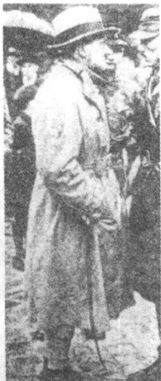
▲1926年希特勒接管「纳粹党」的宣传工作