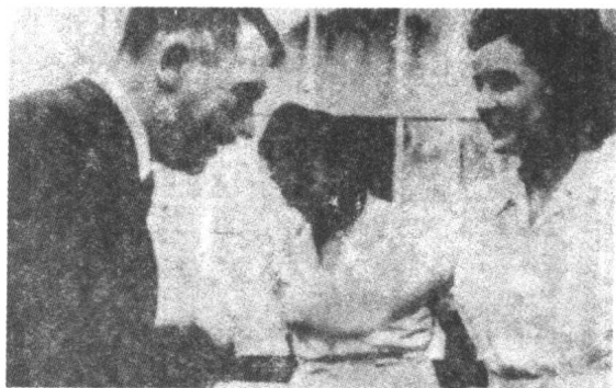
▶ 希特勒和爱娃在一起