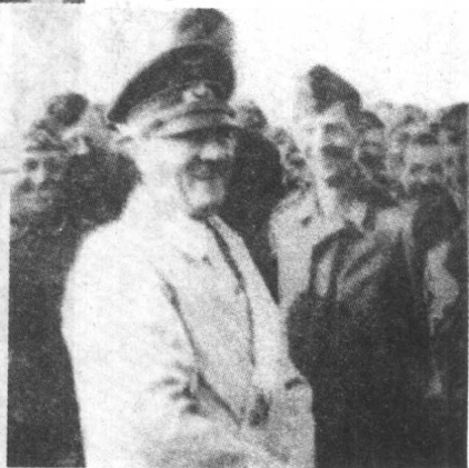
▶ 希特勒得意洋洋的