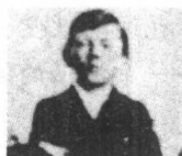
▲ 1900年林嗣中学 就读时的希特勒