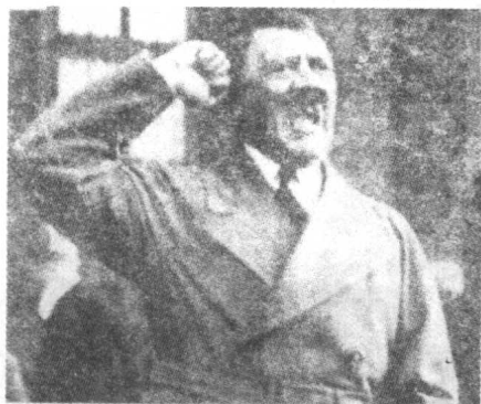
◀ 希特勒进行战争叫嚣