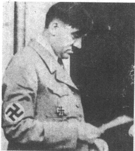
▲希特勒在准备演讲