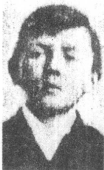
◀ 1899年的小学生希特勒