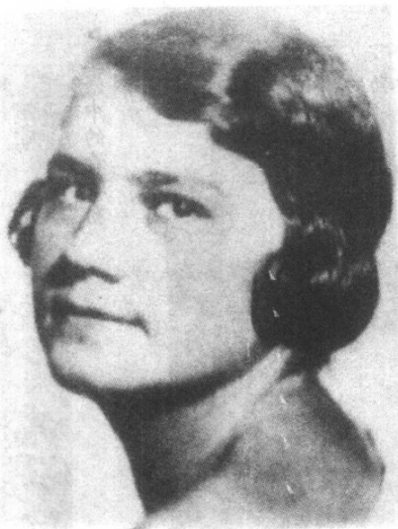
▶ 希特勒「外甥女」兼情妇吉莉