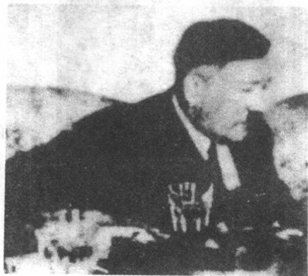
▶ 希特勒正在准 备演讲材料