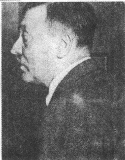
身的希特勒 ▲ 1944 年被病魔缠