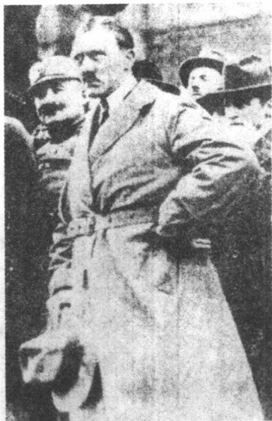
▲1920年希特勒接管“纳粹党”的宣传工作