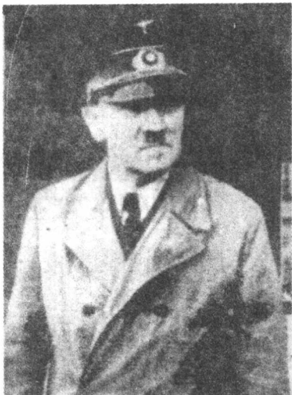
◀ 1942 年的希特勒