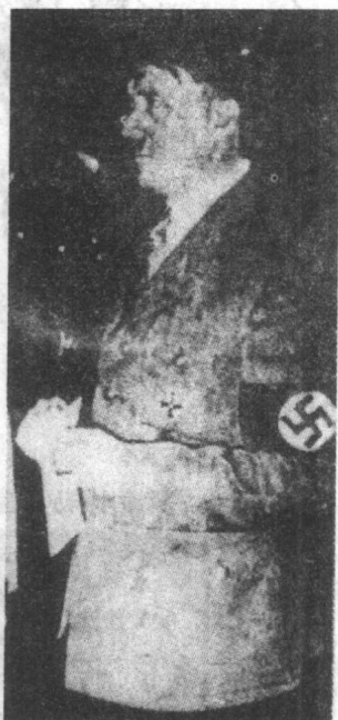
▲1934年任总理满一周年的 希特勒