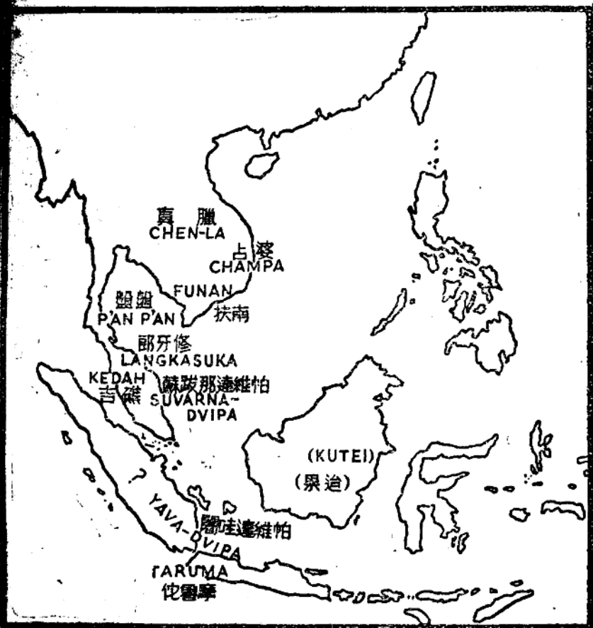
公元一世紀至五世紀的古代國家