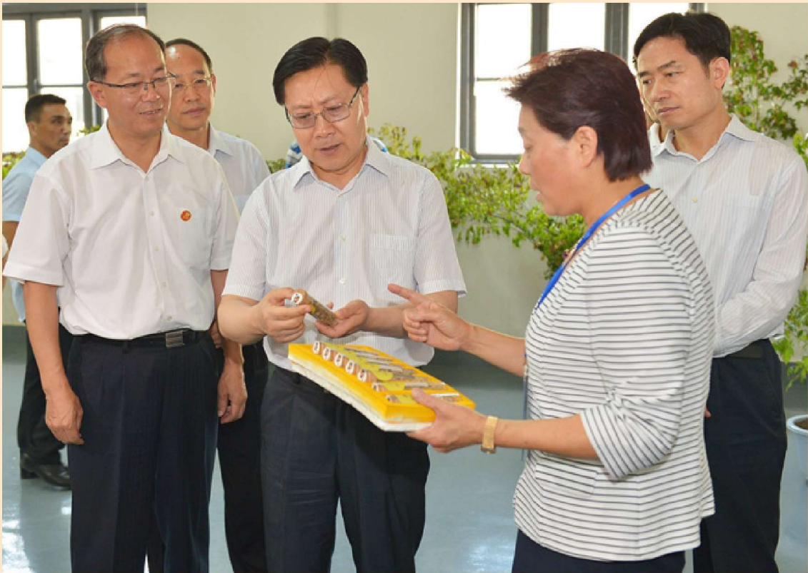
2015年6月10日，省委书记王东明（左三）在万源市花萼绿色食品公司调研，详细了解企业富硒农产品深加工相关情况，市委书记焦伟侠（左二）陪同调研