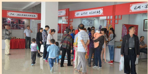
民间文化手工艺广场汇