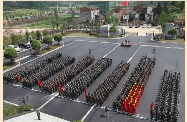
民兵实战化集中整组点验