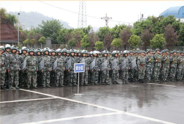
民兵反爆恐应急处突拉动演练