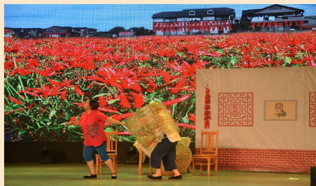
10月11日晚，三农专场文艺比赛暨“群星奖”曲艺大赛决赛在国网达州供电公司举行