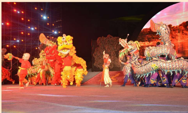
10月11日，农民达人秀在达川区城区天益广场举行