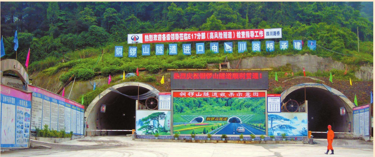
2014年5月21日，南大梁高速公路重点控制性工程铜锣山隧道贯通