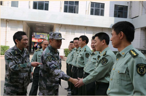
司令员易继强在万源市检查工作