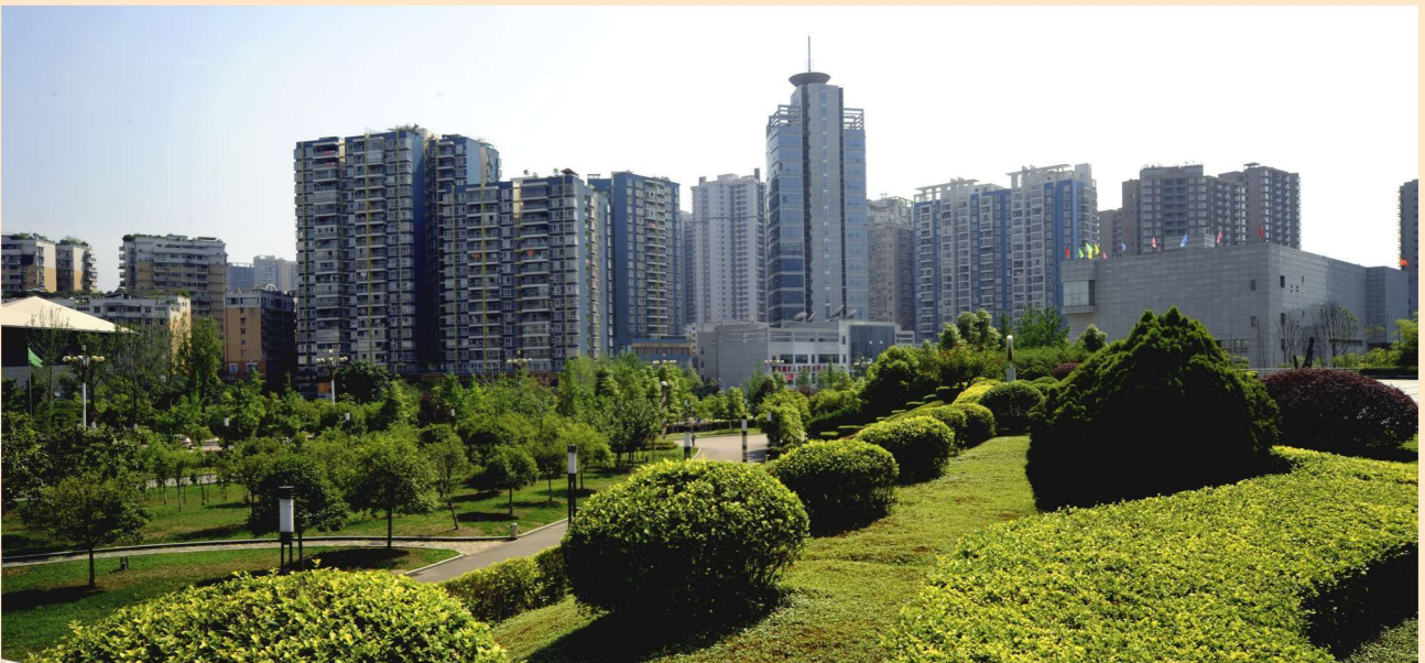
2014年3月30日，四川省绿化委员会授牌命名达州市为四川省森林城市