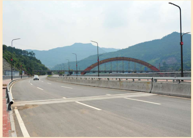
2014年10月，西南职教园区南北干道竣工通车