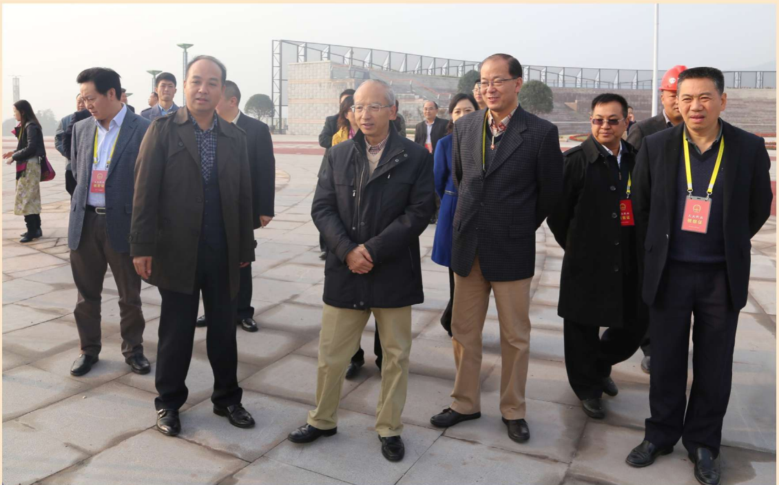
2014年11月11日，市人大常委会组织市辖区内的全国、四川省人大代表视察工业园区建设、现代服务业发展、文化项目建设等情况