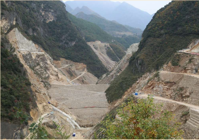
2014年8月，全国重点水源工程建设项目——宣汉县白岩滩水库主体工程竣工