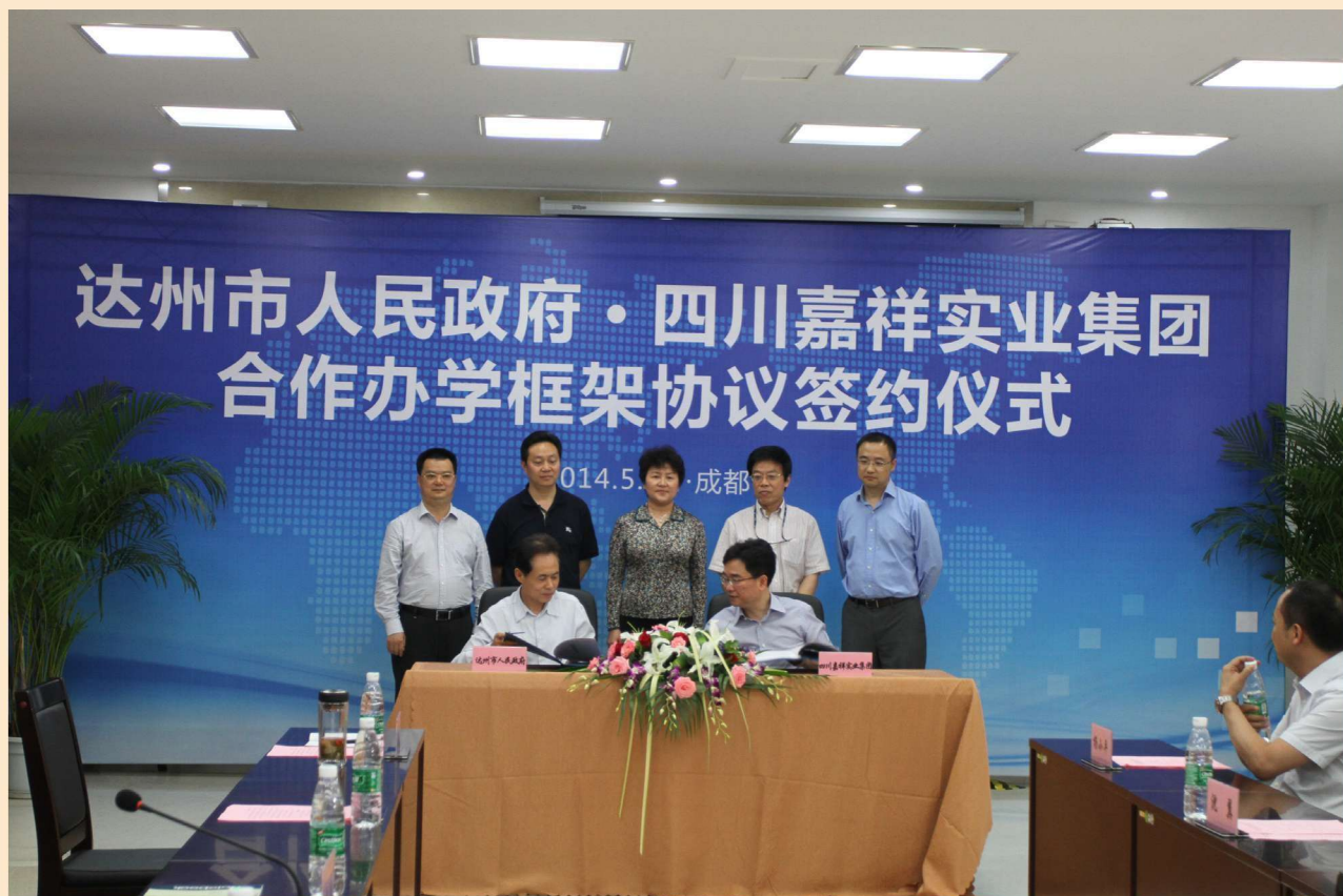
2014年5月30日，达州市人民政府与四川嘉祥实业集团联合办学框架协议签约仪式在成都嘉祥外国语学校举行