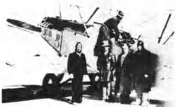
抗战爆发后，苏联向中国 派出志愿航空队参加保卫 武汉的空战 ▲