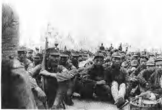
红军和国民革命军一起听取抗日救国形势报告。