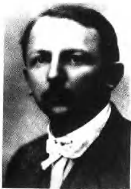
列宁派遣来中国的共产国际代表马林