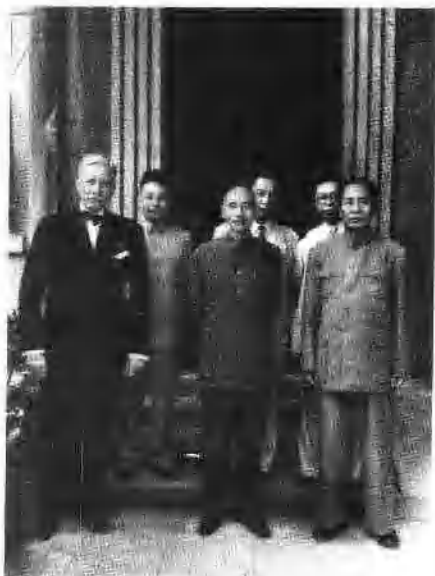
国共两党在重庆举行和平谈判期间，毛泽东，蒋介石合影。