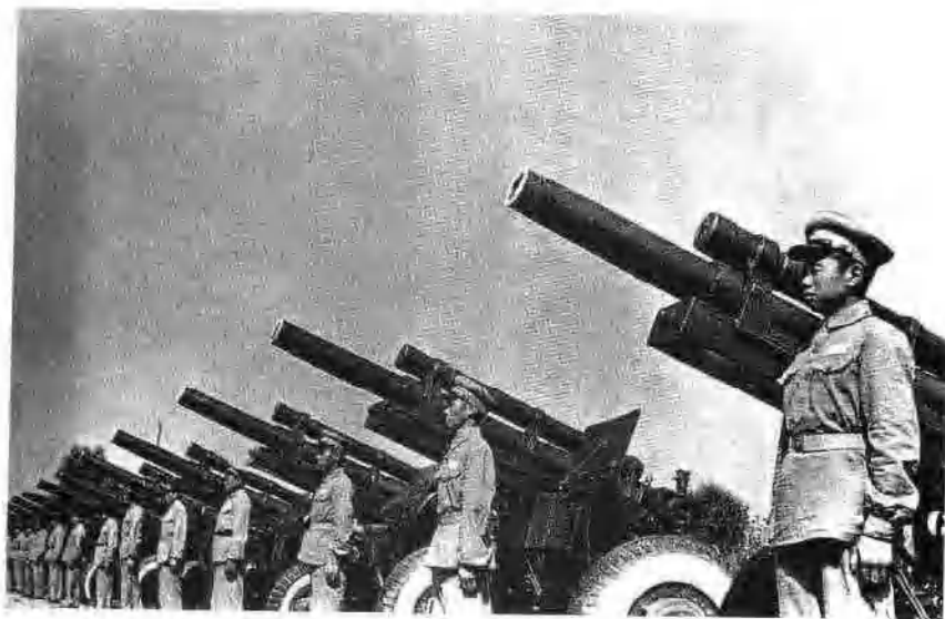
经受战争考验的人民炮兵部队。