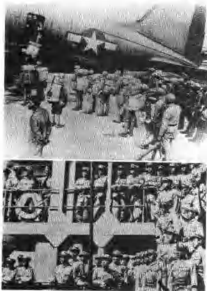
美国政府用飞机和军舰帮助国民党运兵到内战前线。