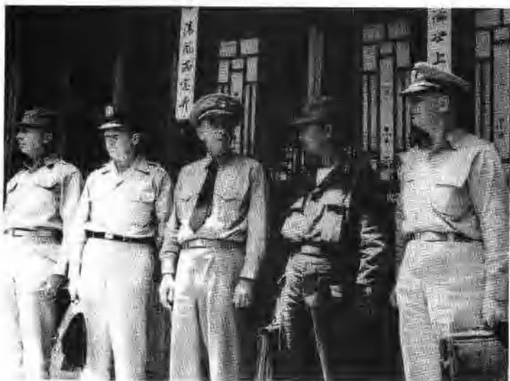
南朝鲜和美国谈判代表。