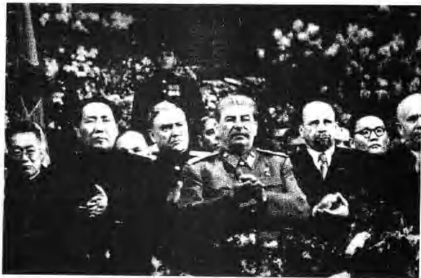
1949年12月，在莫斯科庆祝斯大林七十周年诞辰大会上。