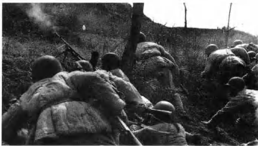
志愿军在金城战役中