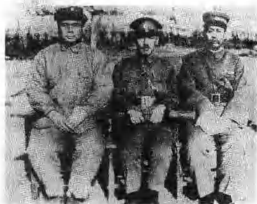
蒋介石、冯玉祥、阎锡山。