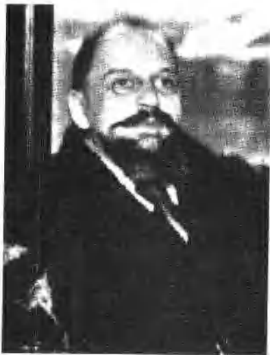
越飞，1923年1月赴上海与孙中山多次会晤