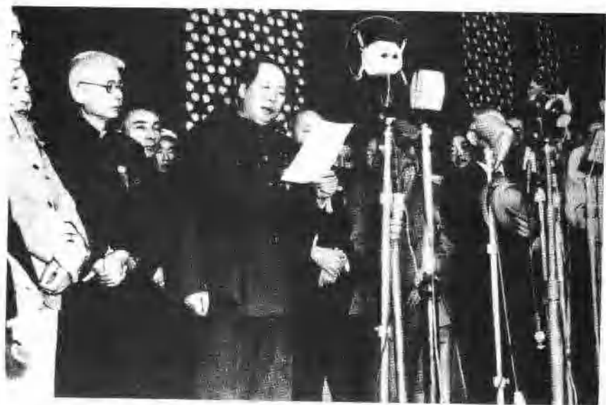
1949年10月1日，中华人民共和国中央人民政府成立。