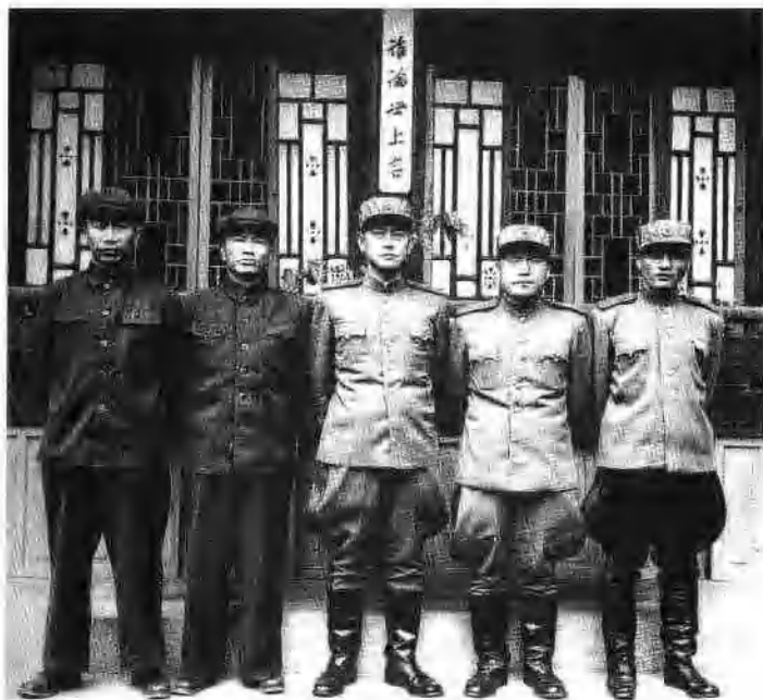
1951年7月，朝鲜停战谈判在开城开始举行。朝中方面谈判代表。