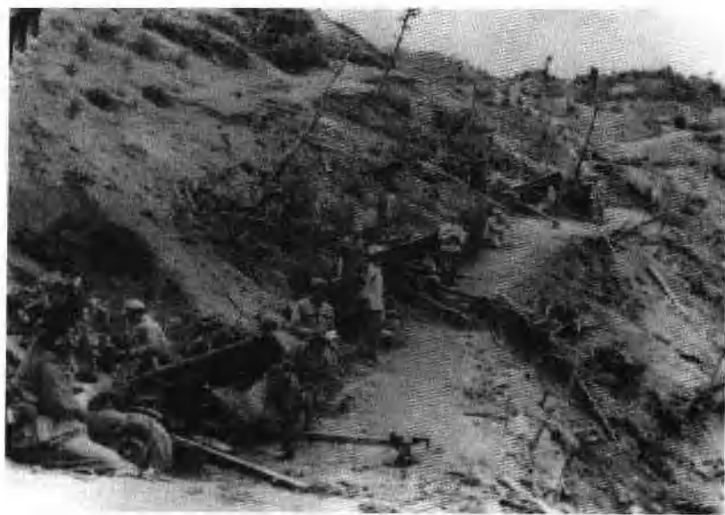
志愿军火箭炮阵地