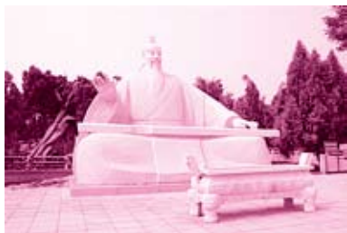
帝舜雕像：帝舜是上古时期“三皇五帝”之一，华夏民族的人文始祖。

舜的父亲瞽叟是个瞎子，舜的母亲死后，瞽叟又续娶了一个妻子，生下了象，象桀骜不驯。瞽叟喜欢象，常想把舜杀了，而舜总能巧妙地躲过灾难。舜有点小错儿，就会遭到瞽叟的重罚。尽管这样，舜始终恭敬侍奉父亲、后母及后母弟，一天比一天谨慎，不敢有一点点儿的懈怠。