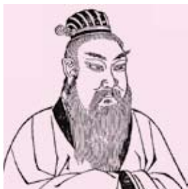
帝喾：上古时期“三皇五帝”之一，华夏民族的人文始祖。

帝喾的出生极具传奇色彩，一出生就叫出了自己的名字。帝喾即位后，对老百姓广施恩泽，对于自己很少照顾。帝喾能明辨事物的是非曲直，预知未来，懂得治国爱民的道理。帝喾顺应天意，了解民急，仁德而且威严，修养自身，天下安宁。帝喾富有四海，却从不奢糜浪费。此外，帝喾推算日月的运行以修订历法；明识鬼神，慎重地加以事奉。他仪表堂堂，道德高尚。