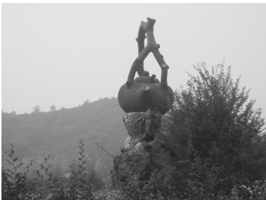
顾渚村村口茶壶雕塑

紫笋茶生长在顾渚山上。顾渚山位于天目山余脉尾端，夹在南川山、尧市山之间，形成三条平行的山谷。顾渚山属于低山丘陵，坡度平缓，地势由西向东倾斜，植被丰富。土层厚，有机质含量高，适宜茶树生长。