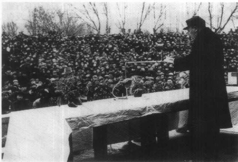
1951年3月24日，公安部部长罗瑞卿作镇压反革命的动员报告。