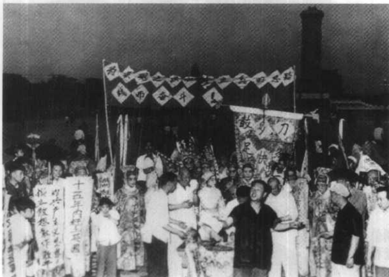
北京文艺界人士在天安门广场宣传总路线。