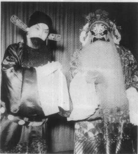
1951年5月5日，中央人民政府政务院发布了《关于戏曲改革工作的指示》，提出了“改戏、改人、改制”的要求。这是改编后的京剧《将相和》剧照。