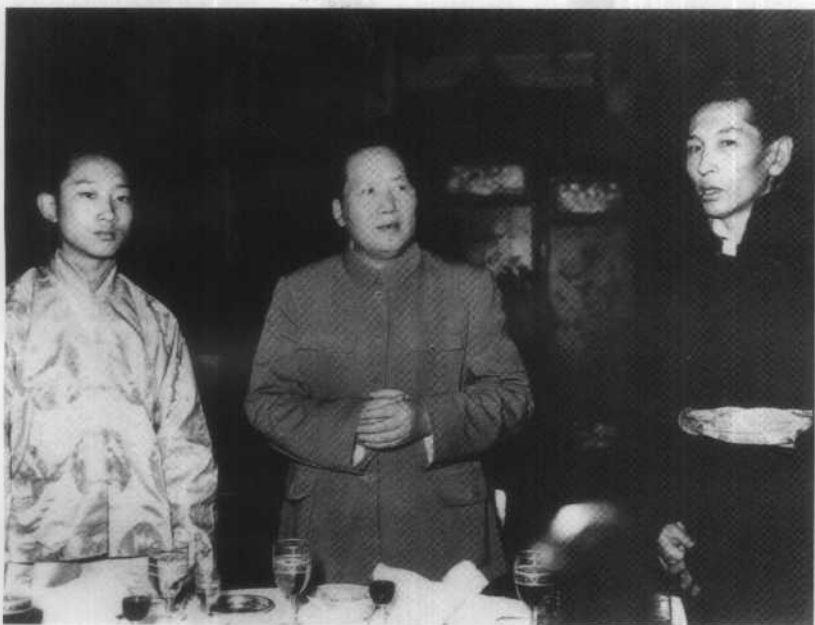
1951年5月24日，中央人民政府主席毛泽东设宴招待阿沛·阿旺晋美(右)与班禅额尔德尼·确吉坚赞(左)。