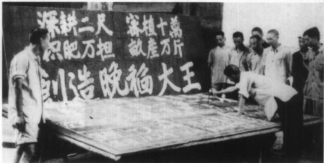
各地以虚假的高指标、高纪录相夸耀。