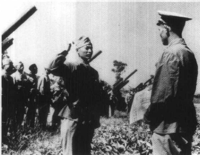
1958年8月23日，人民解放军福建前线部队对大、小金门、大担、二担等岛屿进行猛烈炮击，摧毁岛上国民党守军的大量地面工事和炮兵阵地。图为炮兵某部在炮击金门前表决心。