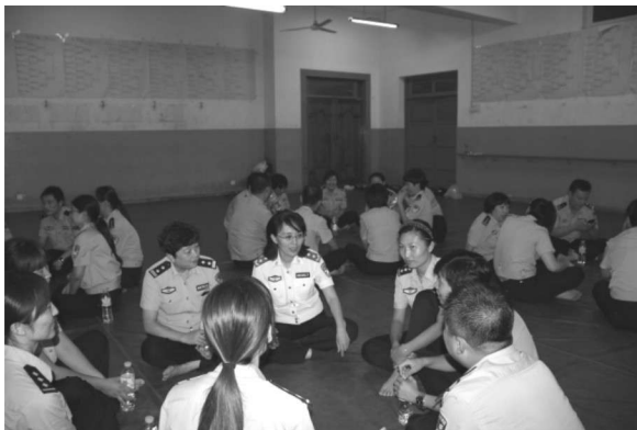
(警察心理拓展活动)

通过调查警察职业可能存在的压力源，探讨中国警察应如何缓解所面临的压力。请写一篇调查报告并做口头报告。