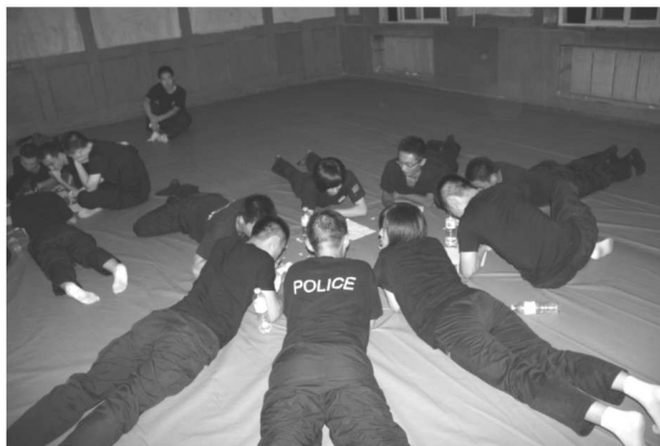
(警察心理放松训练)