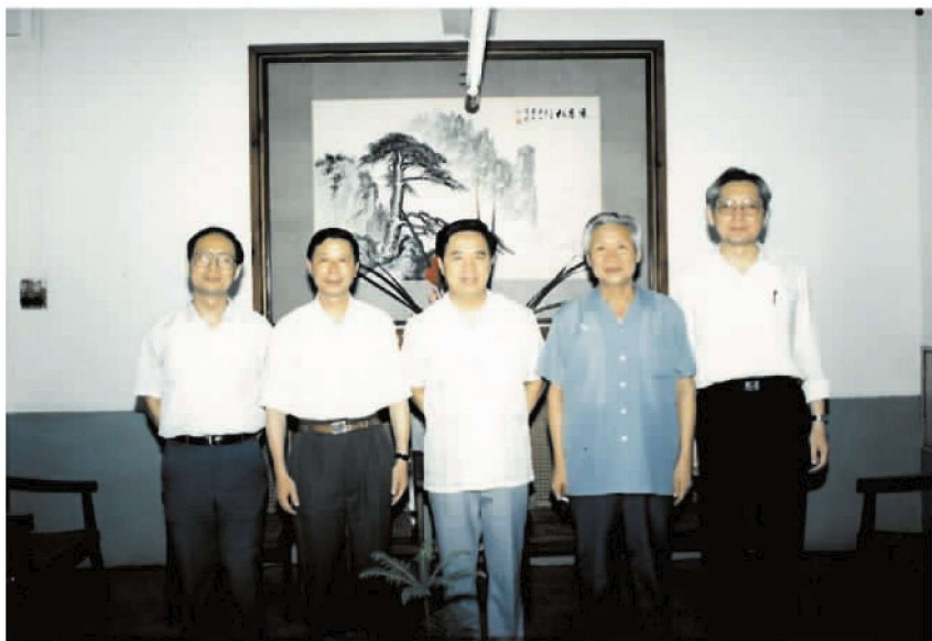
1993年7月，时任铁道部副部长傅志寰(中)来校视察并与学校新、老党政主要负责人合影