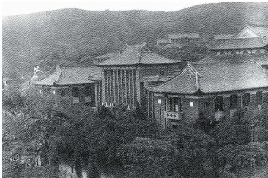
1953 年成立的中南土木建筑学院旧址