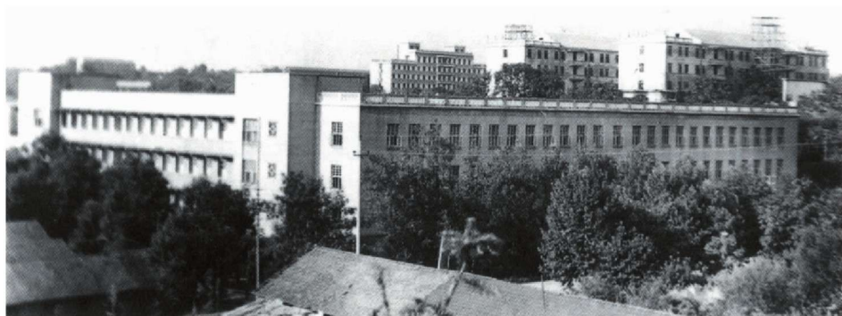
1960 年建校初期的教学楼