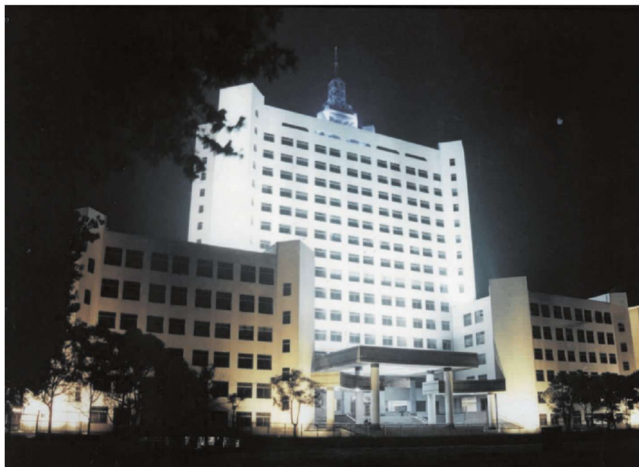
1998 年 6 月竣工的新教学楼——世纪楼