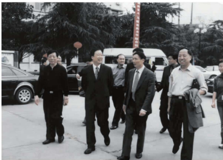
纪念长沙铁道学院组建50周年时，铁道部党组书记、副部长孙永福(左二)回母校，在时任中南大学党委书记胡冬煦(左一)、校长黄伯云(右二)、党委副书记周庆柱(右一)陪同下视察学校