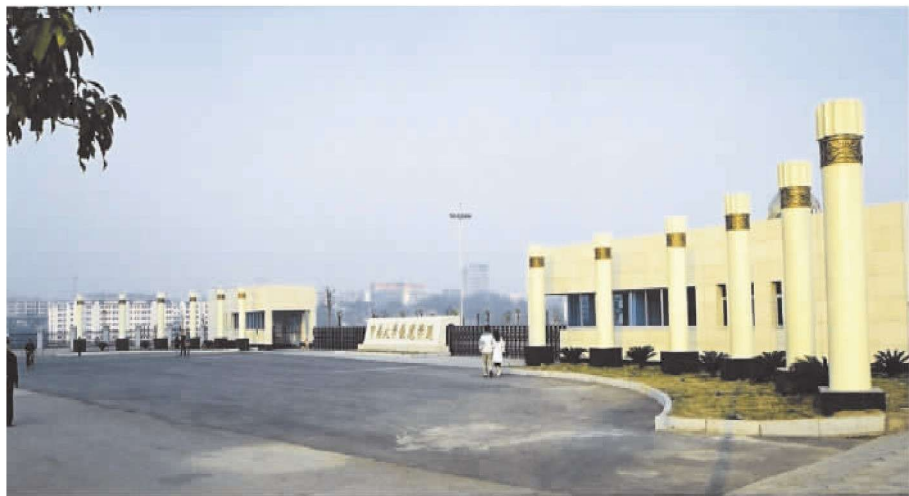
21 世纪初学校西大门