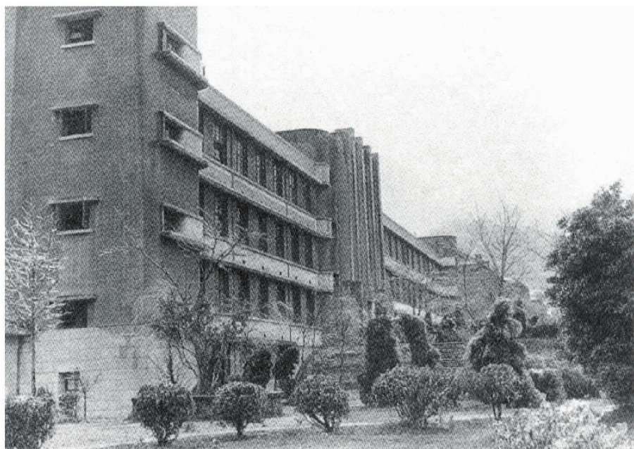
1958 年铁道建筑系、桥梁与隧道系、铁道运输系旧址