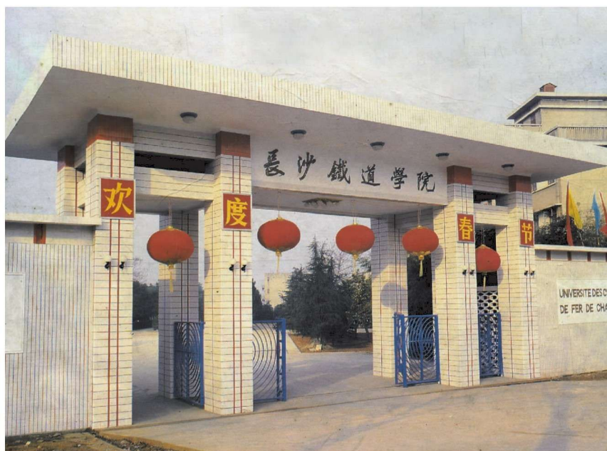
20 世纪 90 年代学校大门