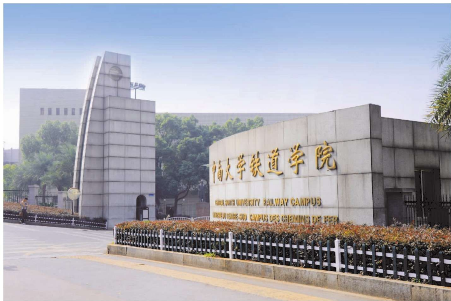
21 世纪初学校东大门