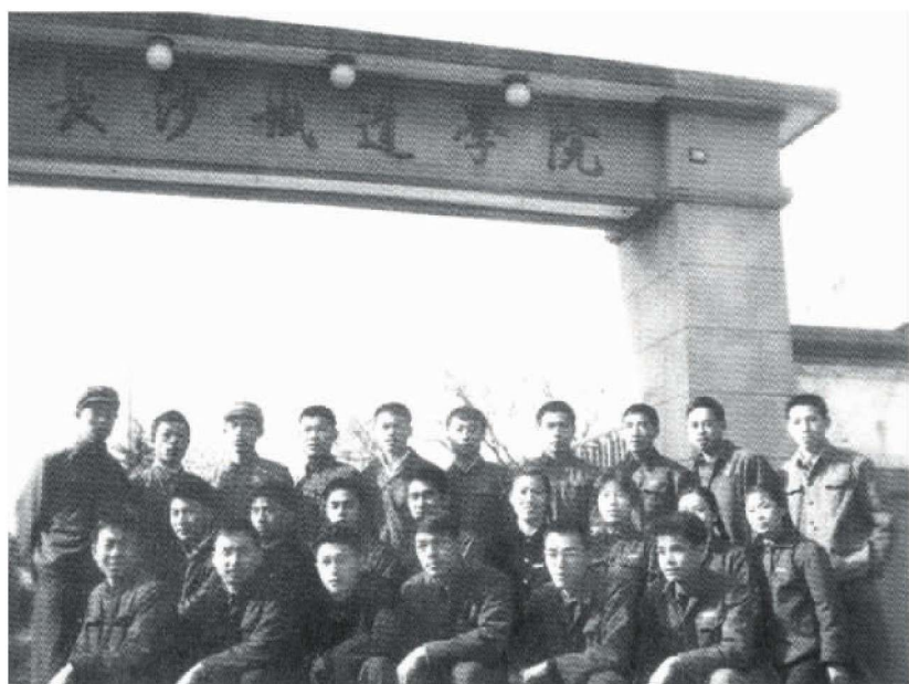
20 世纪 70 年代学校大门