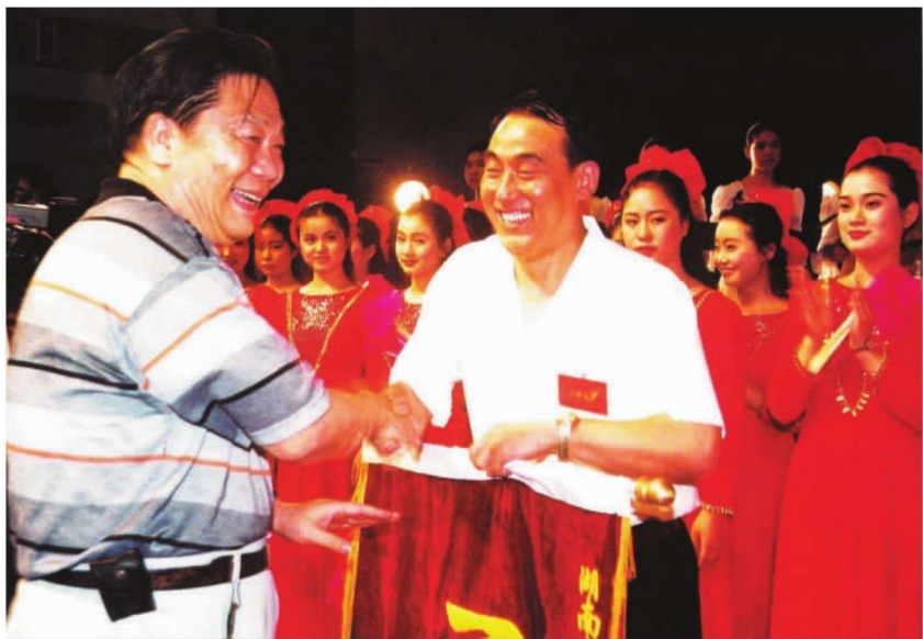
1996年7月，长沙铁道学院学生参加省委宣传部举办的庆“七一”全省群众歌咏比赛获一等奖，图为时任省委书记王茂林(左一)与参加歌咏比赛的学生在一起