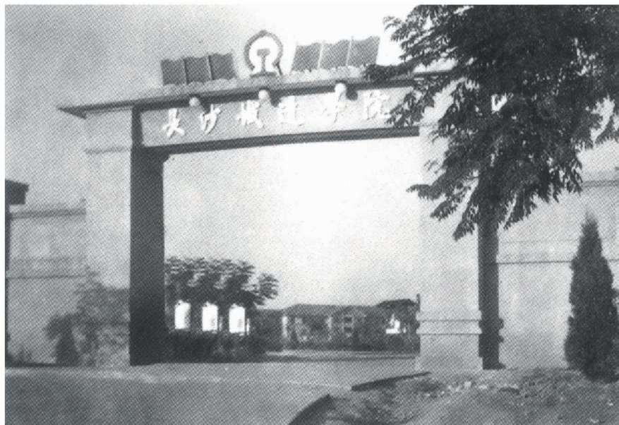
20 世纪 60 年代学校大门