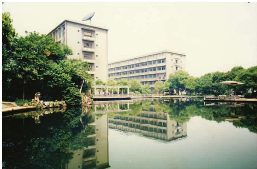
坐落在池塘边的“机械楼”和“电子楼”