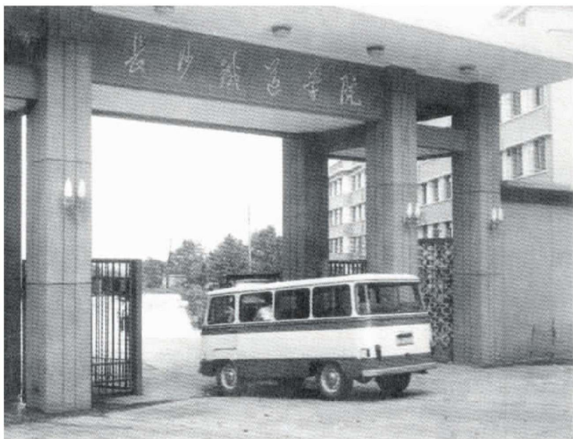
20 世纪 80 年代学校大门