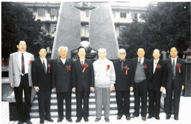
2000年10月，时任铁道部党组书记、副部长孙永福(左四)与原长沙铁道学院历任党政正职领导朱国栋(右五)、赵觉民(右四)、景岩(左三)、曾俊期(左二)、田家瑞(左一)、谷士文(右二)、周庆柱(右一)在原址纪念碑前合影留念