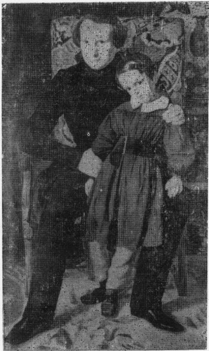
雨果与次子弗朗索瓦·维克多