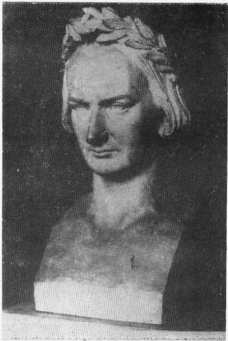
戴桂冠的雨果胸像