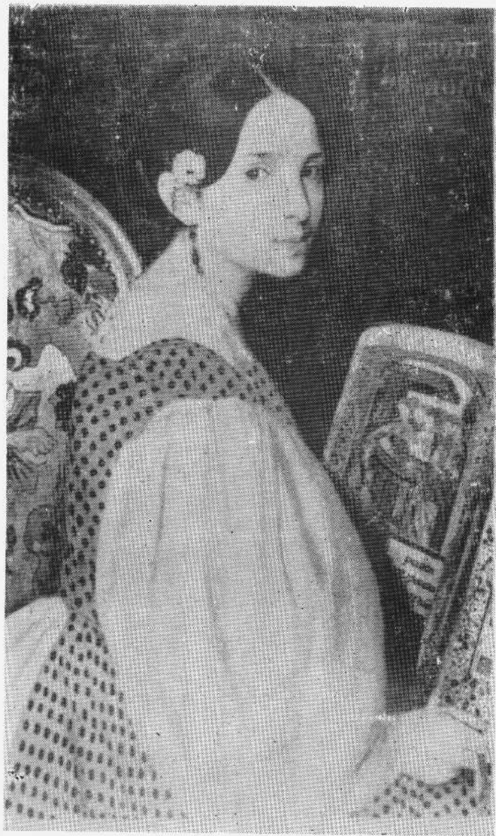
莱奥波特蒂娜和祈祷书(11岁)