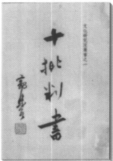
《十批判书》 一九四五年三月 重庆文治出版社初版本书影