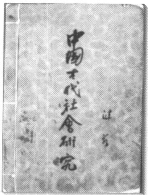
《中国古代社会研究》 一九三〇年三月上海 联合书店初版本书影